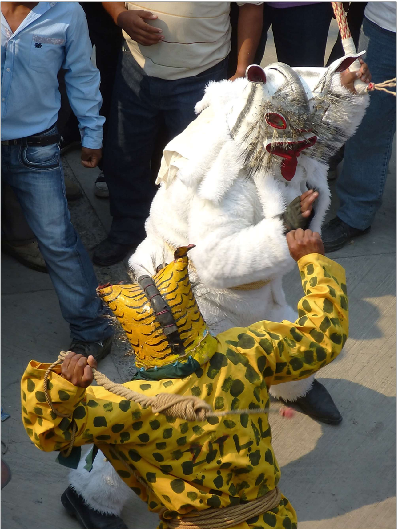
Combat de « tigres » – Zitlala, 5 mai 2013