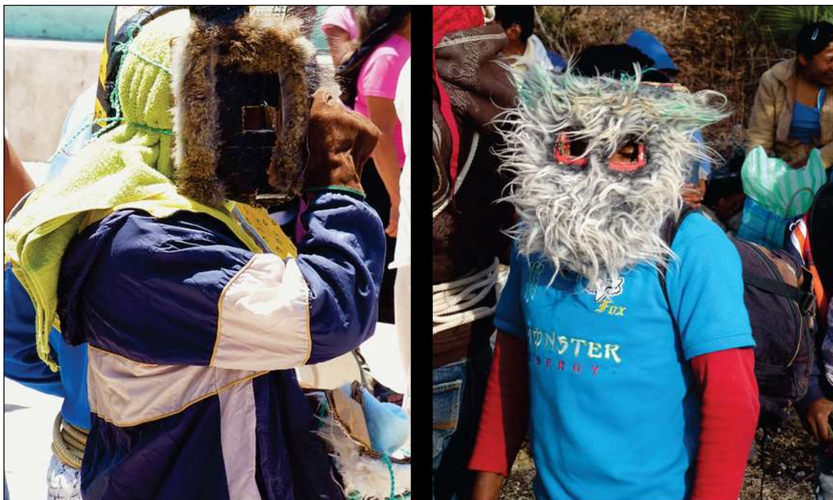
Masques en carton – Pochahuisco, 25 avril 2012

La raison de cette augmentation peut se comprendre par l'utilisation, dans les affrontements aux poings, de masques pouvant être constitués d'une simple couche de cuir ou de carton affermit de mousse [ photos suivantes ] facilitant une participation plus spontanée, moins exigeante au rituel alors que les robustes et rigides heaumes utilisés dans les combats à la reata requièrent un savoir-faire que seuls détiennent ceux qui les fabriquent à Zitlala.