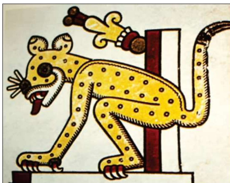
Le « tigre » plébiscité par la mairie en 2013 (à gauche) reproduit fidèlement le glyphe d' ocelotl (à droite)

Il semble que le mot ocelotl , mal traduit par « tigre », s'est peu à peu apparenté à tecuaní , terme qui apparaît dans « le Vocabulario de Fray Alonso de Molina (1571) et provient de te : gente [gens],