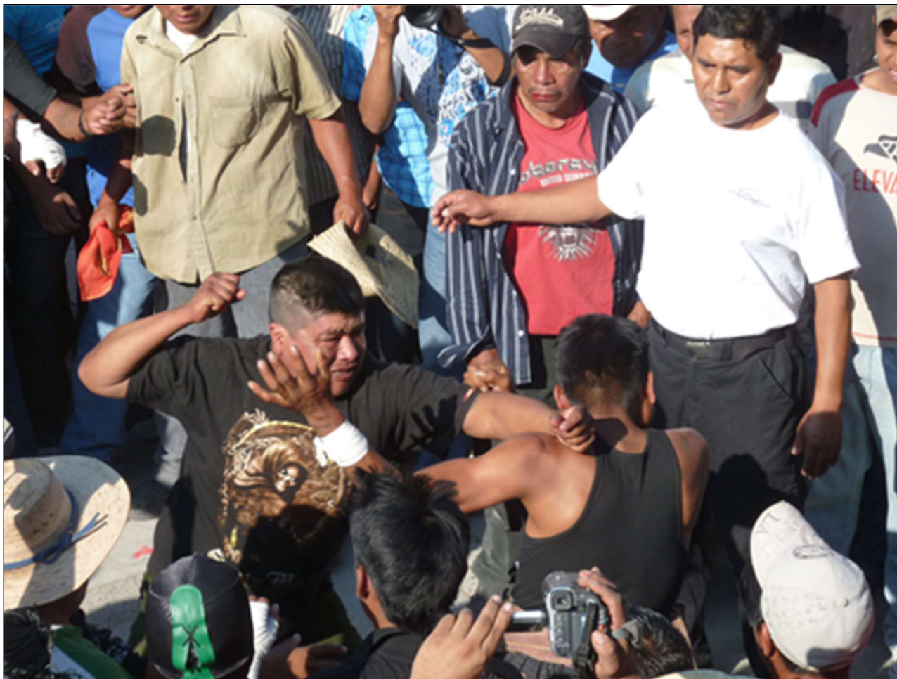
Sous le regard vigilant d'un refere, xochimilcas – Zitlala, 8 mars 2011

Loin du chaos que l'on pourrait imaginer, ce moment des combats où se réunit sur la place civique plus d'un millier de participants nécessite a contrario une réelle ordonnance du temps et de l'espace. Chaque groupe de xochimilcas possède ses propres referes et tous observent une parfaite impartialité dans leur intervention, étant tour à tour lutteurs ou arbitres [ photo ci-après ].