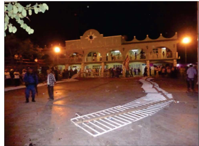
Destin des barrières limitant l'aire d'affrontement – Zitlala, 5 mai 2012

Pour l'habillement, c'est souvent à l'avenant. Quelques-uns portent des combinaisons jaunes sur lesquelles sont tracés, à l'aide d'un bambou trempé dans de la peinture noire, des cercles symbolisant les taches du félin, mais la plupart n'ont aucune tenue particulière. Un homme a marqué les mémoires pour s'être battu en short durant des années, d'autres sont pieds nus ou torse nu, ou alors, tout au contraire, n'hésitent pas à superposer des vestes molletonnées en pleine chaleur pour amortir les coups.