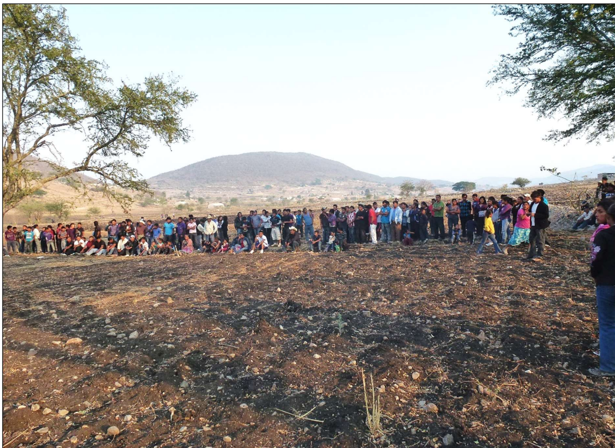
Avant les combats – La Esperanza, 2 mai 2012

Sur chacune de ces lignes, les combattants potentiels, la plupart debout, sont alignés dans le côtoiement serré de leur corps et donnent ainsi à voir clairement au camp opposé le nombre et la physionomie des participants – hommes, femmes, enfants – mais aussi leur état d'esprit, individuel et collectif, à travers leur posture.