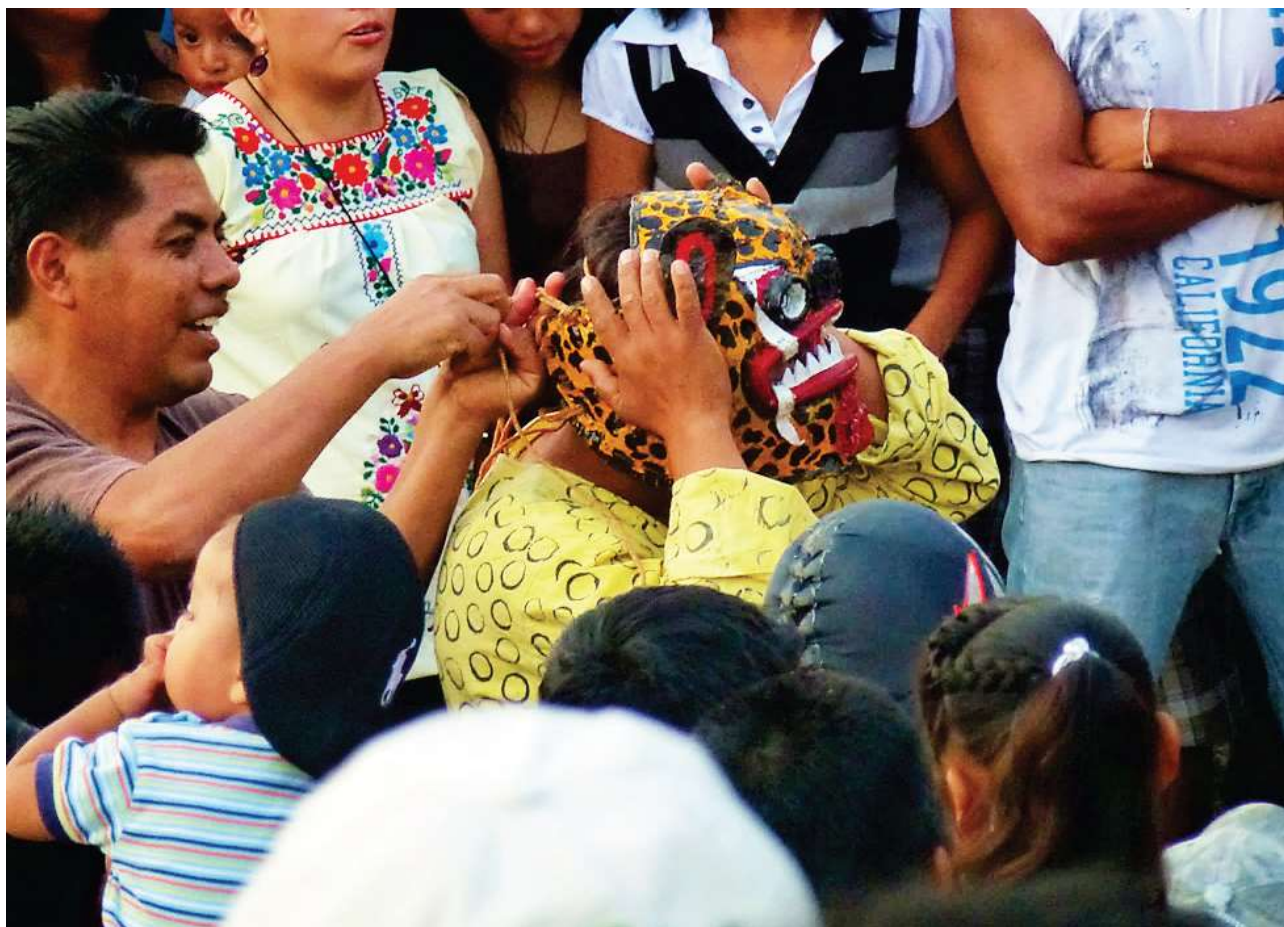
Laçage du masque d'un « tigre » de Comulian – Acatlán, 3 mai 2012

Contrairement aux peleas de tigres de Zitlala, les combats d'Acatlán ont lieu en même temps que d'autres expressions rituelles, notamment celles en relation avec les danses. Ils s'en différencient également dans leur pratique et par les masques utilisés : les tigres d'Acatlán se portent des coups au visage avec leurs poings recouverts de gants de boxe ou de travail, la tête protégée par un masque de cuir à l'effigie du tigre et ajusté par un système de laçage à l'arrière [ photo ci-après ].