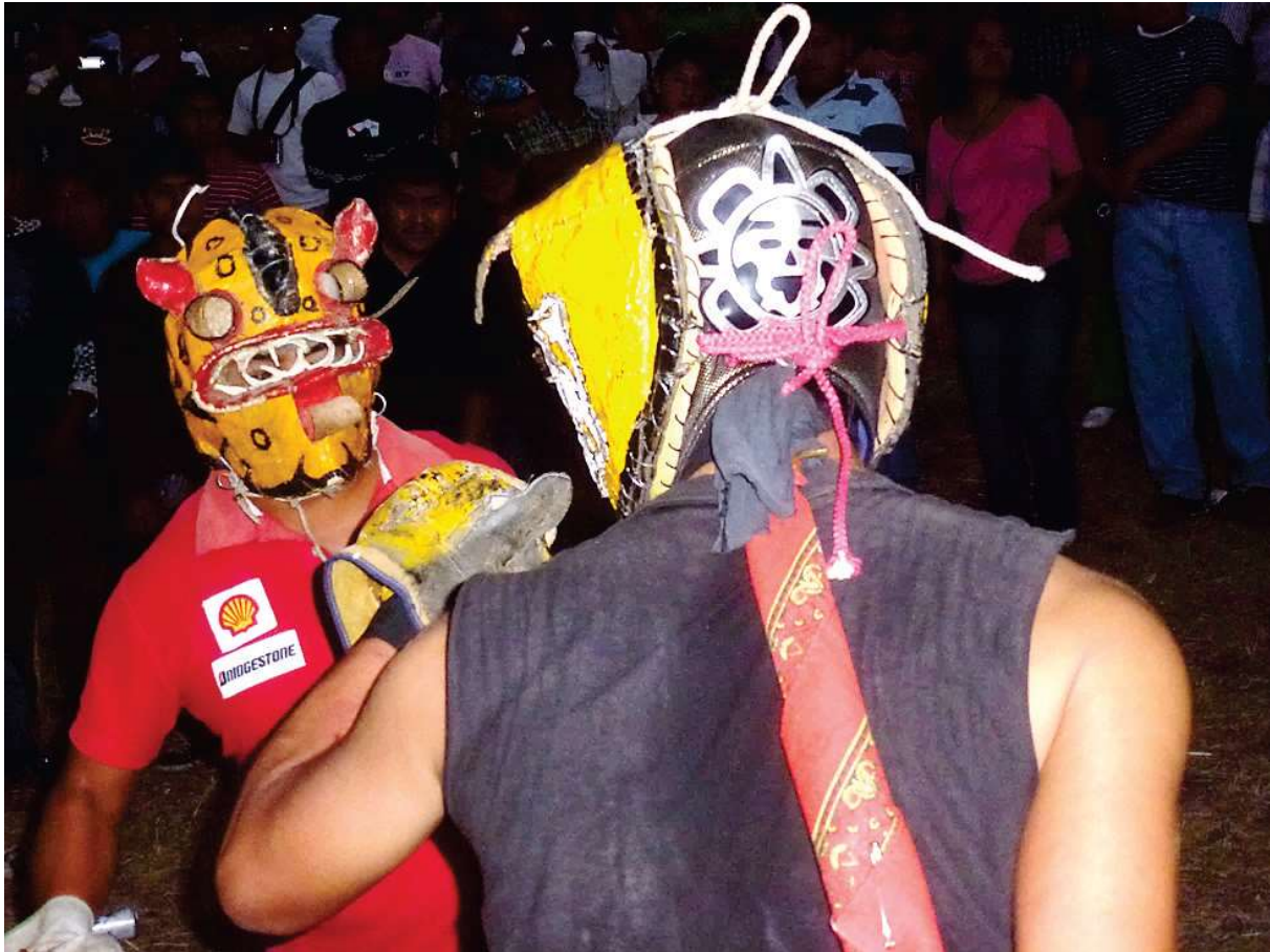
Combat de « tigres » – Acatlán, 3 mai 2012

Ces approches distinctes, et parfois antagoniques du combat entre les migrants et les locaux, semblent, d'après des reportages vidéo de la décennie précédente, avoir transformé l'affrontement en soi. En 2012, j'ai pu observer à Acatlán un type de combat plus technique, avec esquives et protections qui révèlent une certaine forme d'entraînement aux systèmes de boxe utilisant des gants (américaine, anglaise, thaïlandaise, MMA, etc.) [photo ci-après].