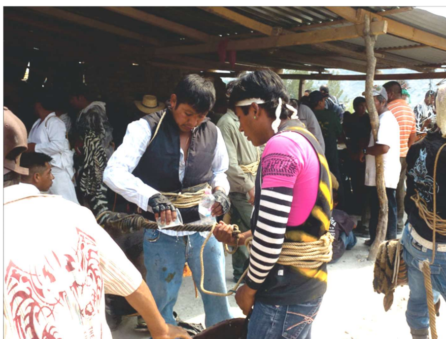
Opération consistant à imbiber la reata de mezcal – Zitlala, 5 mai 2012