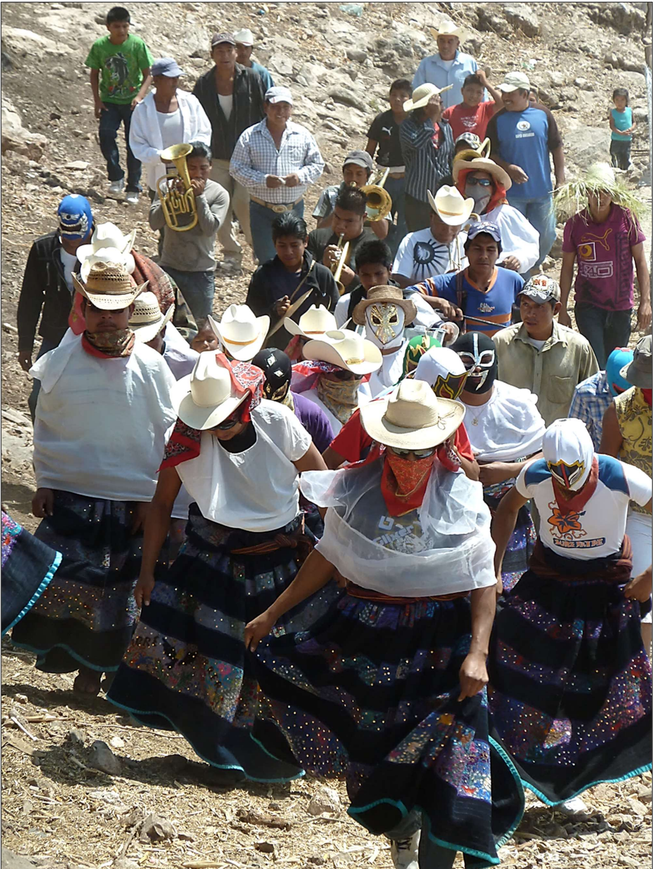
Parade d'un groupe de xochimilcas et de leur fanfare – Zitlala, 8 mars 2011

À travers leurs danses et la musique, les parades échauffent les corps et les esprits jusqu'au moment venu de la confrontation pugilistique. Envisagée de la manière la plus sérieuse, elle se prépare pour certains plusieurs semaines à l'avance par des exercices physiques appropriés, un travail sur le mental, voire une abstinence sexuelle.