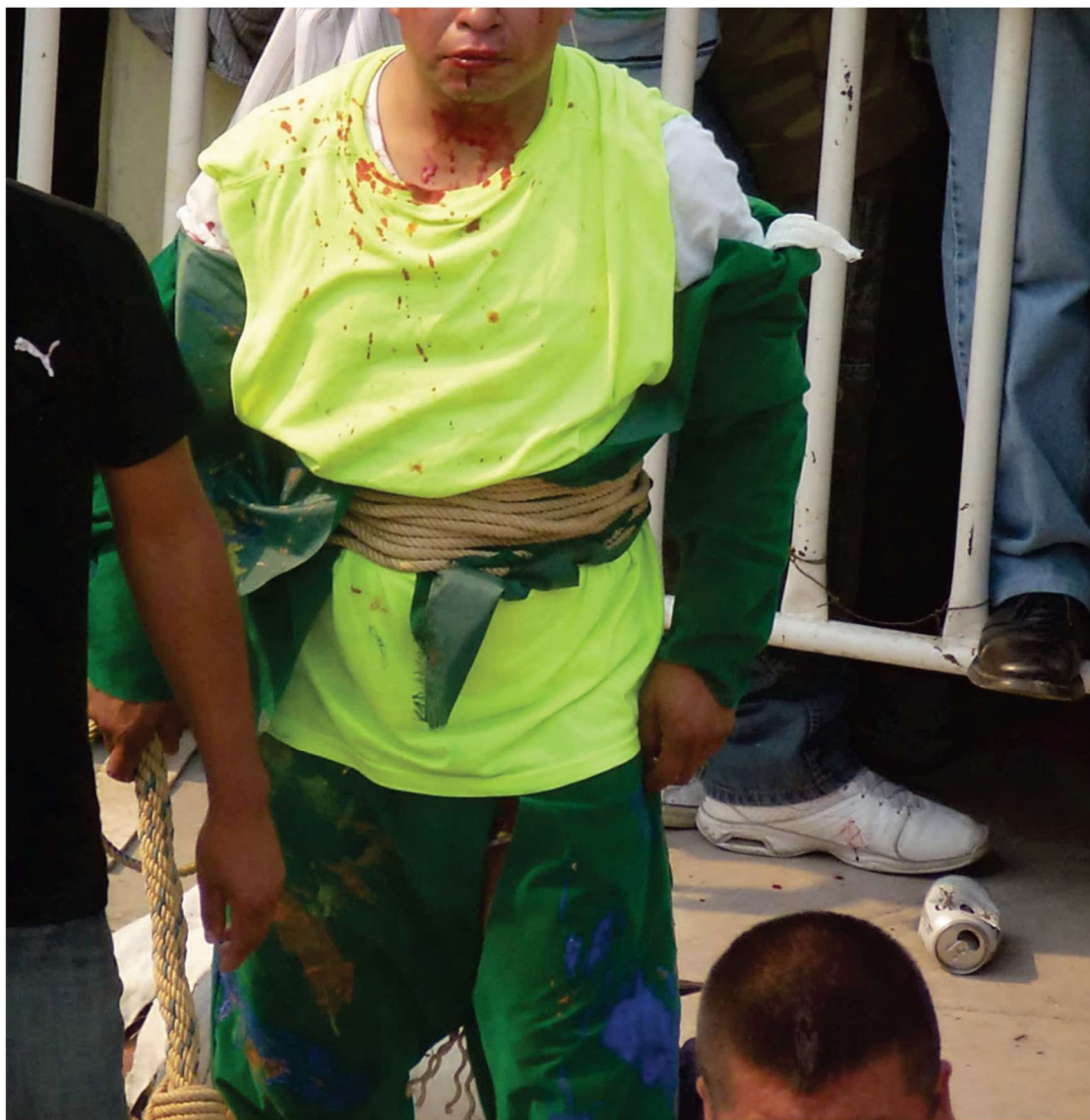
Sous le masque – Zitlala, 5 mai 2012

Toutefois, on est encore très loin de la logique sportive des différentes formes de boxe où le but est de préserver autant que possible son intégrité physique avec des gants spécifiques dont les particularités sont de protéger les poings, d'atténuer considérablement l'impact du coup sur l'adversaire tout en servant en même temps de protection, autant d'éléments qui ont pour effet d'allonger singulièrement le temps de spectacle du combat.