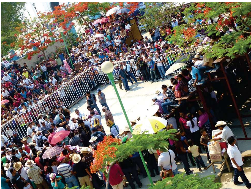
Espace de combat (fermé) des « tigres » sur la place de la mairie – Zitlala, 5 mai 2013

En 2013, en même temps qu'est dressée une tribune à l'ouest de l'enclos [photo suivante], apparaissent les premiers signes distinctifs à l'événement sous la forme d'un badge d'identification porté en collier par quelques participants, sans grand impact toutefois sur les combattants et l'organisation du rituel. Dans l'édition de 2016, des changements plus visibles se produisent impliquant une transformation majeure dans l'organisation spatiale : l'aire des combats est dorénavant « piégée » entre trois tribunes et le bâtiment de la mairie.