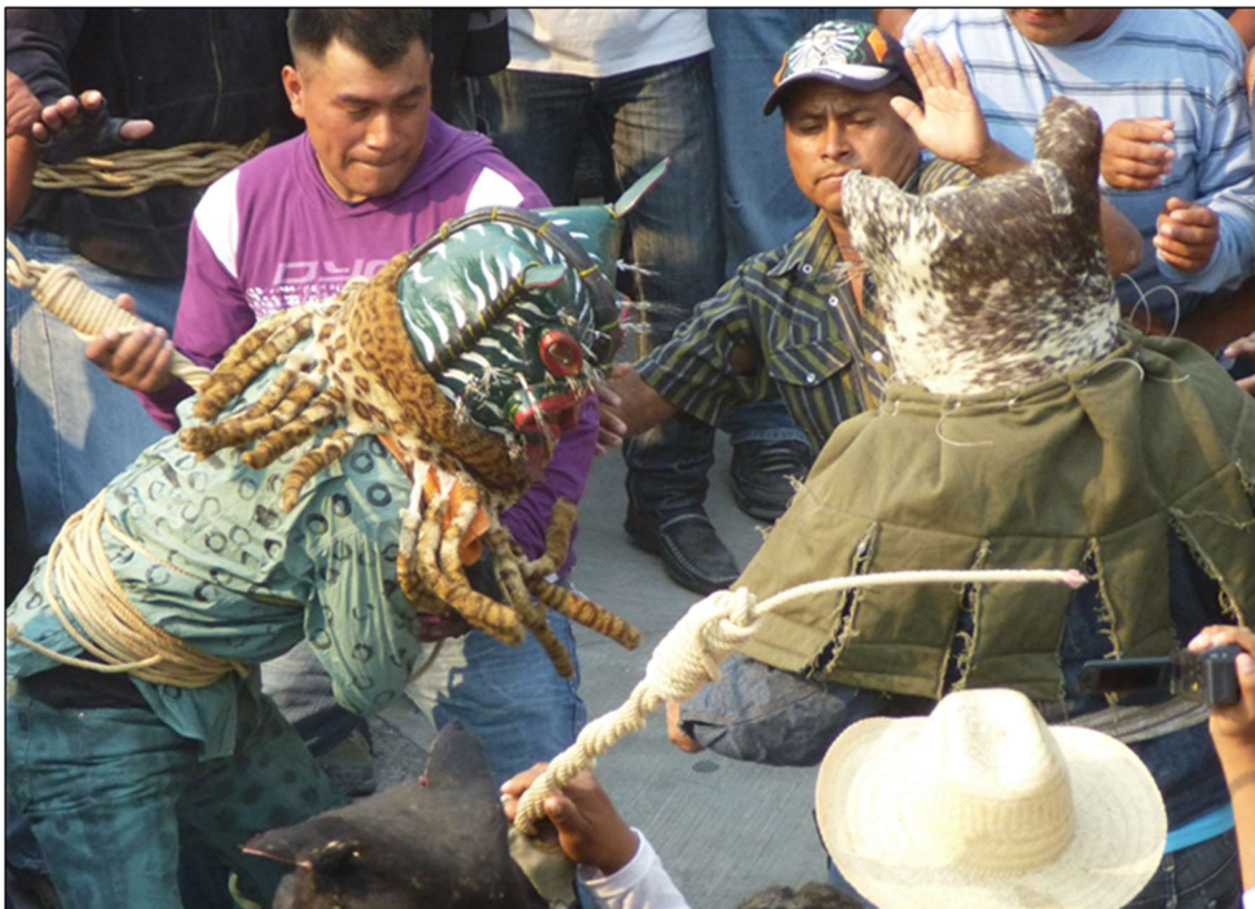
Intervention d'un refera, combat des « tigres » – Zitlala, 5 mai 2012

Tous les referes savent ce qu'ils ont à faire, c'est une attention permanente, jamais mise en défaut, où l'idée maîtresse n'est pas tant d'empêcher les excès mais plutôt de les canaliser dans des limites acceptables. Il y a un « savoir-faire » réel qui suppose là aussi une action collaborative maintenant l'espace d'affrontement dans son architecture mobile et dans l'équilibre des forces au sein de la foule en s'imposant de toute leur stature, tels des « arbres solitaires » face à la pression humaine [ photo ci-après ].