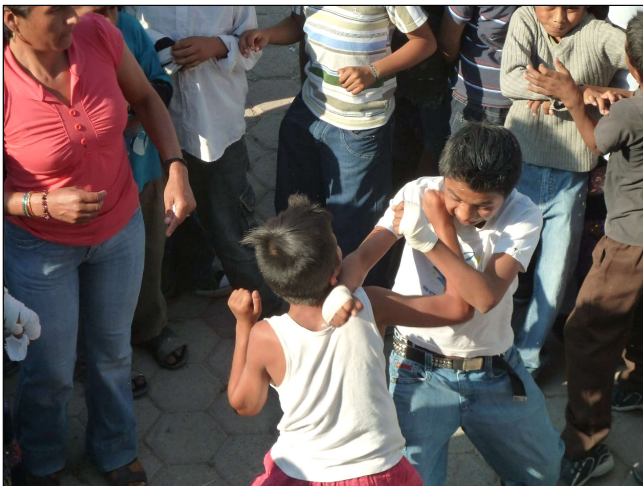
Combats entre enfants, xochimilcas – Zitlala, 8 mars 2011

En marge des affrontements entre adultes, jeunes garçons et adolescents échangent, avec toute l'intrépidité et l'inexpérience de leur jeune âge, leurs premières passes [ photo ci-après ].