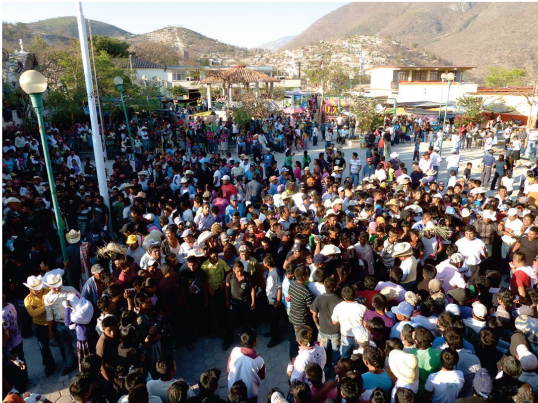
Espace de combat (ouvert) des « tigres » sur la place de la mairie – Zitlala, 8 mars 2011

En 2013, en même temps qu'est dressée une tribune à l'ouest de l'enclos [photo suivante], apparaissent les premiers signes distinctifs à l'événement sous la forme d'un badge d'identification porté en collier par quelques participants, sans grand impact toutefois sur les combattants et l'organisation du rituel. Dans l'édition de 2016, des changements plus visibles se produisent impliquant une transformation majeure dans l'organisation spatiale : l'aire des combats est dorénavant « piégée » entre trois tribunes et le bâtiment de la mairie.