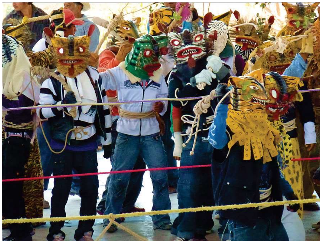
« Tigres » sur le ring – Pochahuisco, 25 avril 2012

Les combats, normalement, se produisent l'un à la suite de l'autre entre deux tigres qui se sont choisis pour s'affronter et doivent ensuite laisser la place aux combattants suivants. Mais très vite, comme à Zitlala, l'espace de combat se remplit inexorablement de ceux qui décident de rester et les referes de chaque groupe, appuyés par le service d'ordre et de quelques tigres, éprouvent toutes les peines du monde à faire respecter les usages ou à maintenir les participants à l'extérieur des cordes [ photo suivante ]. Cette situation confuse, associée à la multiplication des autorités, devient alors une source de tension provoquant de nombreuses interruptions et discussions.