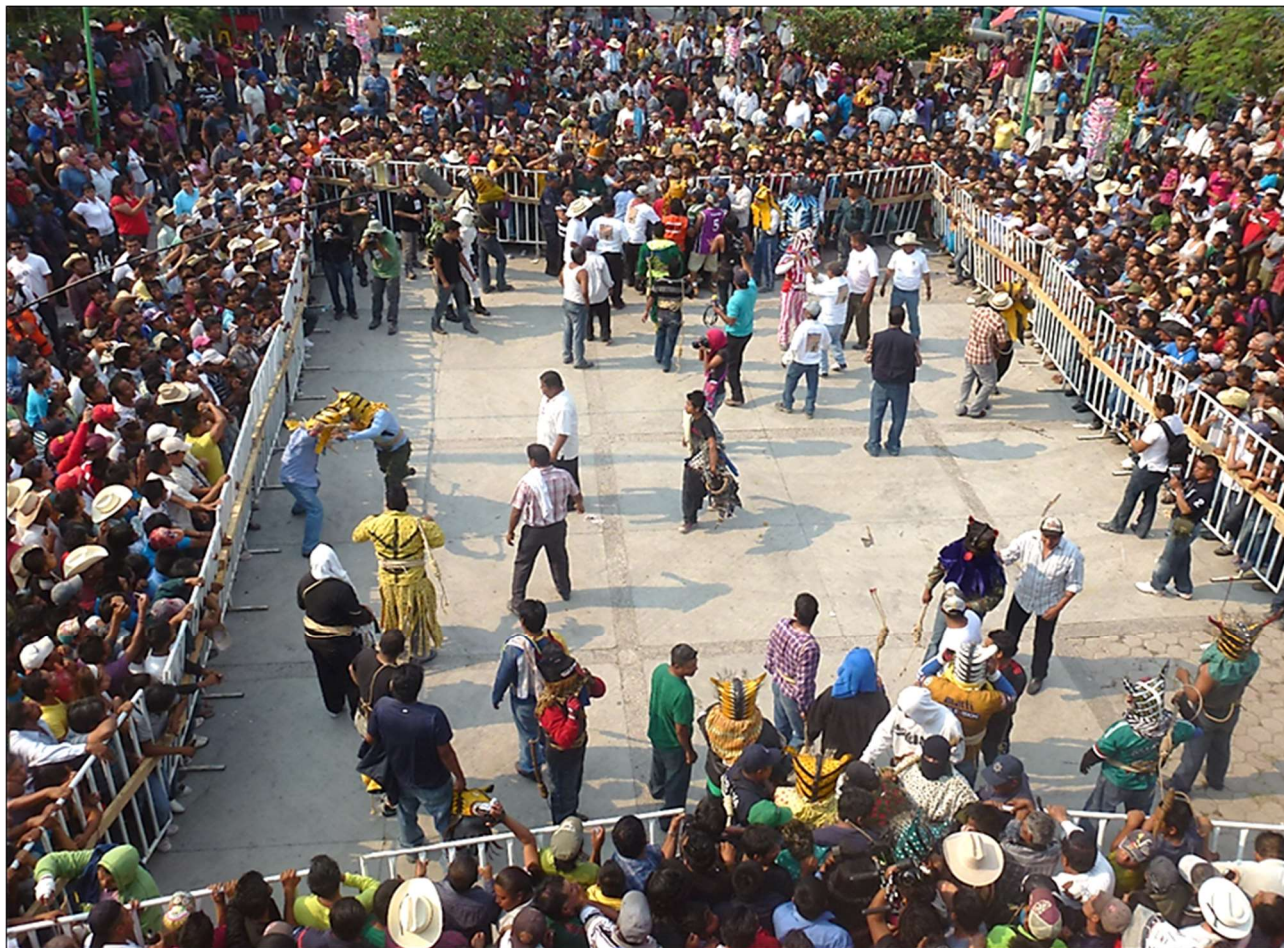
Espace de combat (enclos) et « tigres » – Zitlala, 5 mai 2013

Sur la place de la mairie, hommes, femmes et enfants, essentiellement des habitants de Zitlala, sont déjà massés autour d'un enclos mis en place pour l'occasion par les employés municipaux le matin même et à l'intérieur duquel se dérouleront les combats. D'autres, moyennant une modique somme, ont pris place sur des tribunes 472 qui dominent les côtés est et ouest de celui-ci ; quant aux toits et balcons des maisons jouxtant la place, ils affichent complet. Ce dernier, matérialisé par des barrières métalliques d'un mètre soixante de hauteur maintenues entre elles par des planches, délimite une arène carrée d'une quinzaine de mètres de côté où deux ouvertures se faisant face [ photo suivante ] serviront le moment venu de passage aux tigres suivant leur appartenance à tel ou tel barrio .