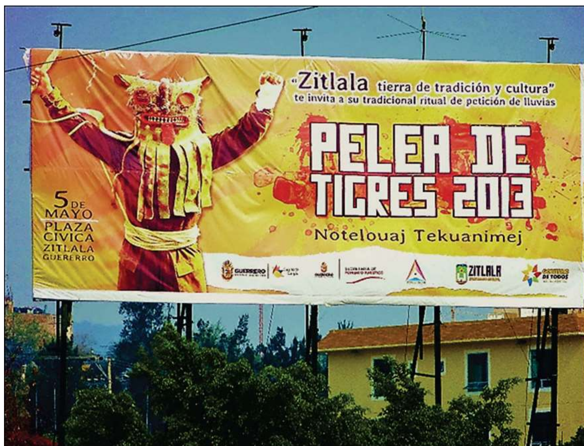
Affiche annonçant les combats rituels de Zitlala – Chilpancingo de los Bravo, avril 2013

Un des exemples fut l'intense campagne d'affichage menée en 2013 par les nouvelles autorités municipales autour des combats de tigres en louant des espaces publicitaires géants dans les grandes villes de l'État 512 à la manière d'une manifestation culturelle internationale. Sur ces affiches, on invoque avec insistance la tradition : « “Zitlala tierra de tradición y cultura” te invita a su tradicional ritual de petición de lluvias » 513 [illustration ci-après].