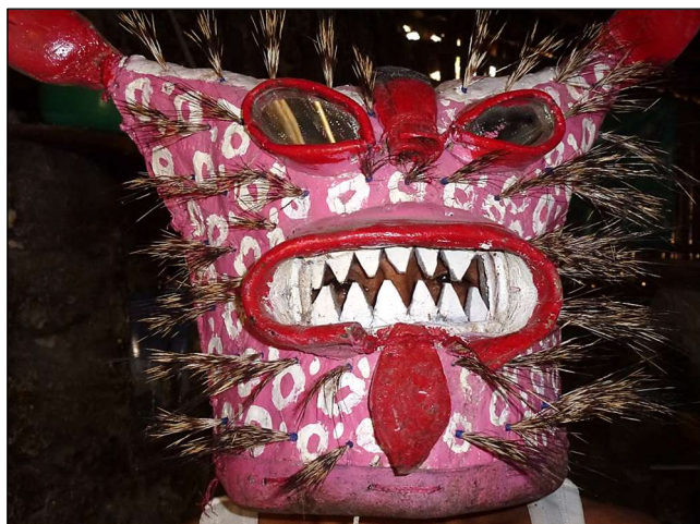
Masque de tigre – Zitlala, avril 2012

Les combattants, uniquement des hommes, s’affrontent par paire. À la différence des luttes de xochimilcas où seuls les poings sont utilisés (pour frapper le visage), les combats des tigres de Zitlala font usage de massues de corde nouée – la reata – pouvant cibler toutes les parties du corps exposées (bras, épaules, jambes, genoux) mais aussi le masque couvrant l’intégralité de la tête et représentant habituellement une tête de jaguar – tecuaní en nahuatl – communément appelé tigre dont les cavités oculaires sont remplacées par des morceaux de miroir [ photo ci-après ].