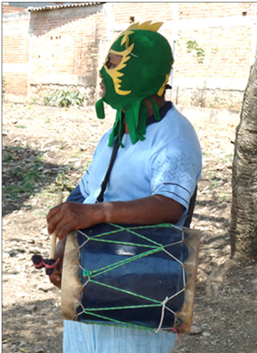
Tambour « traditionnel » lors d'une parade de xochimilcas – Zitlala, 8 mars 2011

De même, dernièrement, certains maîtres de danse se détournent des orchestres actuels et recherchent d'anciens sons pour les faire jouer par des instruments « traditionnels » [photo suivante] qu'ils tentent d'imposer comme « authentiques » face aux orchestres composés d'instruments connotés modernes.