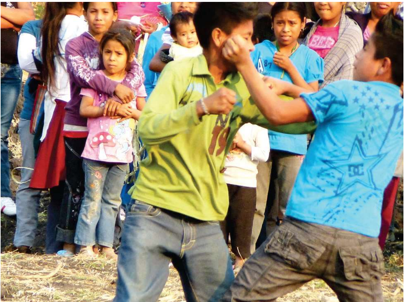
Combat entre enfants – La Esperanza, 2 mai 2012

Au cours de ce rituel des corps en action, les femmes et les enfants ne sont pas en reste. Les adolescents commencent à s'affronter peu après les premiers adultes et, bien que moins expérimentés, ne ménagent pas leur courage. Ils se frappent avec beaucoup d'ardeur sous le regard des autres enfants et de quelques adultes dont les interventions se limitent au strict minimum, laissant les jeunes protagonistes prendre en charge leur aire de combat de la même manière que le font les enfants lors des combats des xochimilcas. Les plus grands, âgés d'une dizaine d'années, interviennent comme referes . Les plus petits également sont de la partie, certains font leurs premières passes, comme ce fut le cas pour le fils de Vicente (cinq ans) qui recevra ce jour-là son premier puñetazo dans l'œil sans broncher [ photo ci-après ].