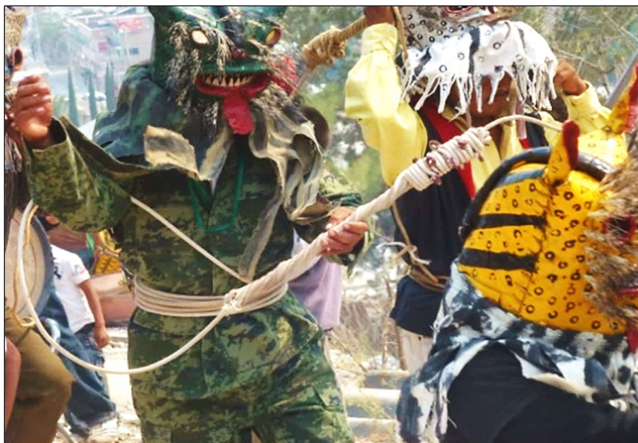
Un « tigre » et sa reata – Zitlala, 5 mai 2012

La partie la plus épaisse, constituée de plusieurs passages de corde cerclés sur eux-mêmes et mesurant une vingtaine de centimètres, est utilisée pour frapper tandis que la plus fine, torsadée et d'une soixantaine de centimètres, fait office de manche. À l'extrémité inférieure de celui-ci sont laissés environ cinq mètres de corde destinés à être enroulés autour de la taille des combattants de manière à protéger des coups le dos et l'abdomen au niveau de la ceinture [photo ci-après].