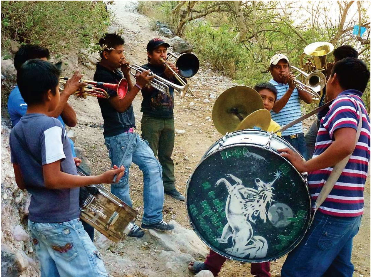
Fanfare se préparant à intégrer une procession – Zitlala, sept. 2012

Comme pour les danses, la charge de maître de musique peut être à vie. Celui qui l’assume transmet sa connaissance des musiques, organise les répétitions, corrige les erreurs, forme les novices. Tout ce qui concerne la musique se trouve de fait placé sous sa responsabilité.