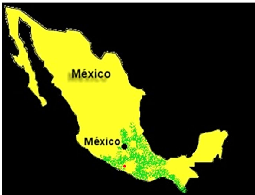
En vert, aires approximatives de la colonisation mexica (aztèque)

Les Coahuixcas seraient une des sept tribus qui quittèrent au XII e siècle Aztlán, lieu mythique des origines des Mexicas, appelés à tort Aztèques, fondateurs d'un empire au XIV e siècle avec pour capitale Tenochtitlan, l'actuelle Mexico. Dans son ouvrage, Moisés Ochoa Campos 131 rapporte que les Coahuixcas semblent avoir maintenu des liens avec les Mexicas de la vallée de Mexico, lesquels, précise-t-il, suivaient la même religion, adoraient les dieux mexicas Huitzilopochtli et Cihuacóatl, parlaient une langue proche 132 et utilisaient les mêmes calendriers.