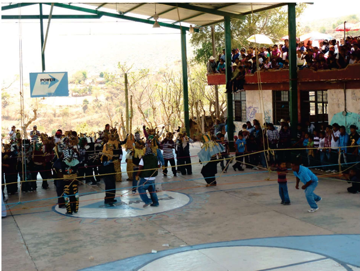
Terrain de basket-ball où se déroulent les combats – Pochahuisco, 25 avril 2012

Sur les gradins, des spectateurs, essentiellement des femmes, se sont installés tandis que de nombreux enfants ont pris place sur les balcons environnants et sur un toit qui domine un côté de la cancha (terrain de basket) [photo ci-après].