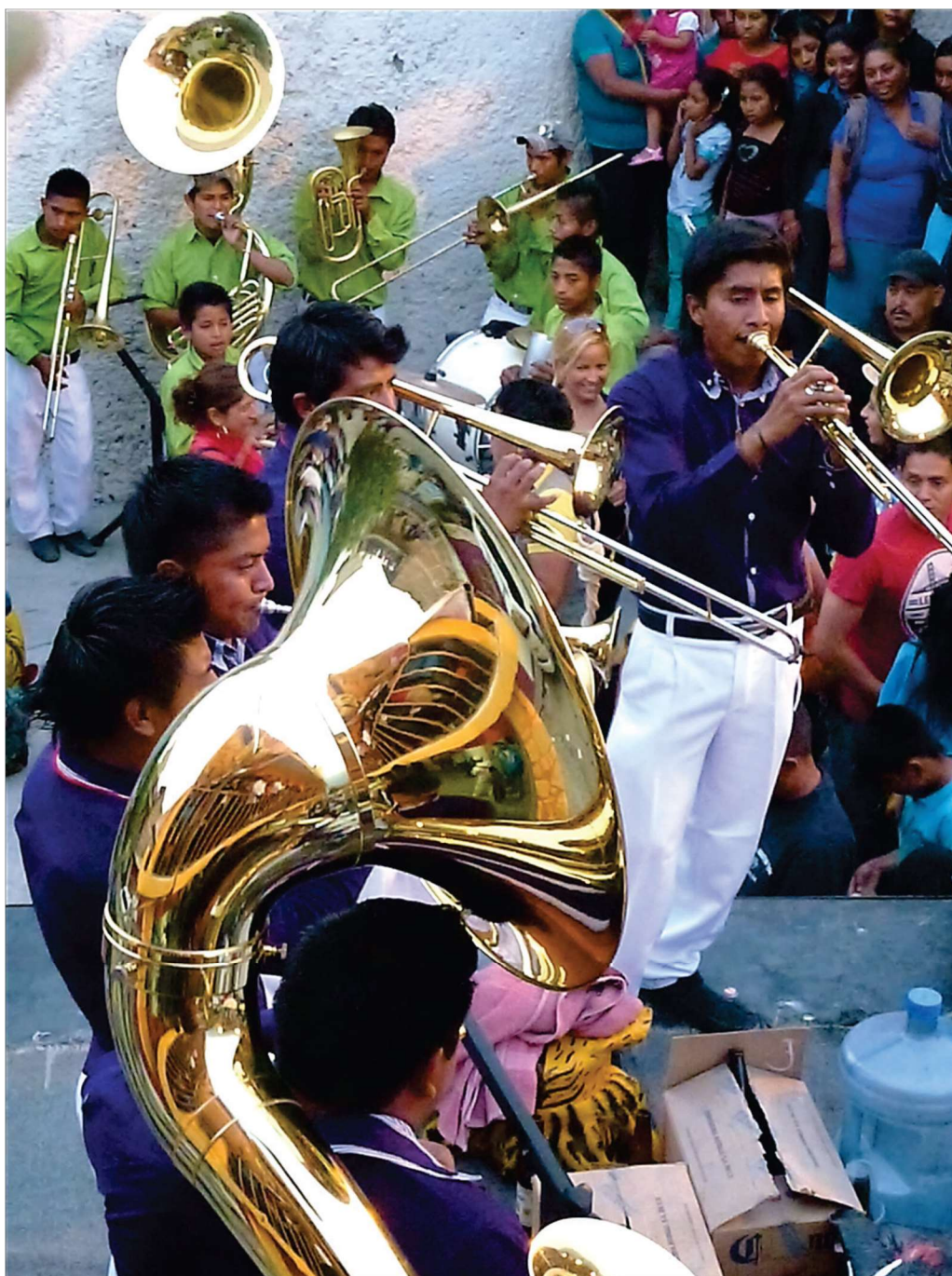
Grandes fanfares lors des combats des « tigres » – Zitlala, 5 mai 2013

Les orchestres, présents sur les nombreux terrains de l'expression rituelle, à toutes les manifestations de la vie et de la mort de Zitlala, et ce jusque dans la gravité des cimetières, sont composés exclusivement d'instruments à vent et à percussions [ photos suivantes ]. Ils font corps avec les processions malgré l'encombrement de certains instruments (grosse caisse, soubassophone), de la chaleur et de l'instabilité des sentiers ; sans interruption, ils distillent et participent de l'énergie collective et, comme les danseurs auxquels ils sont souvent associés, montrent eux aussi une endurance infailible jusqu'à s'en meurtrir les lèvres, comme j'ai pu le constater quelques fois sur les jeunes trompettistes ou joueurs d'instruments à vent.