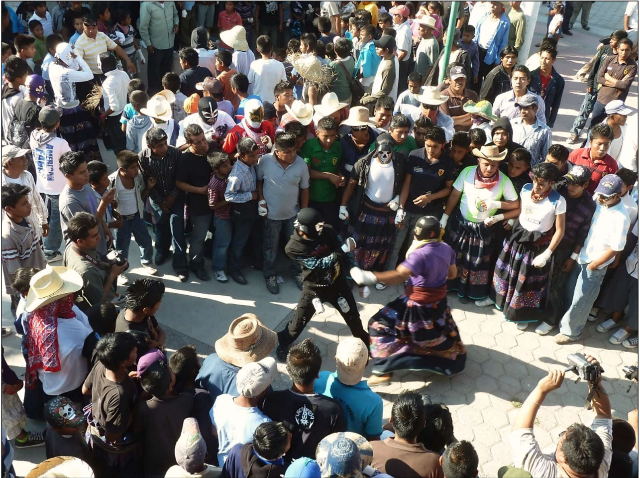
Arène éphémère, combats de xochimilcas – Zitlala, 8 mars 2011