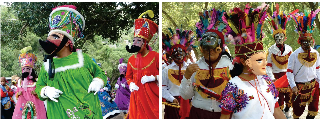
Défilé de reyes moros (rois maures) – Zitlala, sept. 2012 – Danse des Apaches ou mecos

Dans l'actualité, à Zitlala, les danses sont nombreuses et très diversifiées et si certaines tendent à disparaître d'autres sont exhumées de l'oubli grâce au travail de quelques passionnés et retrouvent un nouveau sens, telle celle des tenoxtin , « sauvée », d'après ce qui m'a été rapporté, par un instituteur de Zitlala. Les plus connues sont celle des chivas (chevreaux), des machos (mâles), des Moros chinos (Maures chinois), des muditas (petites muettes), des novias (fiancées), des reyes moros (rois maures), des Apaches ou mecos [photos ci-après], des tlacololeros (du nahuatl tlacoloa , préparer la terre avant les semailles), des tenoxtin , des vaqueros (vachers), des viejitas (petites vieilles), des xochimilcas , des zopilotes (vautours).