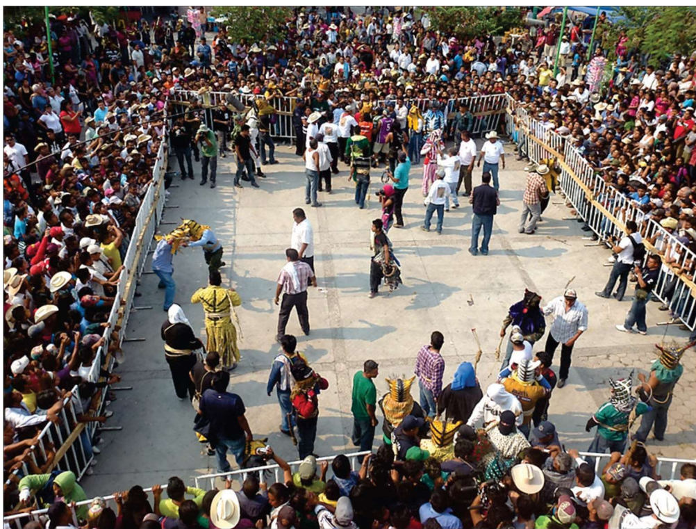
Les deux entrées opposées de l'enclos par où pénètrent les « tigres » – Zitlala, 5 mai 2013

Pour ce qui est des combats de tigres, notons qu'une évolution de ce type a précédé celle des xochimilcas mais du fait que je n'ai pu observer directement les ultimes « innovations », je me contenterai d'en décrire certains changements constatés dans la chronologie des visionnages de reportages et de mes études de terrain. Prenons par exemple le lieu des combats qui, en dépit des différentes formules adoptées selon les années pour en cerner l'espace et en dehors de la parenthèse de l'installation d'un ring en 2000, se trouvait inmanquablement détruit avant la fin des combats et permettait aux protagonistes de récupérer l'espace indispensable à la liberté des mouvements et déplacements.