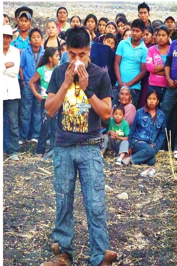
Le sang sobrement étanché, xochimilcas, mars 2011 et La Esperanza, 2 mai 2012