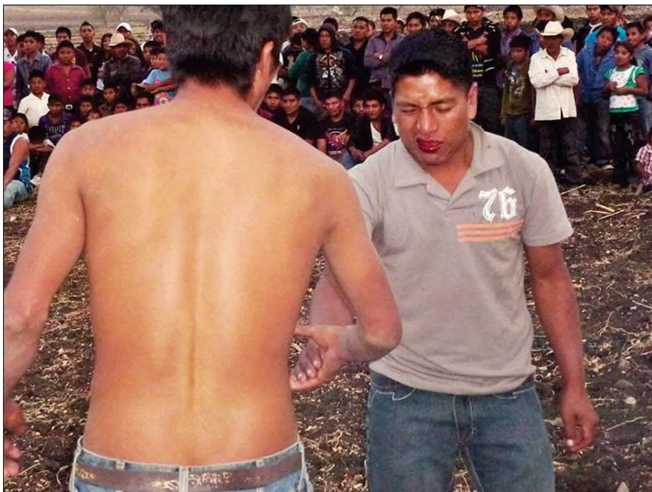
Tout est dit dans ce geste – La Esperanza, 2 mai 2012

Les reprises s'enchaînent au gré de l'énergie des combattants. La position de jambes, très écartées, leur assure plus d'appui et d'équilibre sur la terre retournée. Parfois, un des combattants en ramasse une poignée pour se frotter les mains et en retirer la sueur afin d'éviter aux coups de glisser sur le visage adverse. Cinq longues minutes plus tard, essoufflés et en sueur, le visage bosselé, titubant d'épuisement mais souriant, ils se séparent sur une poignée de main montrant des jointures rougies et enflées, révélatrices de la dureté des coups [ photo ci-après ].