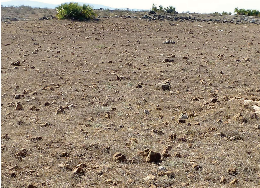
Terrain empierré où se déroulaient les combats – Teyapan, avril 2013

Il s'assit sur un amas pierreux et l'instant d'une pensée apprécia ce paysage qu'il n'avait pas revu depuis longtemps. Face aux montagnes, il se souvenait et souriait en voyant les champs de pierres qui s'étendent à perte de vue. « Les gamins choisissaient la pierre en fonction de sa taille et de sa forme, certains se préparaient des réserves qu'ils mettaient dans un petit sac, comme des munitions ; la fronde se tressait avec la palme verte qu'on peut voir là-bas [en haut à gauche sur la photo] ».