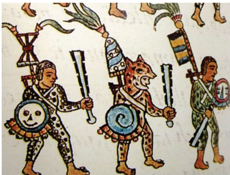
Détail du codex de Florence

L'origine de cette arme, utilisée à ma connaissance uniquement lors des combats de tigres de Zitlala, est incertaine. Certains promoteurs culturels voient dans sa physionomie des similitudes avec l'épée d'obsidienne des guerriers jaguars et guerriers aigles du codex de Florence 464 [image suivante] mais cette filiation me semble peu probable tant la différence entre les deux armes est grande. Pour ma part, la reata , qui en espagnol du Mexique signifie fouet, lasso, serait plutôt à rapprocher des activités liées à l'élevage que les Espagnols ont introduit massivement avec la colonisation dans la région.