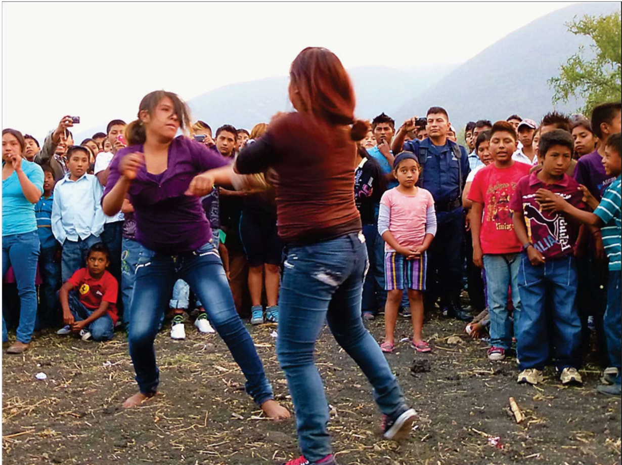
Combat entre femmes – La Esperanza, 3 mai 2013

Dans la foule de plus en plus compacte, les femmes peu à peu se rapprochent et créent leur propre espace de lutte, les quelques hommes présents se limitant au rôle de spectateurs. Les combats débutent avec des jeunes filles, les plus déterminées, très coquettes aussi, et malgré la connotation de « virilité » rattachée à ce type d'affrontement, elles s'engagent avec vigueur sans se soucier du soin qu'elles ont apporté à leur apparence [photo suivante]. Les plus âgées auront aussi leurs temps de combat, mais en premier elles font office de referes .