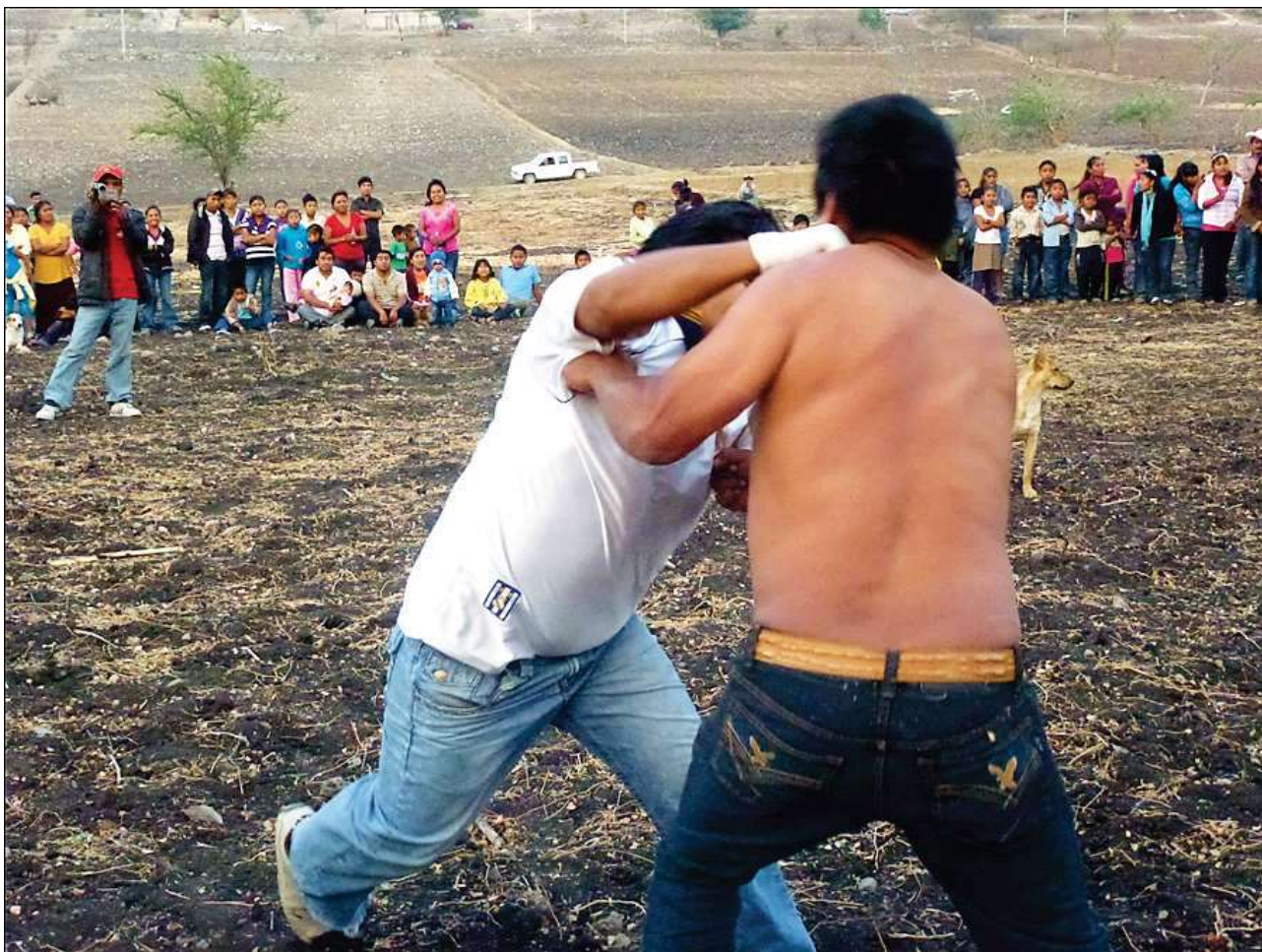
Combat à La Esperanza, 2 mai 2012

À La Esperanza, les combats se produisent en dehors de toute configuration théâtrale, de tout code scénique : pas d'esthétisation ni de musique ou costumes. Les protagonistes s'affrontent « así como van (tels qu'ils sont) » jusqu'à la tombée de la nuit, dans un champ labouré limitrophe aux deux villages et duquel, m'a-t-on précisé, « toutes les pierres ont été soigneusement ramassées pour éviter d'être tenté de recommencer les anciennes bagarres à jets de pierres qui se tenaient ici également » [photo ci-après].