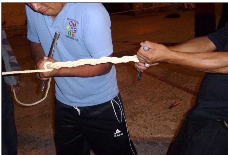
Fabrication de la reata – Zitlala, 5 mai 2012

La longue corde employée pour la fabrication de cette dernière nécessite la force de plusieurs hommes afin de la vriller sur elle-même de façon à la rigidifier, avant de la durcir en l'imbibant copieusement de mezcal [ photos ci-après ].