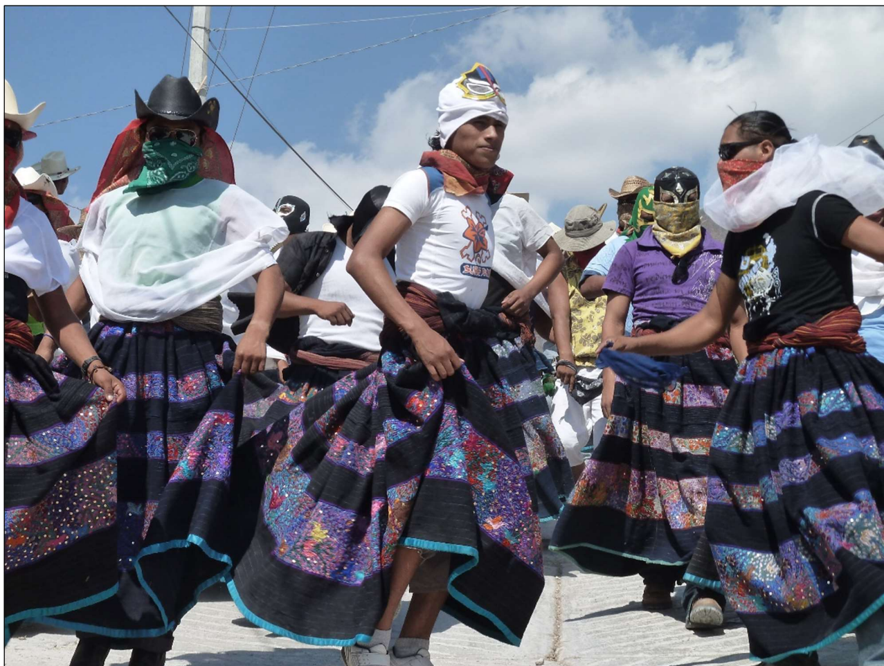
Xochimilcas vêtus de l'enagua des femmes zitlaltèques – Zitlala, 8 mars 2011

Le costume n'identifie aucun quartier en particulier, il renvoie à une distinction, à une reconnaissance spécifique zitlaltèque ; c'est l'habit traditionnel des femmes de Zitlala – depuis les temps préhispaniques prétendent certains – et il constitue un symbole identitaire zitlaltèque fort qui inscrit les xochimilcas dans une territorialité précise [photo ci-après].