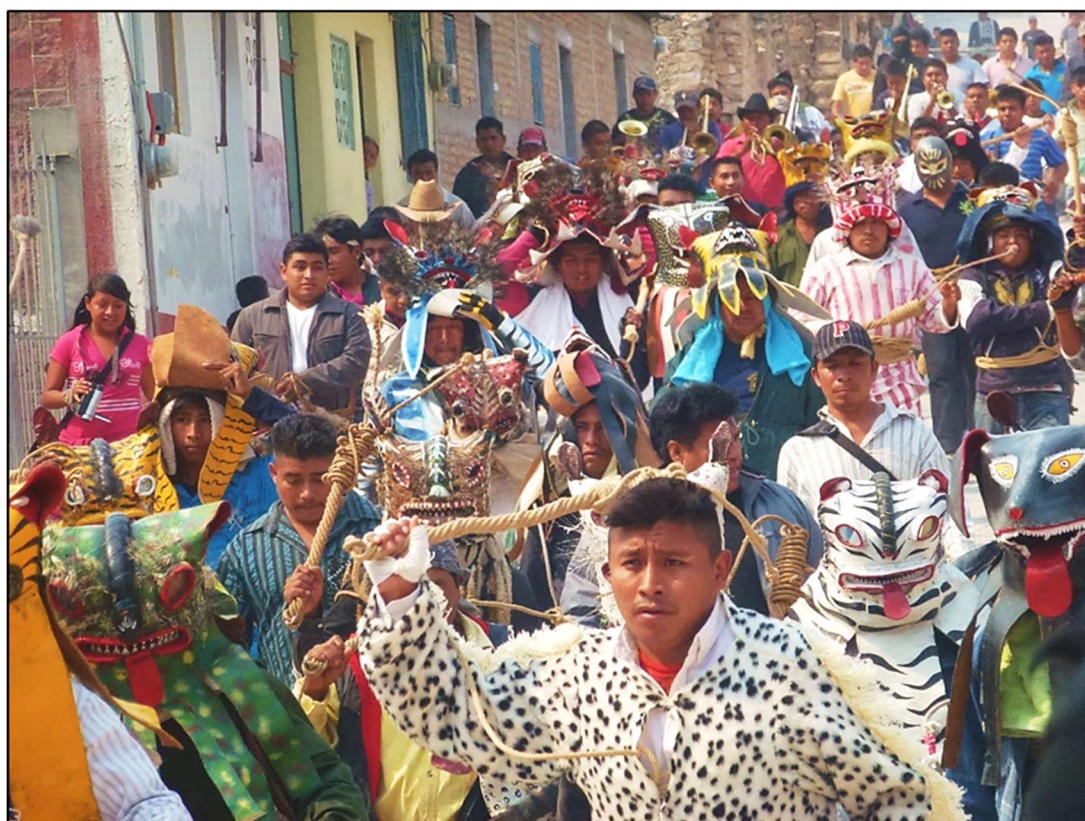
Arrivée des « tigres » des quartiers San Francisco et Tlaltempanapa – Zitlala, 5 mai 2012

Vers quinze heures, un cortège impressionnant se forme et d'un pas énergique les tigres traversent leur quartier pour se diriger vers le zócalo , toujours accompagné de la fanfare [photo suivante]. Sur leur trajet, participant à cette démonstration de force, de nombreux hommes les rejoignent, certains équipés avec masque et reata , d'autres sans.