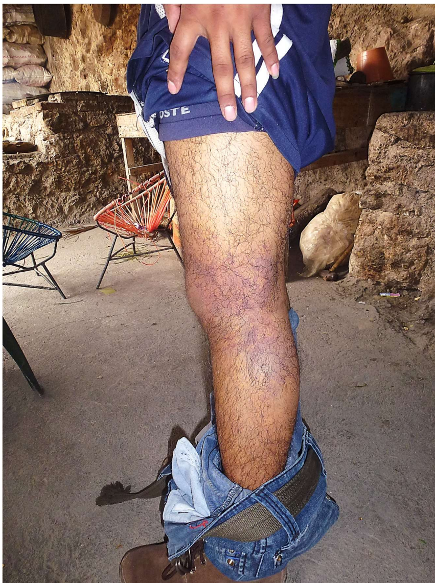
Stigmates de l'affrontement sur un « tigre » – Zitlala, 6 mai 2012

de celui ou celle qui les porte. Dans ce contexte, « ces traces viennent représenter l'individu tout en le distinguant » 720 [photo ci-après].