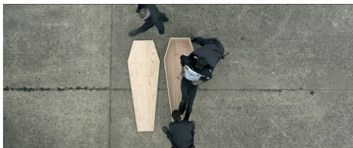
Figure 1. Captures d'écran issues d'un clip vidéo de la campagne « Un mot, des morts »

Ces images sont tirées d'un clip vidéo qui fait partie de la campagne « Un mot, des morts » initiée par l'ODSE. La forme métonymique du marteau insiste sur les conséquences délétères des décisions juridiques. Les lois tuent, froidement et de façon particulièrement sidérante : elles enterrent vivant·es. Le clip est accompagné de deux visuels, représentant les portraits d'un homme et d'une femme qui « lorsqu'ils sont pliés selon des pointillés, forment un avion... un avion les conduisant à la mort » décrit le texte qui figure sur la page internet. L'esthétique liée à la mort dans les campagnes de lutte contre le VIH/sida a été progressivement abandonnée au début des années 2000. Félix, attaché de presse à Aides au moment de la campagne, revient sur le choix esthétique qui a présidé à son maintien dans le cas du clip :