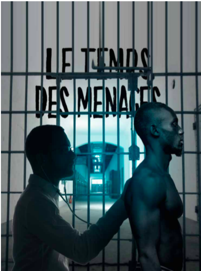
Figure 4. Aides, « Santé des étrangères : la dégradation en marche ! », Gingembre, 2019, no. 41 : 3.

côté. Un jeu de contraste tout aussi travaillé que la mise en scène découpe son deltoïde et ses triceps 350 . Il est grand, bien bâti, les traits de son visage sont harmonieux. Le fait de les représenter l'un derrière l'autre peut en outre faire référence à une position sexuelle où c'est l'homme blanc qui serait actif, et l'homme noir passif. Si la représentation d'une domination dans l'acte sexuel – ici la suggestion d'une sodomie – par celui qui est actif est bien sûr critiquable, elle imprègne les imaginaires sexuels gays.