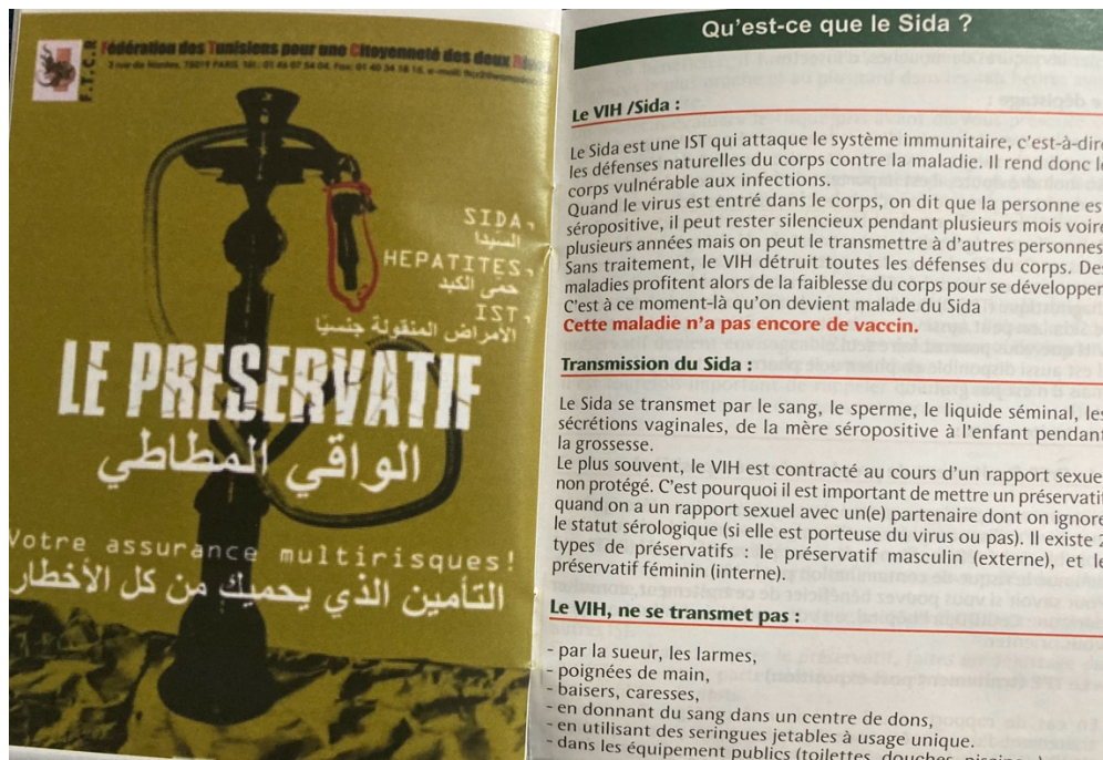
Figure 3. FTCCR, Passeport 2020, 34ème édition, p. 40-41.