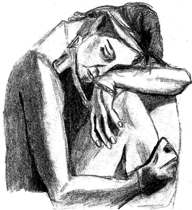
Dessin de l'autrice, Prise de tête et culpabilisation , 2024.