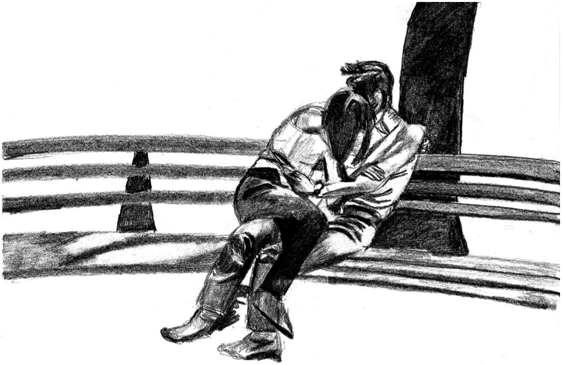
Dessin de l'autrice, C'est ma meuf qui décide , 2024.