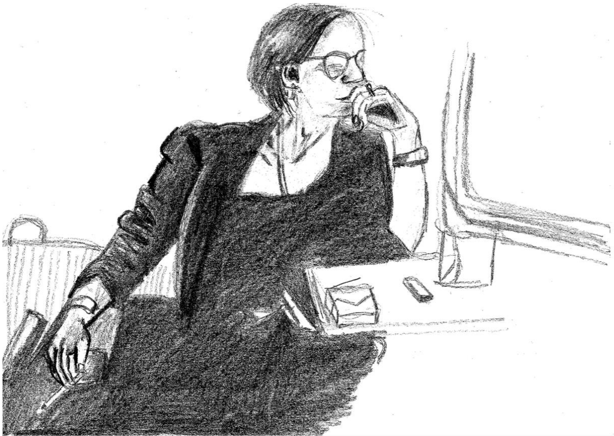
Dessin de l'autrice, En pleine réflexion... , 2024.