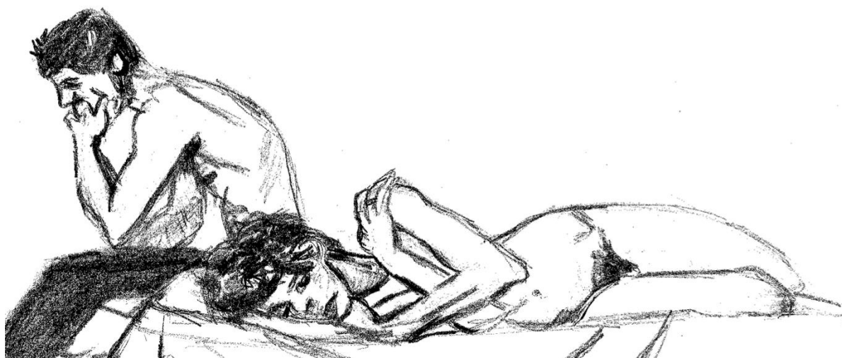
Dessin de l'autrice, After sex [1] , 2024, inspiré de Nan Goldin, Couple in bed , Chicago [photographie], 1977.