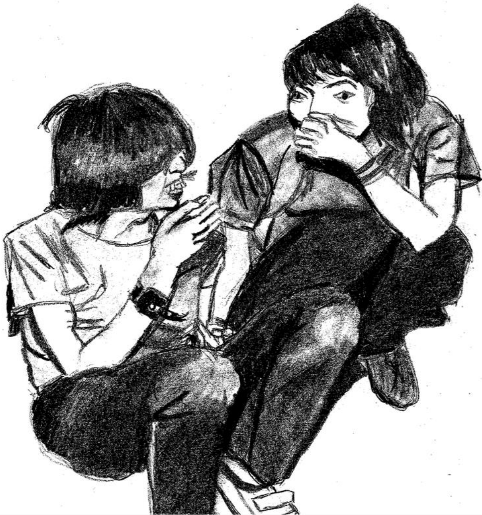
Dessin de l'autrice, Regarde ce gros forceur ! , 2024.