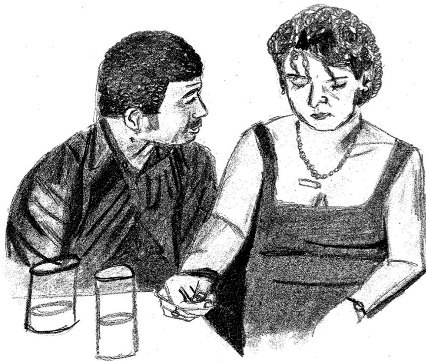
Dessin de l'autrice, Situation de séduction , inspiré de Nan Goldin, Buzz and Nan at the afterhours , New-York [photographie], 1980.