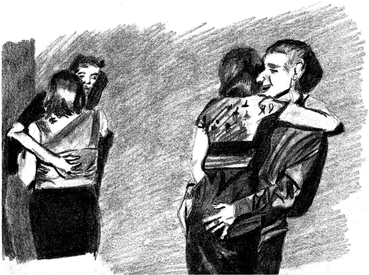
Dessin de l'autrice, Choper des femmes pour s'apprécier entre hommes , 2024.