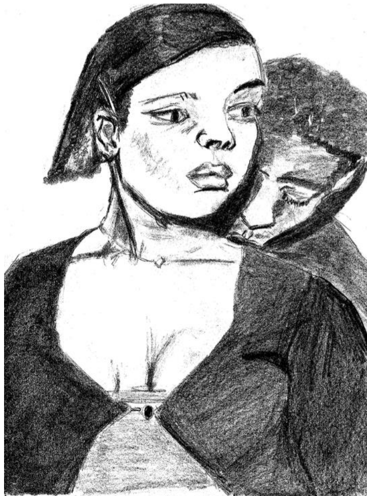
Dessin de l'autrice, Une femme pensive face aux initiatives de son copain , 2024.