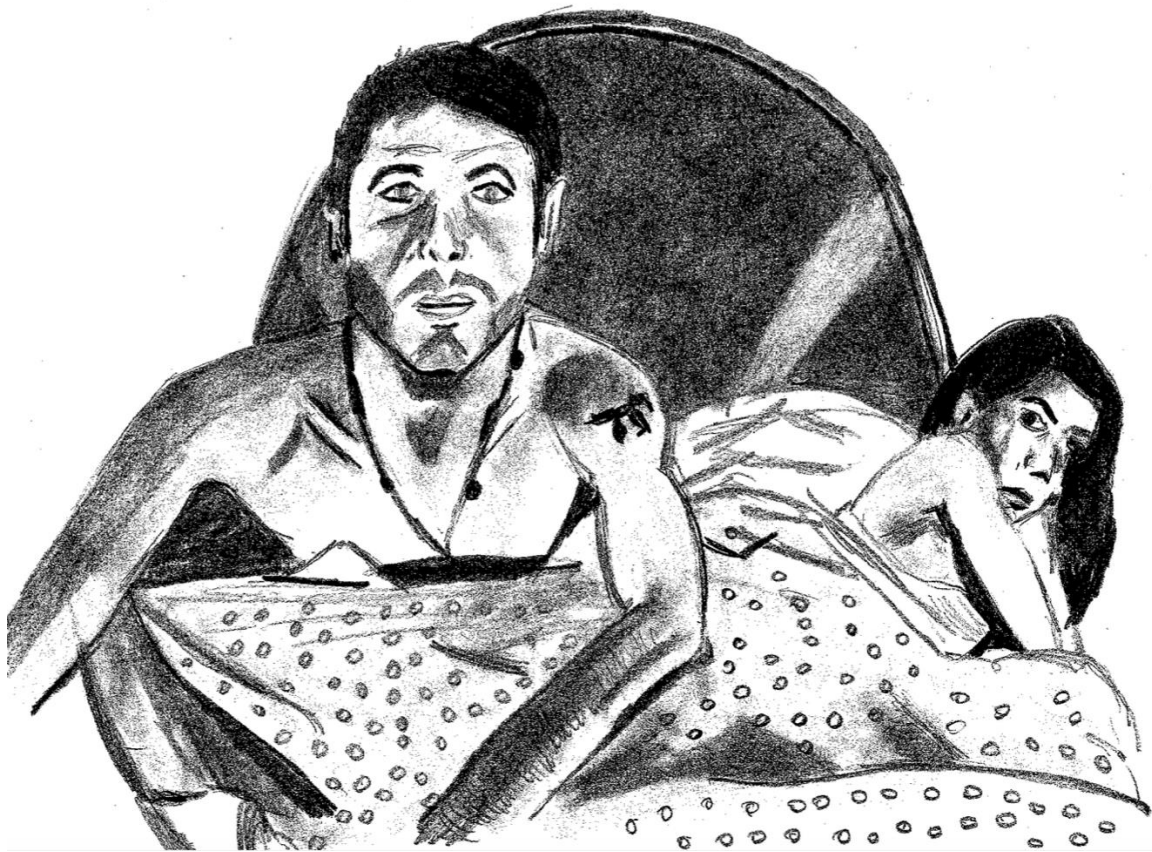
Dessin de l'autrice, After sex [2] , inspiré de Nan Goldin, Couple in bed , Chicago [photographie], 1977.