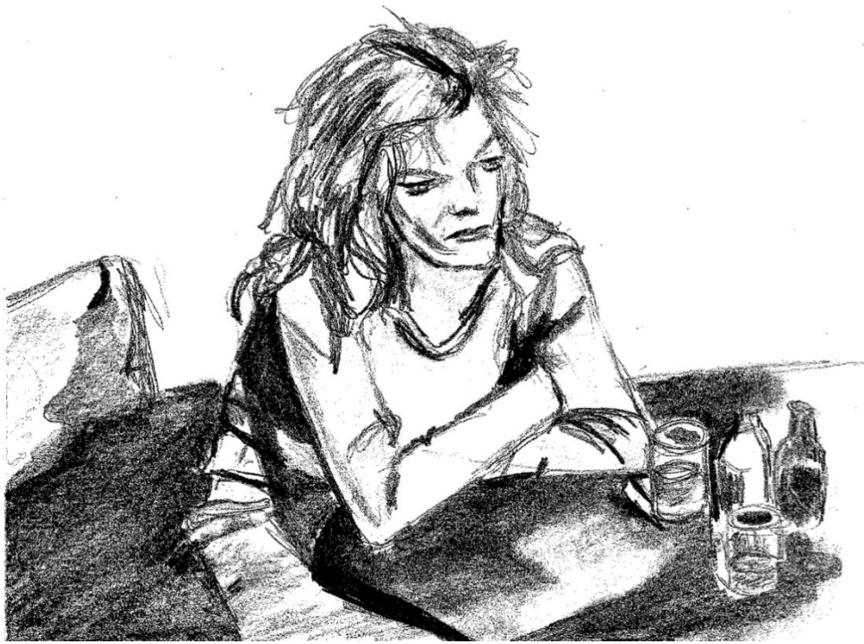
Dessin de l'autrice, Je m'en veux, je me suis pas respectée , 2024.