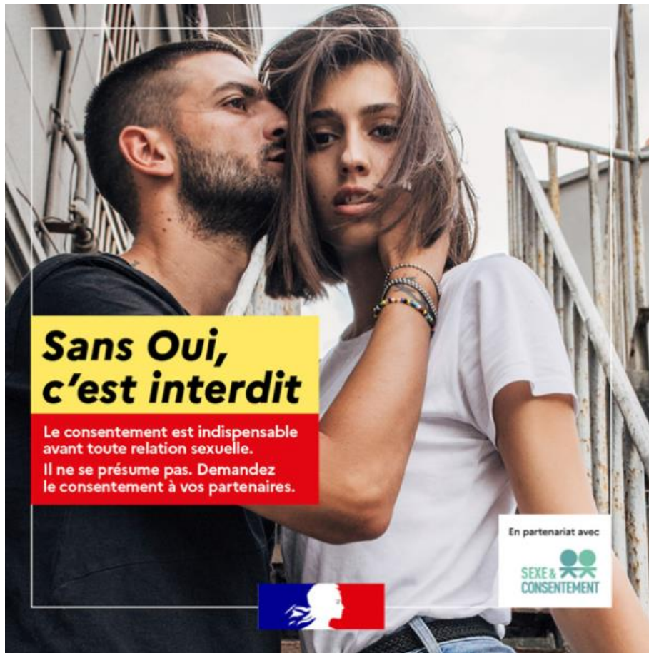
Illustration 4 – Affiche de la campagne de communication

Ces interdits sont associés dans ces discours à une série de contraintes pesant quotidiennement sur les conduites individuelles ainsi qu'à un ensemble de sanctions en cas de transgression. En témoignent par exemple les formations « Témoin actif » proposées par l'association Sexe et consentement 77 aux établissements d'enseignement supérieur qui visent à apprendre aux jeunes comment intervenir lorsqu'ils et elles repèrent, lors de soirées étudiantes, des comportements problématiques qui ne respectent pas le consentement et qui laissent présager la survenue de violences sexuelles :