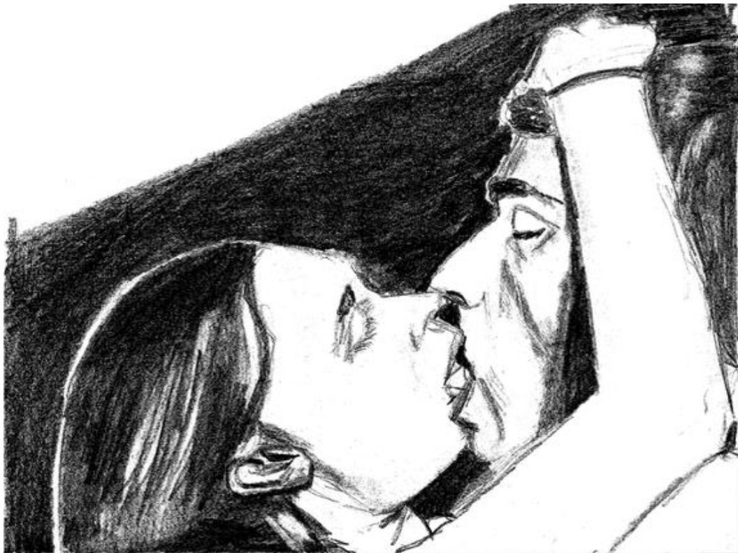
Dessin de l'autrice, Un bisou égalitaire ? [2] , 2024.