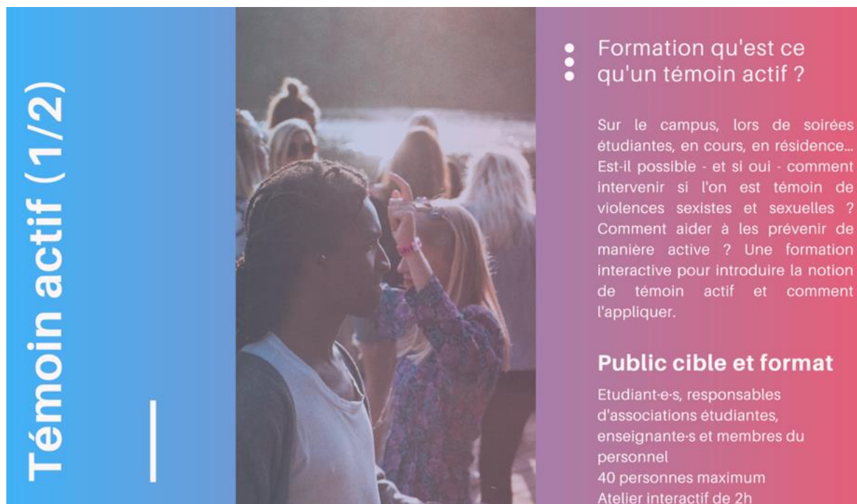
Illustration 5 – Captures d'écran issues du site de l'association « Sexe et consentement »