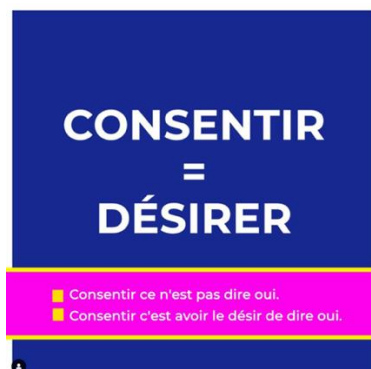
Illustration 6 – Capture d’écran d’un extrait de story du compte Instagram @gangduclito

Au-delà de l’importance accordée au désir sexuel, les discours insistent aussi sur la nécessité de tenir compte de l’ensemble des émotions négatives suscitées par les expériences sexuelles vécues comme étant en partie ou complètement contraintes afin d’agir de façon à produire des émotions plus positives et à améliorer son bien-être. Le contenu produit par Anya Tsai, une coach résilience et mentor, praticienne en thérapies brèves (PNL, Hypnose, EMDR-IMO, TOS, DNR) 90 offre une illustration de l’attention accrue portée à ces émotions. Anya Tsai dispose d’un site Internet sur lequel elle partage de nombreux conseils et ressources et propose des services payants pour accompagner au développement de la « sécurité intérieure » et à la « résilience », essentiellement suite à des expériences de violences sexuelles. Dans la vidéo intitulée « 5 conseils pour se reconstruire et vivre après un viol », elle insiste notamment sur l’importance de « se recentrer sur soi (et revenir au cœur de sa vie) » :