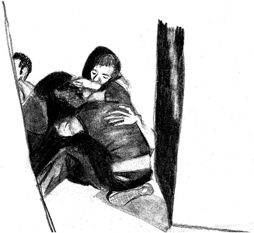
Dessin de l'autrice, Je décide quand je chope , 2024.