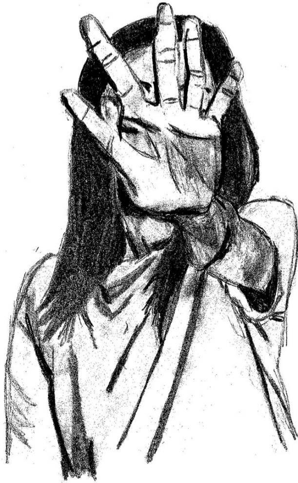
Dessin de l'autrice, Je sais dire non , 2024.