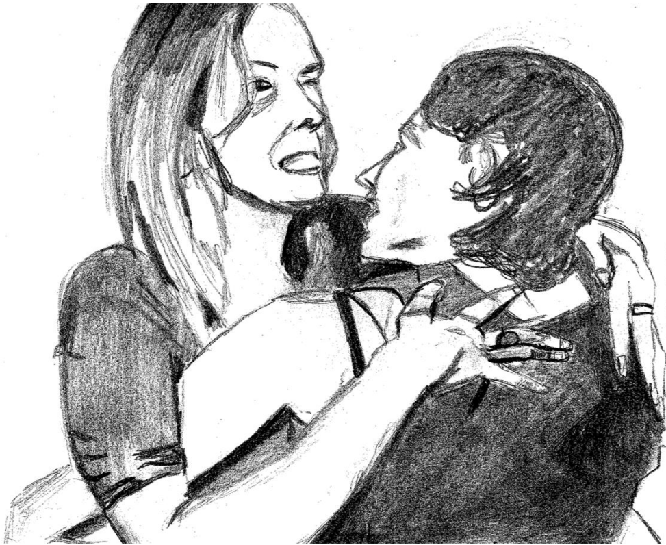
Dessin de l'autrice, Je te crois , 2024.