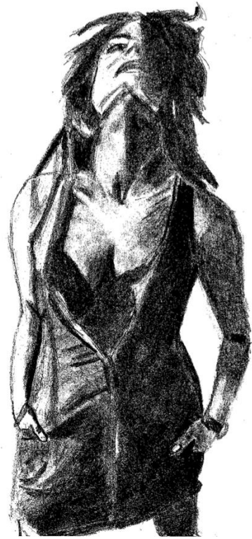
Dessin de l'autrice, Engouffrée dans une spirale d'autodévalorisation , 2024.