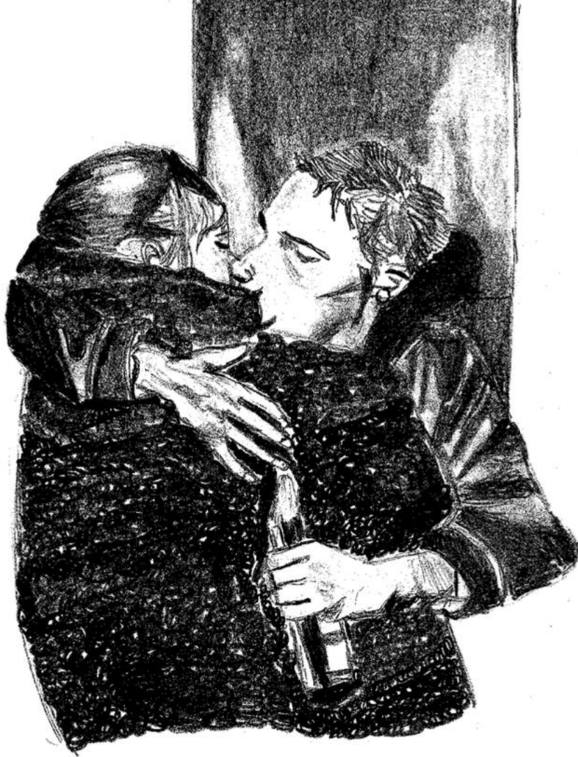
Dessin de l'autrice, Un bisou égalitaire ? , 2024.