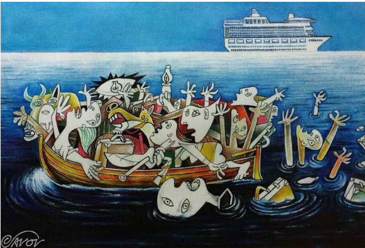
Figure n. 2 – Jovcho Savov, Guernica 2015