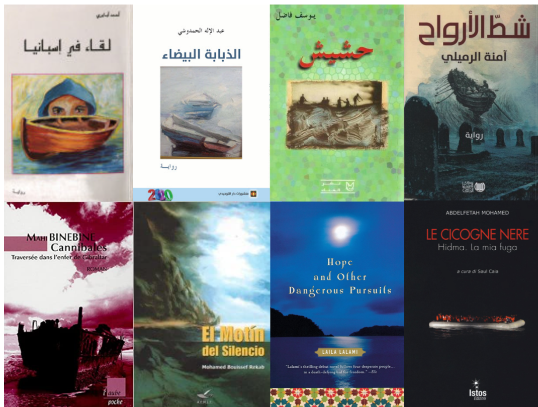
Figure n. 4 – Quelques exemples de couvertures de romans de harraga (2000-2020)