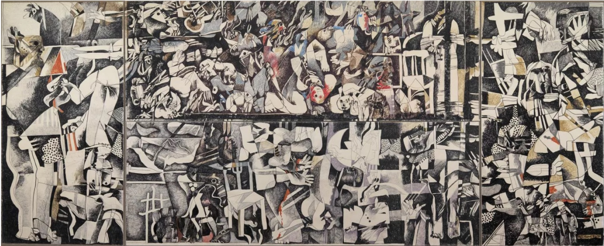
Figure n. 1 – Dia al-Azzawi, Sabra and Shatila Massacre 1982-1983