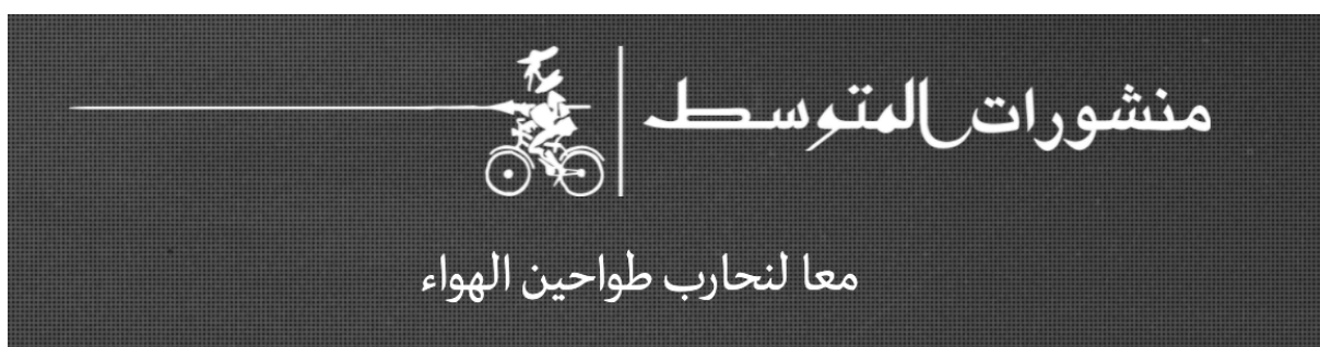
Figure n. 6 – Logo et devise de Dār al-Mutawassiṭ. Capture d'écran faite le 29 octobre 2021 sur le site internet de la maison d'édition : https://almutawassit.it/ .

R : La devise est évidemment liée au logo et fait référence à mon histoire personnelle. Quand j'ai eu des problèmes avec Dār Nūn , avec qui je travaillais, et j'ai toujours eu des problèmes pour me déplacer dans le monde arabe parce que j'étais apatride et que je n'avais pas encore la nationalité italienne... j'avais l'habitude de faire du vélo un peu déprimé, sans un sou, le long du petit Naviglio à côté de chez moi et un jour j'ai décidé de fonder ma propre maison d'édition. J'ai imaginé le tout comme une aventure digne de Don Quichotte ; d'où l'idée de Don Quichotte sur un vélo avec sa lance. Puis est venue la devise, bien que je ne sache pas exactement d'où ni comment... Que dire, dans le monde arabe nous avons toujours la guerre ( ḥarb ) en tête ! Qu'il s'agisse de guerres réelles ( ḥurūb ḥaqīqiyya ) ou bien imaginaires ( ḥurūb wahmiyya ). La culture et la littérature nécessitent de la guerre ( biddha al-ḥarb ), mais dans le bon sens du terme ( bi l-ma'na al-ḥabbāba ).