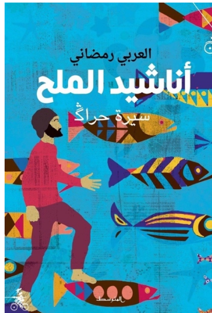
Figure n. 3 – Première de couverture d' Anāšīd al-milḥ