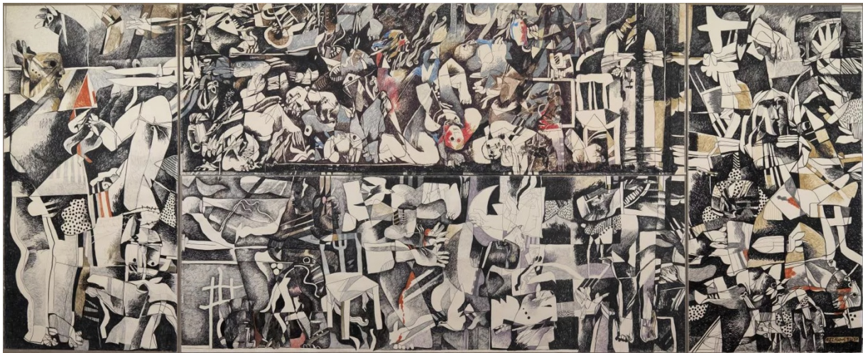
Figure n. 1 – Dia al-Azzawi, Sabra and Shatila Massacre 1982-1983