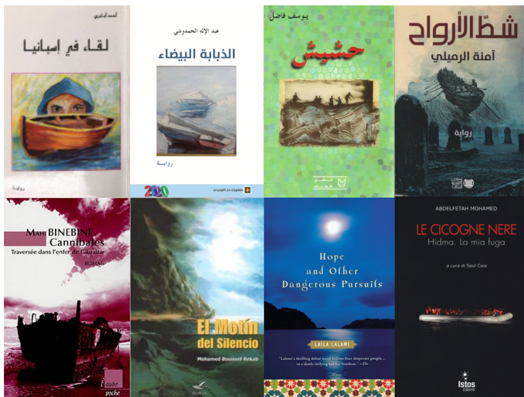
Figure n. 4 – Quelques exemples de couvertures de romans de harraga (2000-2020)