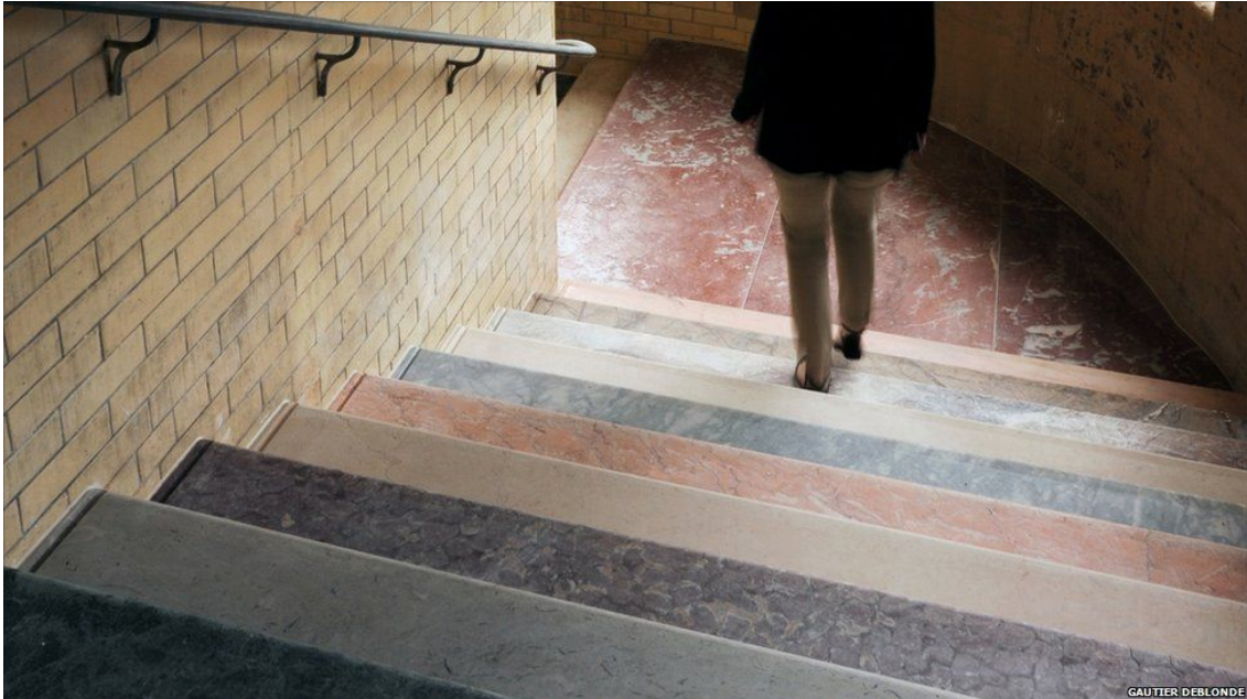
Fig. 11 Martin Creed, Work n° 1059 (2011). Scotsman's Steps, Edimbourg.

de l'intérieur. Le public, d'abord encouragé à accéder à l'art, a progressivement été incité à une participation plus active. Il est entré en nombre dans des musées de plus en plus divertissants. Mais dans le même temps, l'art lui-même en est sorti pour esthétiser le monde.