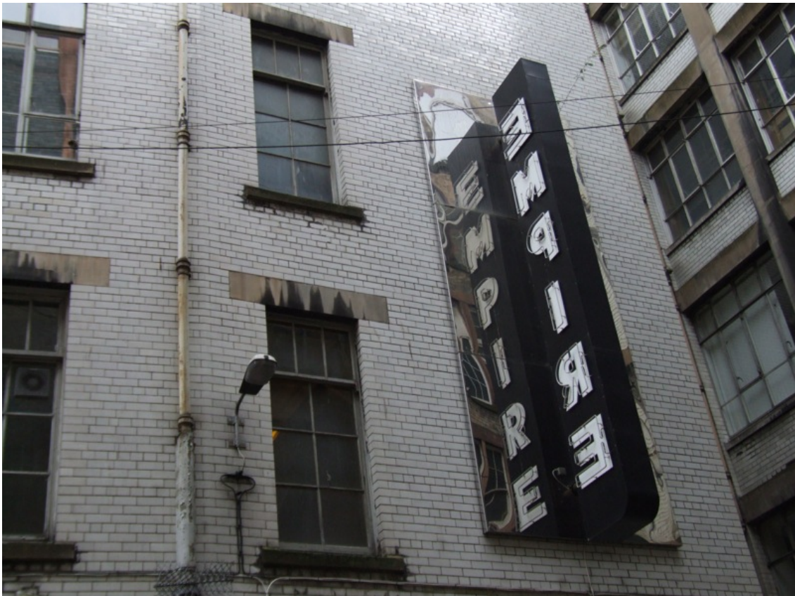
Fig. 3 Douglas Gordon, Empire (1998), Brunswick Lane, Glasgow (déplacé depuis dans Tontine Lane, trois rues plus loin).