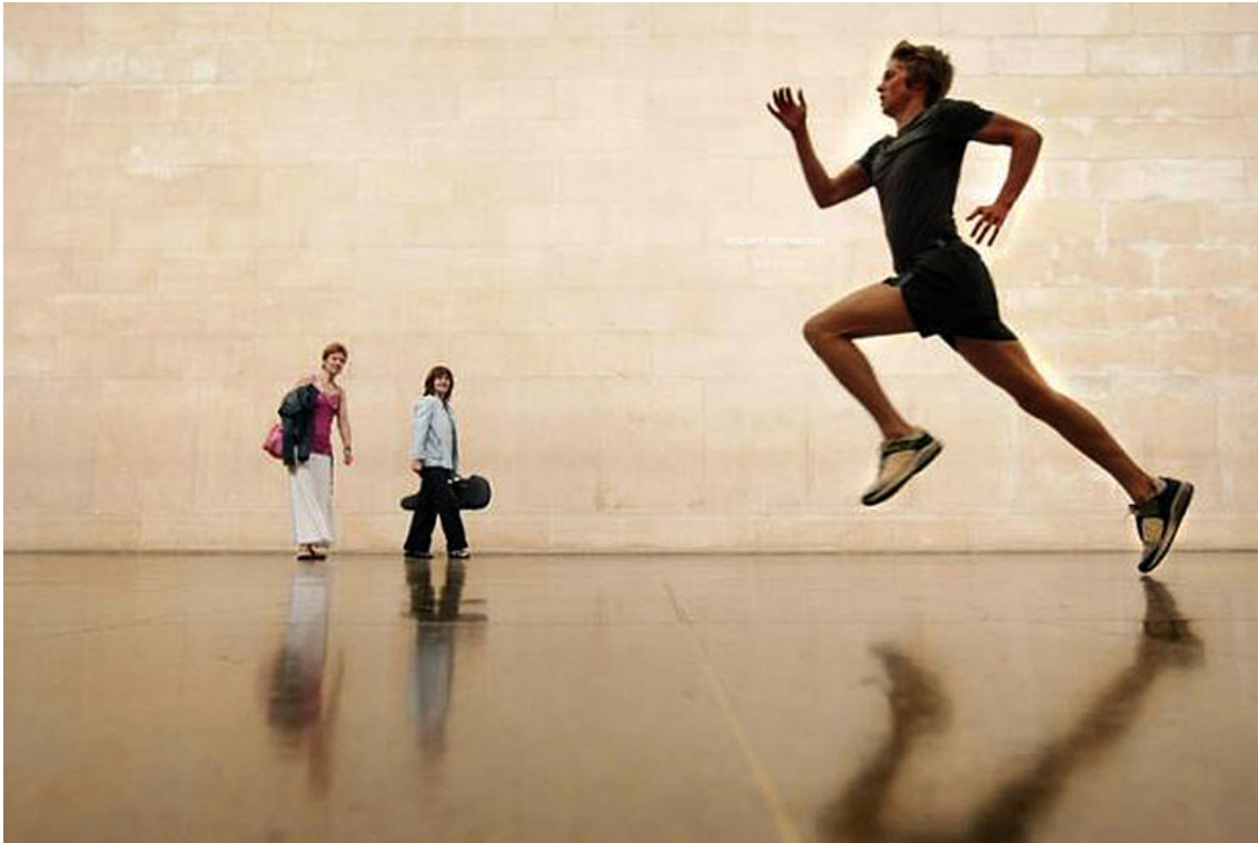
Fig. 4 Martin Creed, Work n° 850 , 2008, Tate Britain. Tous droits réservés Rob Forrest et lightsgoingon.

Lorsqu'elle publie Installation Art en 2005, Claire Bishop déclare que les installations sont omniprésentes et invitent les spectateurs à pénétrer des œuvres, immersives ou théâtrales, qui se déploient en scènes ou en environnements. En 2012, dans « Delegated Performance », elle évoque des « live installations » (Bishop 2013, 25) et identifie cette fois moins ces pratiques contemporaines en fonction des objets qu'elles déploient que des mouvements qui les animent. L'art est devenu vivant, qu'il comprenne les actions des artistes ou de leurs interprètes, ou encore la participation du public. Elle remarque que l'adjectif « performatif » est devenu un concept fourre-tout pour décrire des œuvres incluant une performance humaine (voire animale, comme dans A Real Work of Art [1993] de Mark Wallinger, Play Dead/Real Time [2003] de Douglas Gordon ou Night Shift [2004] de Adam Chodzko). 60 Ce passage du nom à l'adjectif contribue également à