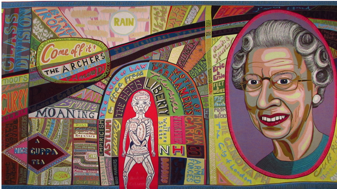
Fig. 1 Grayson Perry, Comfort Blanket , tapisserie, 2,9 x 8 m, édition de 9 produite par Paragon, 2014.

l'accès pour que le droit à la culture se transforme en une défense des droits culturels 6 : progressivement, la culture est passée d'une position d'autorité à celle d'un partage, d'un échange et d'une participation étendue qui essaime dans tout l'imaginaire collectif, comme en témoigne l'apparition de la Fourth Plinth Commission dans The Archers .