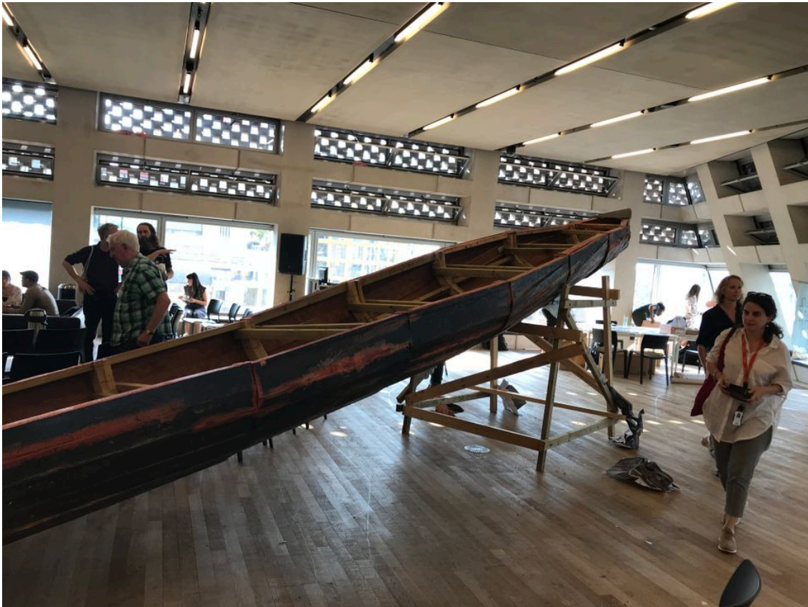
Fig. 7 Copie de l'œuvre de Subodh Gupta, What does the vessel contain, that the river does not (2012), réalisée par les étudiants et étudiantes de Winchester School of Art à l'occasion de l'atelier « How to Build a Biennale » organisé par Tate Exchange en mai 2018

La critique institutionnelle telle qu'elle fut définie à la fin des années soixante par des critiques proches de la revue October comme Benjamin Buchloh et Craig Owens, et pratiquée aux États-Unis par des artistes comme Andrea Fraser ou Fred Wilson, dévoilait avec ironie les structures et le caractère idéologique des musées et des galeries. Mais son caractère oppositionnel fut lui-même assimilé par des commissaires d'exposition et souvent institutionnalisé dans les années quatre-vingt-dix, signifiant par là-même qu'il est difficile d'échapper aux usages hétéronomes de l'art, c'est-à-dire à ses usages marchands et idéologiques, mais aussi que le découpage des espaces en lieux oppositionnels, institutionnel / avant-garde, public / privé, marchand / politique, n'a plus cours. Dans son article « The Cultural Logic of the Late Capitalist Museum », Rosalind Krauss constatait en 1990 que face au développement à un degré inédit de l'industrie culturelle (Adorno et Horkheimer), les questionnements réflexifs de l'art se sont déplacés sur le terrain spatial, les lieux de l'art pouvant être classés en fonction de leur caractère plus ou moins public. Le musée lui-même devenait, d'après Krauss, un