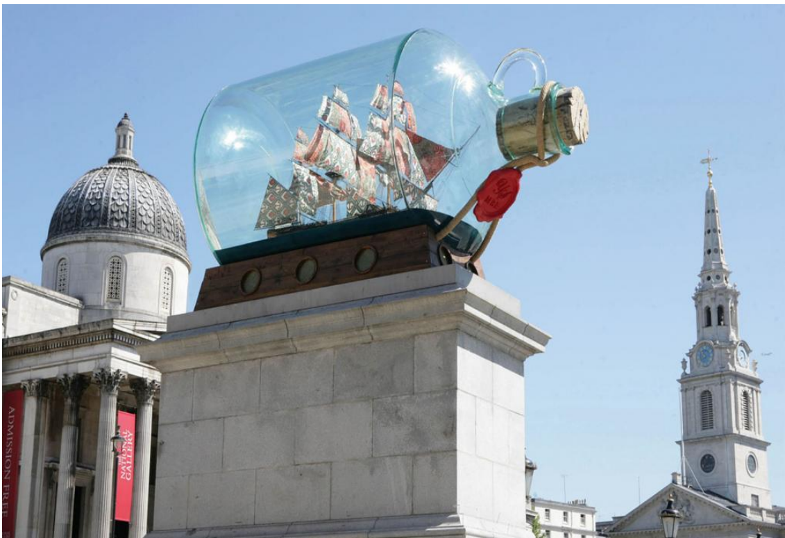
Fig. 10 Yinka Shonibare MBE, Nelson's Ship in a Bottle , 2010. Trafalgar Square, Londres.

Commande du Maire de Londres, une nouvelle œuvre contemporaine vient occuper environ tous les dix huit mois le socle vide de Trafalgar Square. Son installation sur un piédestal fixe au profil classique tendrait à en faire une sculpture publique traditionnelle. Ceci est toutefois contredit par son caractère temporaire, mais aussi, et surtout, par la nature même de cette place centrale de Londres qu'elle vient surplomber. Trafalgar Square, dédiée à un passé principalement colonial et traversée au fil des décennies par les contestations et les revendications de la nation, s'impose en effet comme un contexte à commenter. Voilà pourquoi les Fourth Plinth Commissions sont des œuvres in situ .