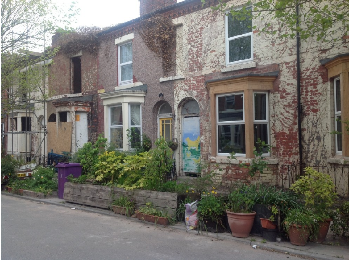
Fig. 9 Assemble, Granby Four Streets Project, 2015.

contigus qui intéressent les artistes car leurs pratiques ont pris certains tournants : un tournant social qui leur fait rejoindre la pratique des travailleurs sociaux, un tournant spatial qui leur fait rejoindre la pratique des architectes, ou encore un tournant ethnographique qui fait du réel leur matière première. Or le prix est aussi allé chercher ces thématiques dans d'autres disciplines, et pratiquées par d'autres professionnels, architectes, topographes ou experts judiciaires, pour ensuite les valider comme art.