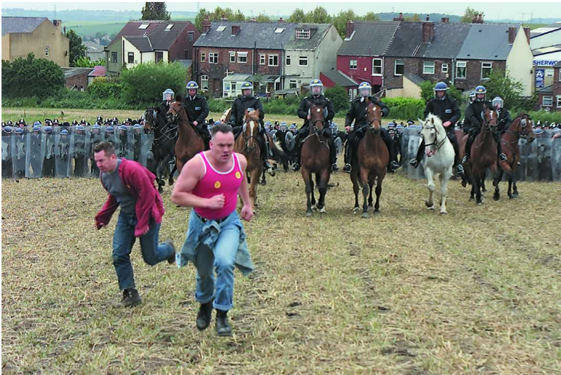
Fig. 2 Jeremy Deller, The Battle of Orgreave , 2002, copyright de l'artiste.

Le 17 juin 2001, un groupe de professionnels et d'amateurs d'art triés sur le volet fut convié à Orgreave pour assister à une performance orchestrée par Jeremy Deller et qui prit la forme d'une reconstitution historique du célèbre affrontement de 1984 entre mineurs et policiers. 31