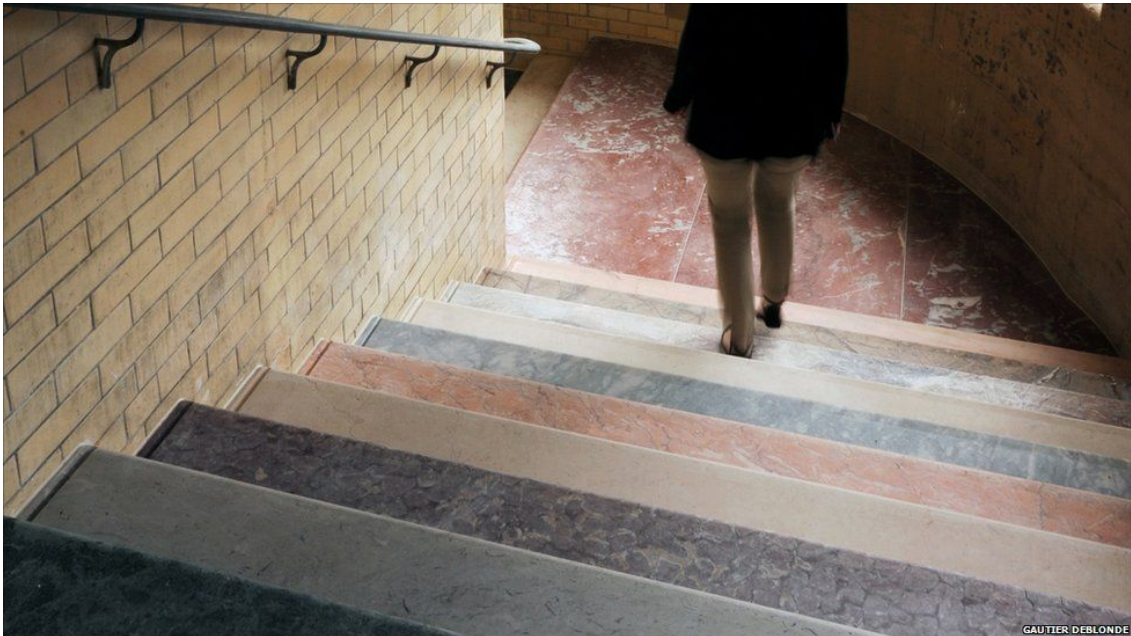
Fig. 11 Martin Creed, Work n° 1059 (2011). Scotsman's Steps, Edimbourg.

de l'intérieur. Le public, d'abord encouragé à accéder à l'art, a progressivement été incité à une participation plus active. Il est entré en nombre dans des musées de plus en plus divertissants. Mais dans le même temps, l'art lui-même en est sorti pour esthétiser le monde.