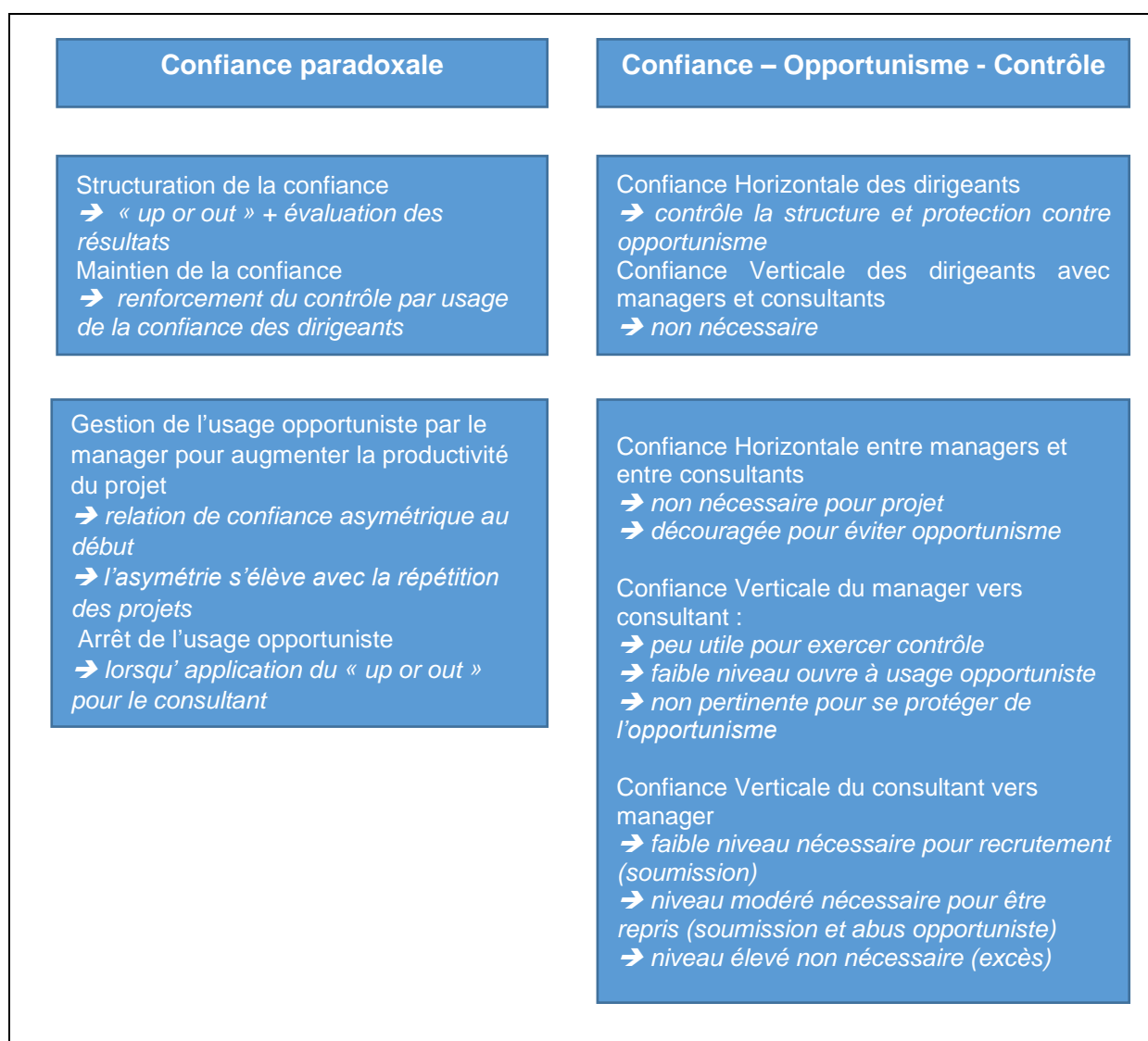
Figure 1. Approche relationnelle et systémique de la confiance paradoxale

La colonne de gauche présentée dans la figure ci-dessous (cf. Figure 1) schématise le raisonnement issu de l'interprétation des données quant à la formation et aux usages de la confiance paradoxale. La colonne de droite de cette même figure offre un approfondissement de l'analyse en proposant une approche relationnelle de la confiance (Lewicki et al. 2006) – c'est-à-dire une approche où la confiance conditionne l'opportunisme et le contrôle – et aussi dans une perspective systémique. Une telle perspective tient compte des liens entre les relations de confiance entre collègues (ou relations de confiance dites horizontales) et entre supérieur/subordonné (ou relations de confiance dites verticales). Une perspective systémique aide à identifier les effets de la confiance paradoxale dans toute la structure organisationnelle.