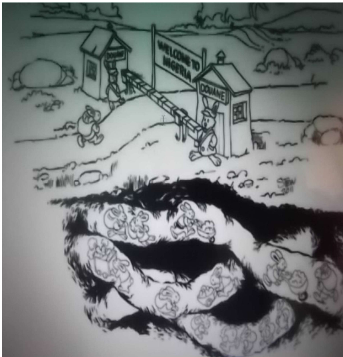
Figure n°1 : Transgression de la frontière par les peuples-frontières