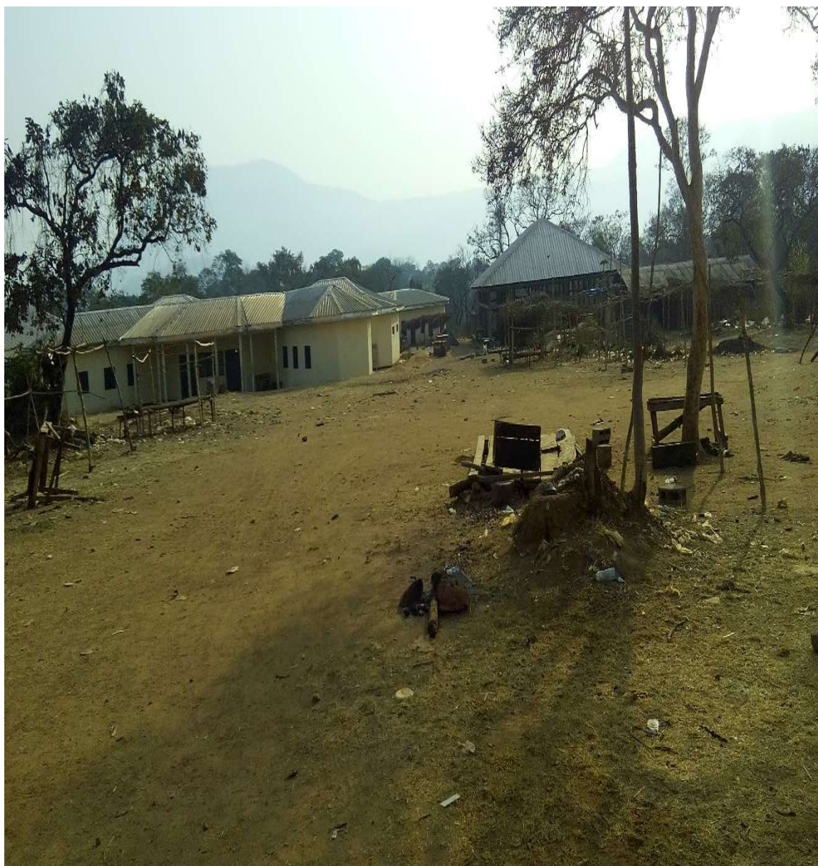
Cliché Yanic KENHOUNG, le 21 février 2016.