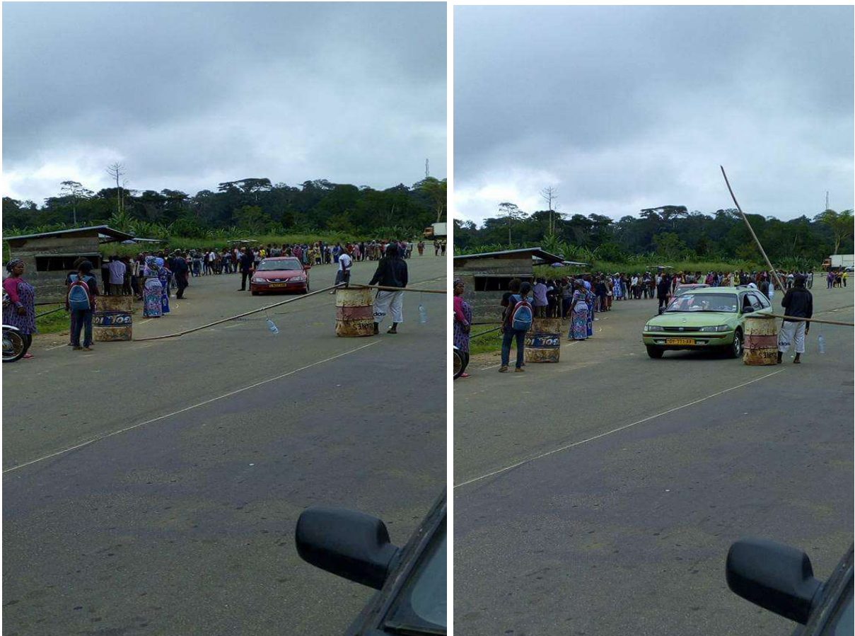
le 27 mars 2016.