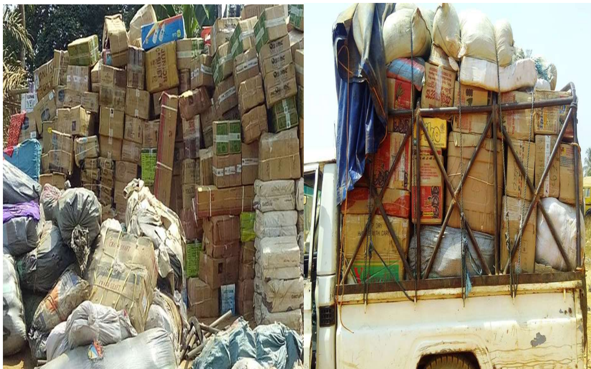
Cliché Yanic KENHOUNG, 20-21 février 2016.