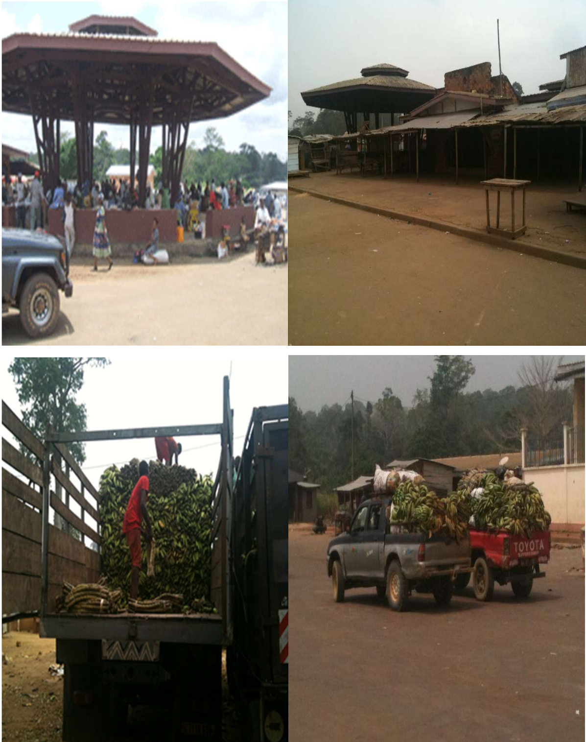
Cliché Yanic KENHOUNG, le 27 mars 2016.