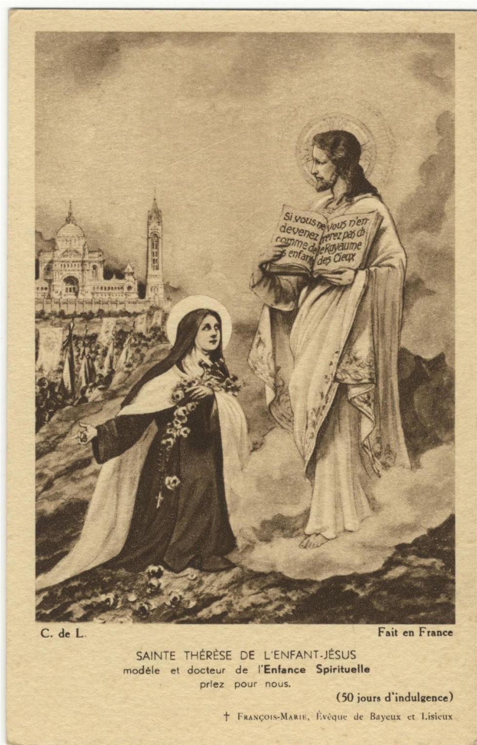
4) Fascicule-souvenir du congrès de Lisieux (1932)

de Desbuquois a été le clou de la semaine, à la fois le plus intéressant et le plus remarqué, tant pour sa qualité de réflexion théologique que pour la proposition du doctorat. Par cette dernière revue, c'est tout le milieu des dévots de sainte Thérèse de Lisieux qui est touché, bien au-delà du milieu français.