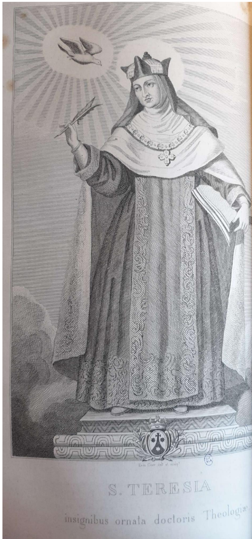
1) Thérèse d'Avila ornée des attributs des docteurs, illustration tirée de l'étude des Bollandistes (1845).