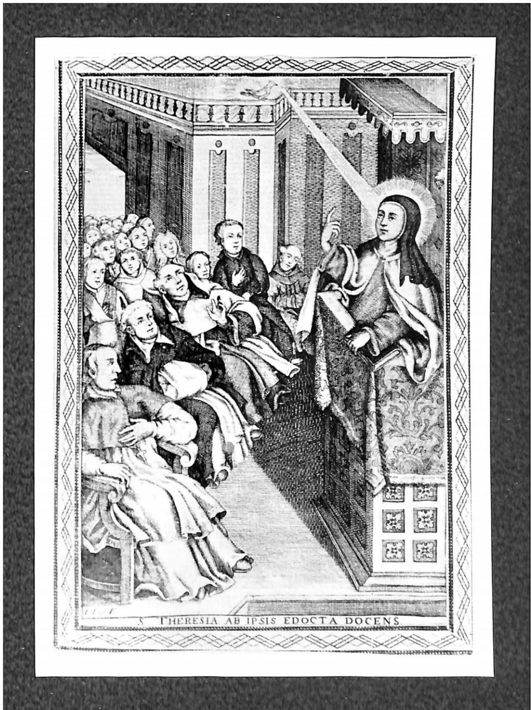
3) « Sainte Thérèse enseigne ses maîtres » : gravure espagnole du XVIII e siècle (Alicante, coll. Albert)