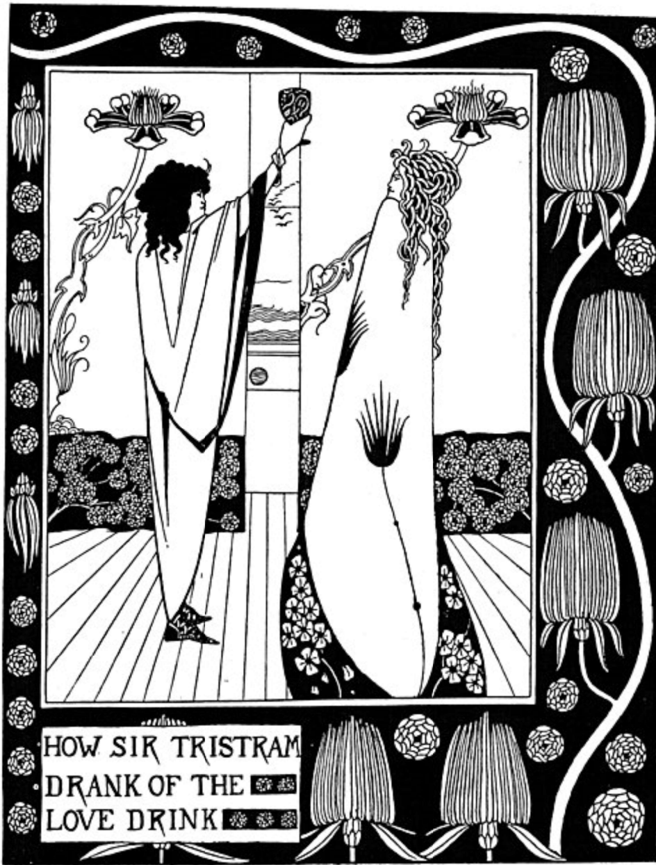
How Sir Tristram Drank of the Love Drink.

Aubrey Beardsley, « How Sir Tristram Drank of the Love Drink »