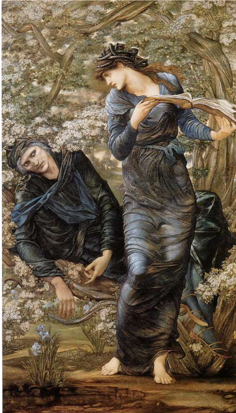
Edward Burne-Jones, The Beguiling of Merlin