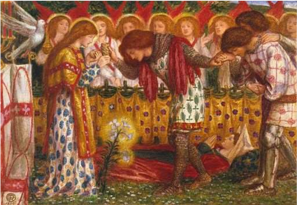
Dante Gabriel Rossetti, How Sir Galahad, Sir Bors and Sir Percival Were Fed with the Sanct Grael; but Sir Percival's Sister Died by the Way