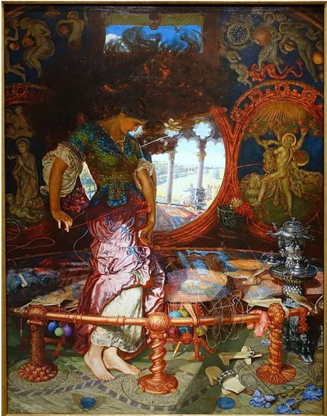
William Holman Hunt, Lady of Shalott

© Wadsworth Atheneum Museum of Art, Hartford, CT. The Ella Gallup Sumner and Mary Catlin Sumner Collection Fund.