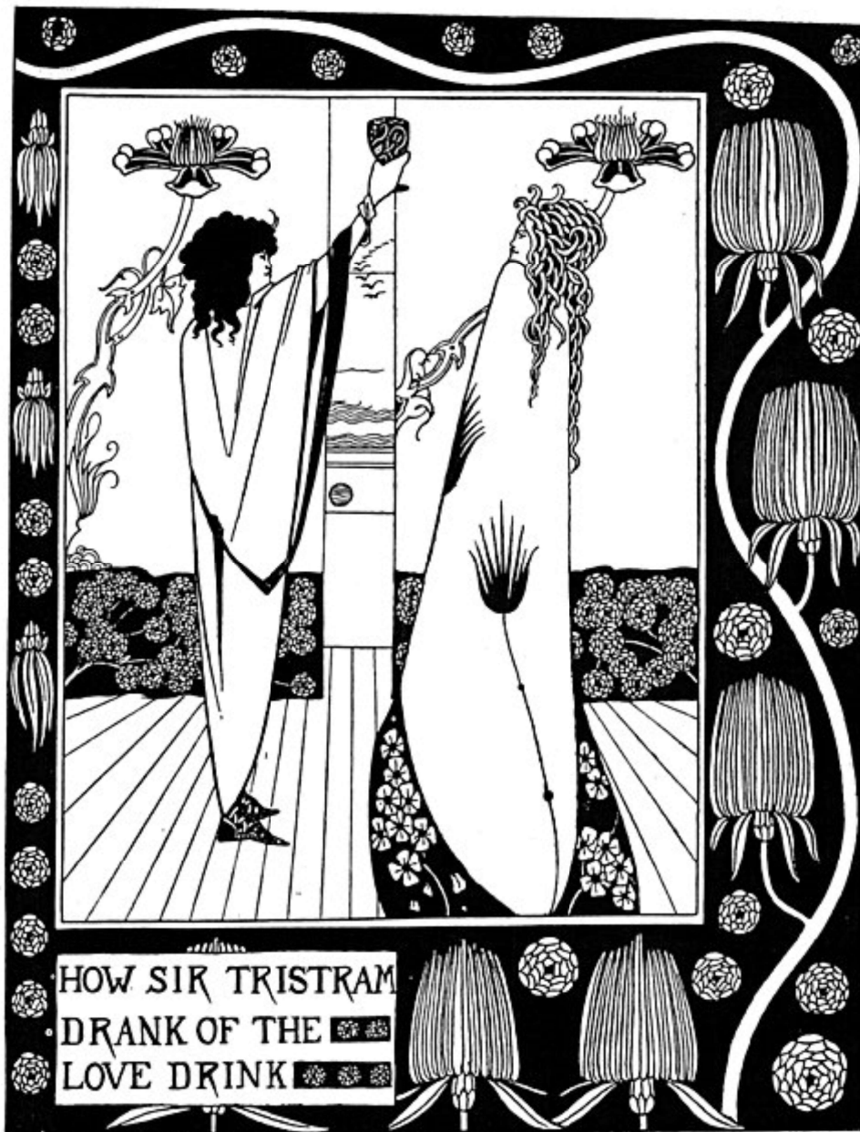
How Sir Tristram Drank of the Love Drink.

Aubrey Beardsley, « How Sir Tristram Drank of the Love Drink »