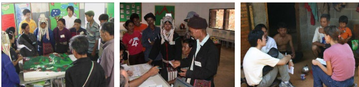
Figure 5. Session de jeux de rôles et entretien semi-dirigé dans la communauté Akha de Mae Salep, 2005, Province de Chiang Raï, Nord Thaïlande

Deux expériences de modélisation d'accompagnement furent mises en œuvre en adoptant cette posture d'accompagnement critique, dans les hautes terres du Nord de la Thaïlande. La première fut conduite dans un contexte de tensions sociales liées au partage de l'eau d'irrigation au sein d'un village de la minorité ethnique Akha (Barnaud et al. 2007a, Barnaud et al. 2010b) (figure 5). La règle en vigueur était celle du « premier arrivé, premier servi » : une fois qu'un agriculteur avait installé sa prise d'eau dans un ruisseau, aucun autre ne pouvait venir placer la sienne en amont. De ce fait, seule une minorité d'agriculteurs appartenant aux clans les plus aisés et les plus influents avait accès à l'eau. Le nombre de prétendants à l'irrigation augmentant, un des chefs du village proposa de centrer le processus ComMod sur la question de l'eau, en associant une administration locale susceptible de financer des infrastructures hydro-agricoles.