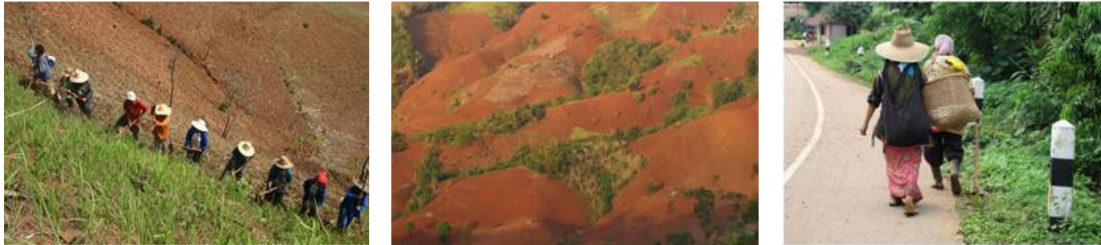
Figure 1. Photographies du bassin versant de Mae Salaep, Province de Chiang Rai, dans le Nord de la Thaïlande

Mon stage de DEA m'a lancée sur les routes des montagnes du Nord de la Thaïlande (figure 1), contexte différent du Nord-Est que j'avais étudié précédemment, non seulement sur un plan physique (des montagnes et non des plaines rizicoles) mais aussi sur un plan humain (des minorités ethniques marginalisées et non pas des paysans issus de la majorité thaïe).