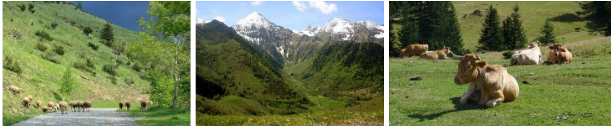
Figure 3. Paysages et pastoralisme dans les Hautes-Pyrénées

sites Natural 2000 et 1 Réserve Naturelle Régionale dans différentes vallées des Pyrénées. L'objectif de ces stages exploratoires était aussi pour moi d'identifier un site à approfondir sur le long terme dans les Pyrénées. C'est ainsi que je me suis mise à étudier la vallée d'Aure, partiellement intégrée au Parc National des Pyrénées, avec notamment son site Natura 2000 Rioumajou-Moudang, particulièrement riche et intéressant du point de vue des négociations autour de l'interface entre élevage et biodiversité (section 3.2.1).