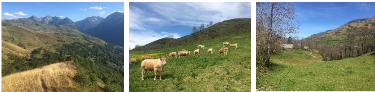
Figure 8. Paysages agropastoraux des Hautes-Pyrénées

La notion de multifonctionnalité de l'agriculture est souvent considérée dans la littérature comme un concept normatif ; comme nous l'avons vu dans la section 3.1.2.3, quel que soit le paradigme considéré, la multifonctionnalité est perçue comme quelque chose de souhaitable, un idéal normatif à viser. Certains auteurs s'y intéressent cependant en tant que fait social, notamment comme objet de constructions sociales. Des géographes ont ainsi analysé les luttes politiques et les négociations internationales qui ont entouré cette notion dans le cadre de l'Uruguay Round (Potter and Tilzey 2005). Dans les recherches présentées dans cette section, je propose comme ces auteurs d'appréhender la multifonctionnalité de l'agriculture comme l'objet de constructions sociales, mais au niveau local, en analysant la façon dont les acteurs des territoires des Pyrénées se sont approprié cette notion, l'ont re-construite et négociée en fonction de leurs représentations et de leurs intérêts, dans le cadre de jeux d'acteurs complexes. En effet, l'élevage de montagne en France a été fortement soutenu depuis