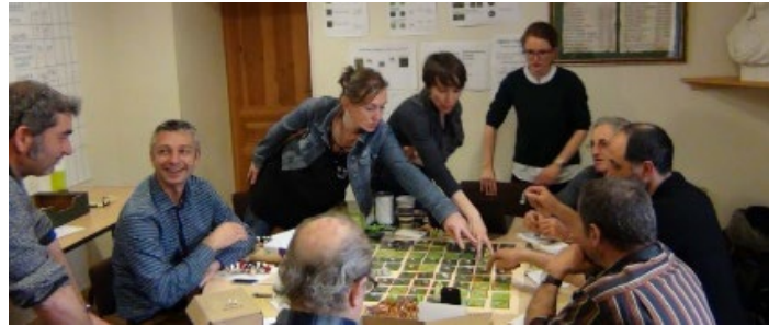
Figure 11. Plateau de jeu et session du jeu Secoloz, 2018, Mont Lozère