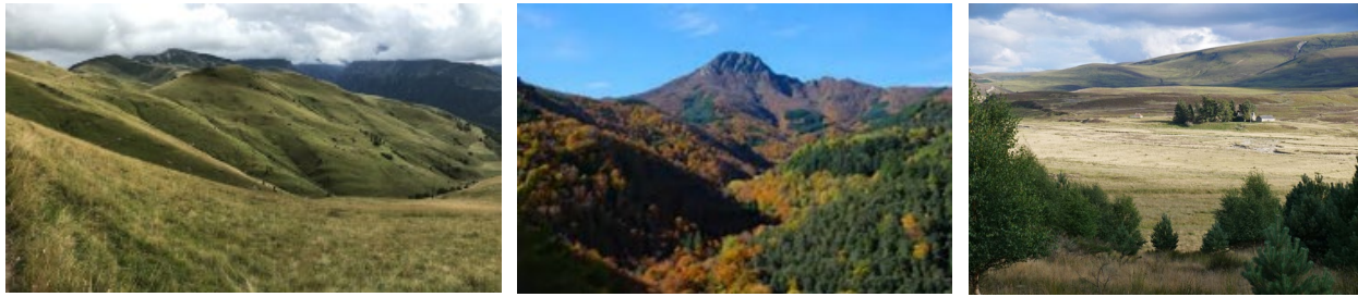
Figure 9. Aires protégées de montagne dans trois pays d'Europe, en France (Pyrénées) (gauche), en Espagne (Montseny)(centre) et en Ecosse (Cairngorms)(droite)

Le projet Secoco comportait quatre sites d'étude, dont trois étaient des aires protégées de montagne où se posaient des enjeux de boisement spontané (figure 9) : la vallée d'Aure dans le Parc National des Pyrénées (cf. section 3.2.1), le Mont Lozère dans le Parc National des Cévennes (cf. section précédente 3.2.2), et le Parc Naturel de Montseny en Catalogne, en Espagne. A ces trois terrains, est venu s'ajouter celui du Parc National des Cairngorms, dans les Highlands d'Ecosse, que j'ai investigué dans le cadre de mon année de mobilité au sein de l'Institut James Hutton à Aberdeen (cf. section 1.5.5).