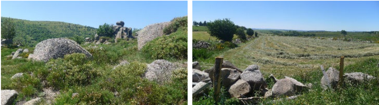
Figure 8. Chaos granitique typique du Mont Lozère (à gauche) et blocs de granites déplacés en bordure d'un pré de fauche (à droite)

Moreau a questionné cet état de référence, sa subjectivité, son caractère évolutif et « glissant », sa construction sociale et son usage dans les processus de gouvernance territoriale d'une aire protégée.