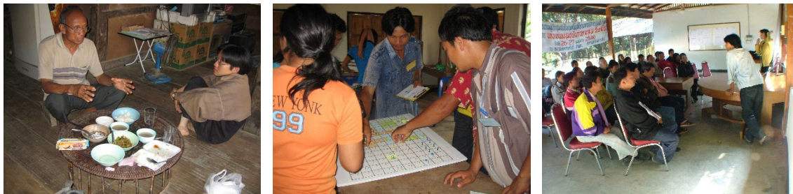
Figure 6. Sessions de jeux de rôles et entretien semi-dirigé dans les communautés Miens de Ba Nam Ki et Ban Nam Paeng, 2006, Province de Nan, Nord Thaïlande

La seconde expérience fut conduite dans le contexte d'un conflit ouvert entre un parc national en cours de création et deux communautés Miens localisées en bordure du parc (Barnaud et al. 2008b, Barnaud and Van Paassen 2013)(figure 6). Le parc national avait pour mission de protéger la forêt et la biodiversité des hauts bassins versants du pays, alors que les communautés montagnardes étaient dépendantes de ces forêts, la collecte des produits forestiers non ligneux constituant une part importante de l'alimentation et du revenu des familles les plus pauvres. Officiellement, toute activité humaine autre que le tourisme est interdite dans l'enceinte des parcs nationaux thaïlandais. Cependant, dans la pratique, des arrangements informels sont observés. Mais dans le cas présenté ici, la situation était si conflictuelle qu'aucun dialogue n'avait pu être établi, ni sur la question des futures frontières du parc ni sur celle des règles qui y seraient appliquées. Jusqu'à la mise en place du parc, ces forêts avaient été gérées par les agents du département royal des forêts. Après plusieurs décennies de conflits violents avec les communautés, ces derniers avaient opté pour une approche plus conciliante. Craignant de voir ces relations se dégrader, ils soutenaient l'idée de mettre en place un processus ComMod pour tenter d'établir un dialogue entre le directeur du parc et les villageois.