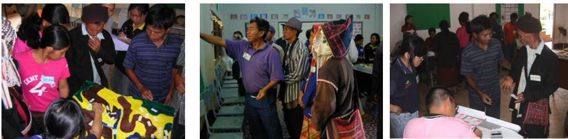
Figure 2. Sessions de jeu de rôles dans le village Akha de Mae Salaep, Province de Chiang Rai, 2005

En termes de vécu, j'apparente cette première expérience ComMod à ce que peut ressentir un surfeur lorsqu'il prend sa première longue vague en restant debout sur sa planche. Bien que je n'aie personnellement jamais atteint ce stade, j'imagine l'expérience semblable par son intensité, son