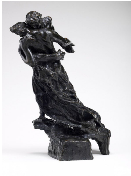
Figure 12. La Valse, sculpture de Camille Claudel (1864-1943)

maintenir les conditions d'un dialogue entre tous ces acteurs, en limitant les situations de monopole, d'hégémonie, en contrant les asymétries de pouvoir – s'approcher, en somme, de la situation idéale de parole d'Habermas. Mais il faut accepter que ce dialogue soit une situation d'équilibre instable perpétuelle, avec des solutions qui soient en permanence renégociées. Cette idée d'équilibre instable est bien illustrée par la sculpture de Camille Claudel, la valse (figure 12) : les deux amants y sont en mouvement, en équilibre précaire, voire sur le point de tomber, mais une harmonie et un sens se dégagent de ce mouvement, de cet équilibre instable. De la même façon, avec le dialogue, l'équilibre des rapports de force, c'est peut-être quand c'est figé que cela devient problématique. Certes, il y a certains points de vue que, personnellement, j'aimerais voire muselés, et de façon définitive. Mais cette idée d'équilibre instable, de négociation permanente des différents porteurs d'enjeu, implique de comprendre et d'accepter comme légitimes tous les points de vue en présence – dans certaines limites tout de même peut-être, comme le cadre du respect des droits de l'homme - : ils défendent tous quelque chose qui doit être entendu et pris en compte (telle espèce en voie de disparition, tel attachement à un lieu, tel intérêt économique, telle peur identitaire), et il semble dangereux que quiconque décide que certains points de vue sont plus légitimes que d'autres.