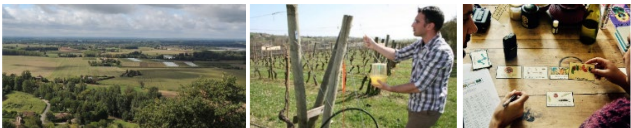
Figure 10. Paysage du terrain d'étude dans le Tarn-et-Garonne (à gauche), arboriculteur participant au projet (au centre) et séance de co-construction du modèle Bayésien (à droite)