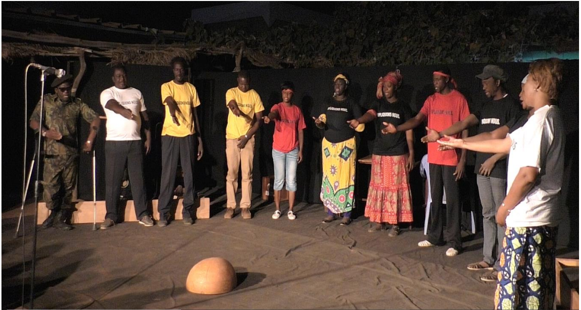
« Impliquons-nous pour changer ensemble ce pays »

Les comédiens disposés en arc de cercle, par l'usage de la première personne du pluriel se formulent une injonction réciproque au même moment qu'ils la formulent à l'endroit du spectateur. L'énoncé performatif institutionnel se mue en énoncé ordinaire que tout un chacun peut s'appropriier et répéter à l'infini. Il marque la mémoire des spectateurs dans sa tournure absolue « il faut s'impliquer » permettant d'envisager une extension à l'infini des domaines de l'agir citoyen.