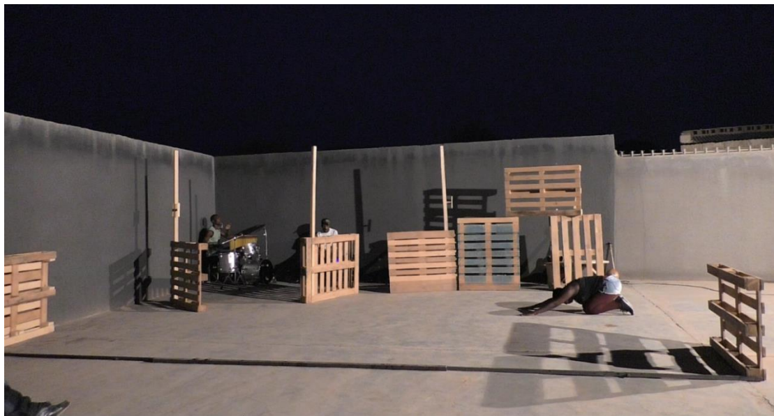
Étape de création à Saaba, centre culturel Pantaabo, février 2017.

La mention du 28 octobre 2014 inaugurant sa prise de parole souligne le lien direct entre la révolte populaire et la prise de conscience de son droit à s'exprimer. Cette analogie s'actualise à différents niveaux : le parallélisme syntaxique « 27 ans que ça dure et c'est trop et ça va cesser. 28 ans que je porte son absence et c'est trop et ça va cesser » établit un lien entre la durée du régime semi-autoritaire de Blaise Compaoré et celle de l'emprise de l'absence du père sur le destin d'Edoxi. La scène est dans la phrase suivante mise en dans un rapport d'équivalence avec le pavé battu par les manifestants. C'est ainsi une performance féministe qui va avoir lieu puisque les deux figures combattues dans le combat collectif et individuel incarnent l'autorité patriarcale. Edoxi se livre sur scène à des mouvements rituels qui permettent de mettre en évidence la théâtralité intérieure qui préside à cette émancipation.