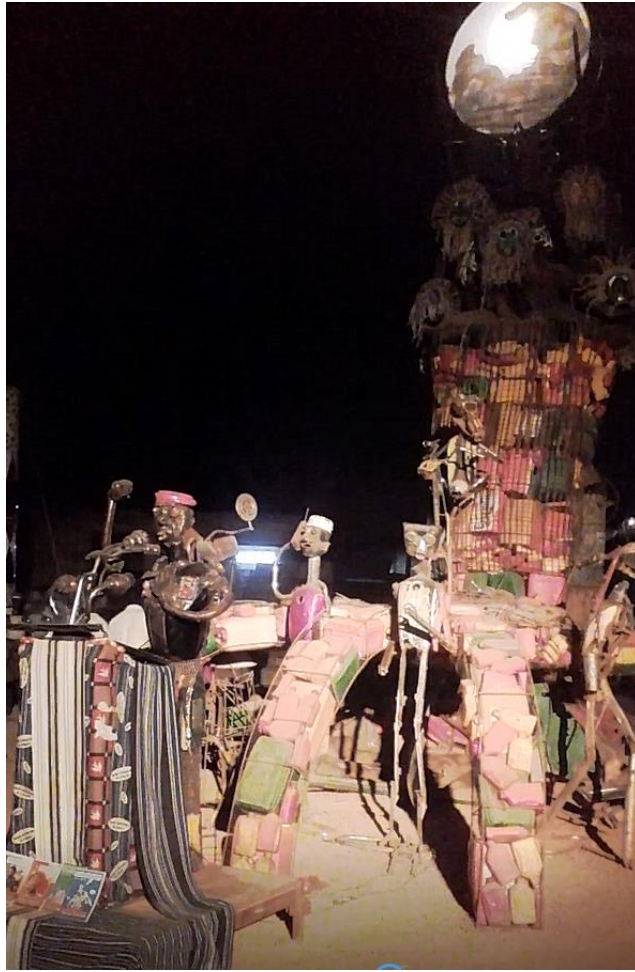
Thomas Sankara sur le « rond-point de Sahab », quartier Bougsemtenga à Gounghin, novembre 2016.

L'installation de Sahab Koanda s'articule également à un imaginaire de la lutte nationale et panafricaine fondé sur l'art de la réduplication, réactivé dans le contexte de la chute de Blaise Compaoré : « [...] et 27 ans après sa mort tous les Africains savent que Sankara a dit : « vous me tuerez tout seul mais bientôt il y aura 1000 Sankara ». C'est lors des événements de 2014, que l'on a su vraiment, qu'il y avait 1000 Sankara au du Burkina Faso 1265 ». En l'occurrence, l'unisson autour de la parole politique de Thomas Sankara s'élabore à partir des performances de slam – comme à travers la chanson du collectif Qu'on sonne et voix-ailes auquel appartient Tony Ouedraogo 1266 – mais aussi des performances de conte 1267 . L'idée des voix singulières qui s'unissent pour faire corps politique travaille l'imaginaire urbain et génère des effets de résonance