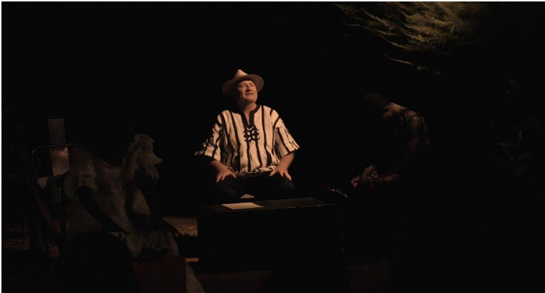
Monsieur Ouedraogo : un homme marquant pour le serveur.