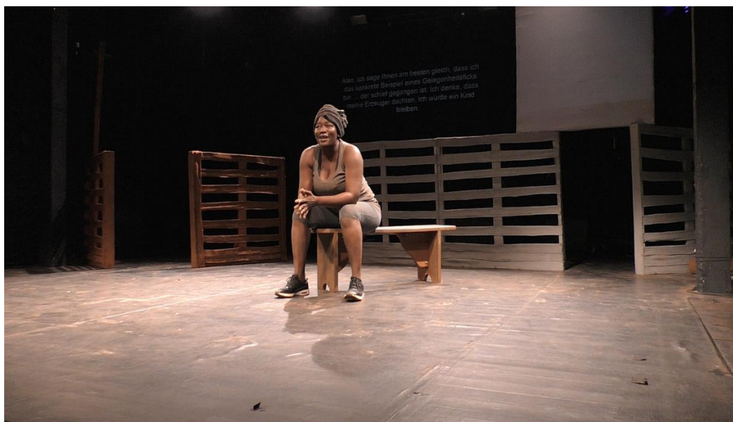
« Mam yaa a Edoxi » Je suis Edoxi, représentation à Cologne, le 16 juin 2017, Theater im Bauturm,

La pièce Legs élaborée à partir du matériau autobiographique amène l’auteur et comédienne à présenter son existence comme le motif principal de la prise de parole. La posture de la comédienne qui se présente dans des vêtements ordinaires assise sur le banc face au public illustre l’enjeu de dévoilement qui préside au développement de la parole solitaire.