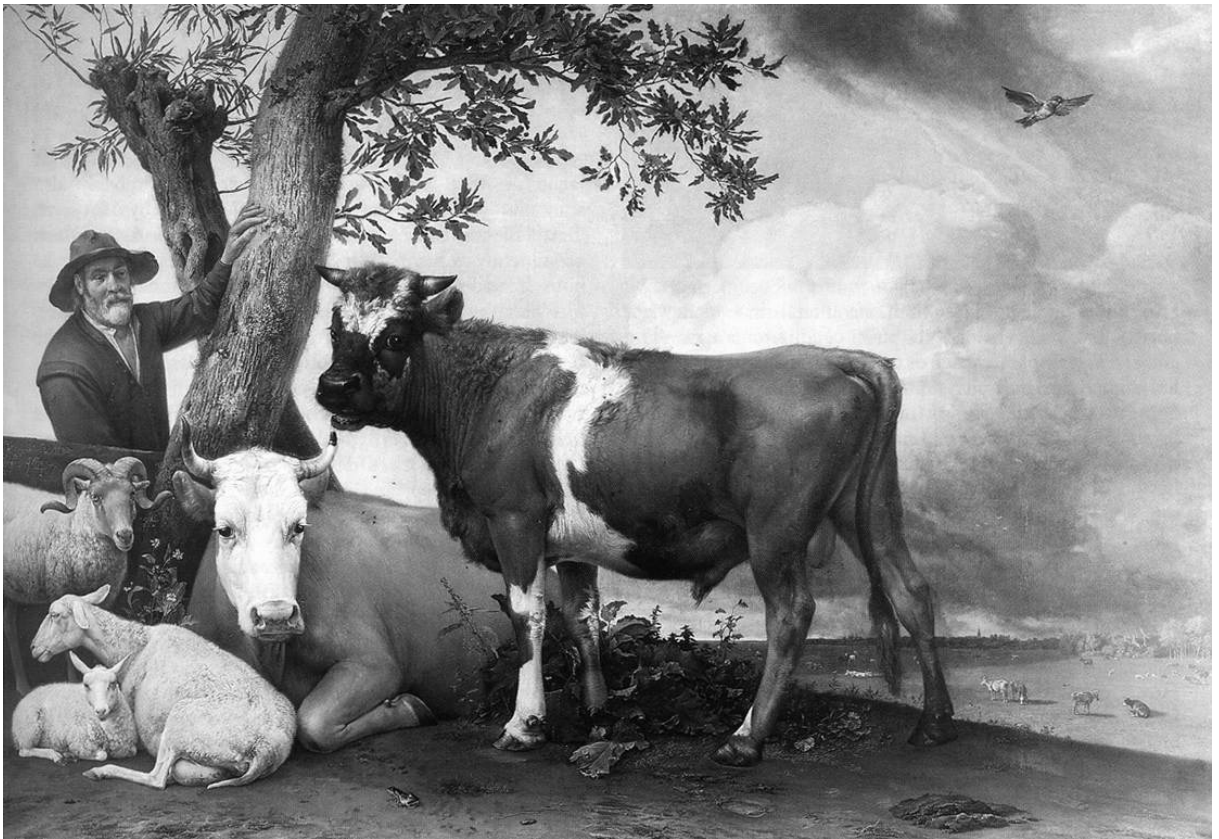
Paulus Potter, « Le Taureau » (1647)