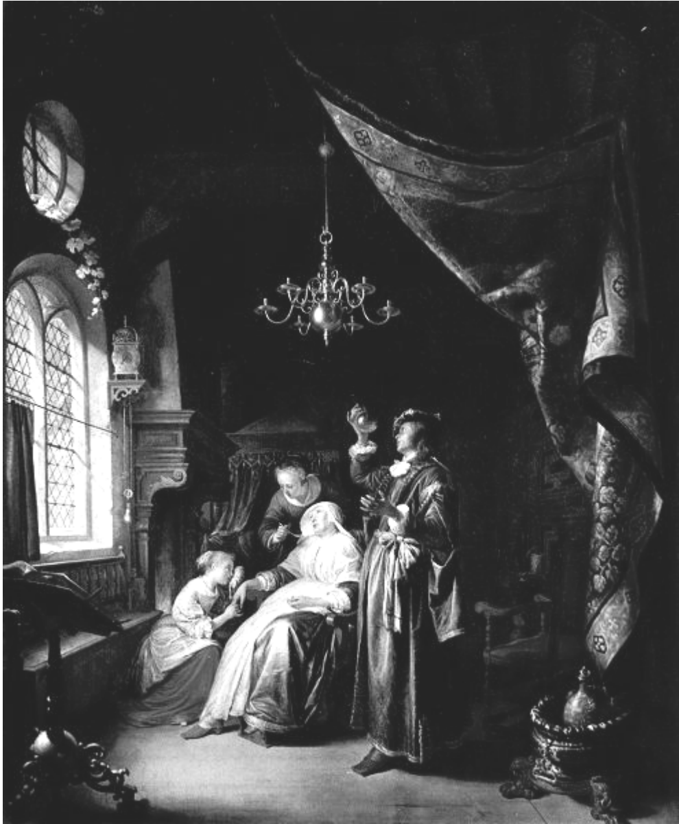
Gerard Dou, « La Femme hydropique » (1663)