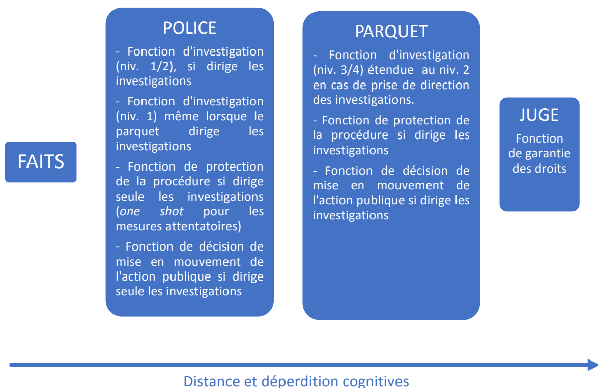
Schéma 2. Distance et déperdition cognitives dans la distribution des pouvoirs

407. Les avantages cognitifs dans la phase préparatoire du procès pénal. Ce schéma permet de comprendre qu'il y aura essentiellement deux avantages cognitifs à l'œuvre.