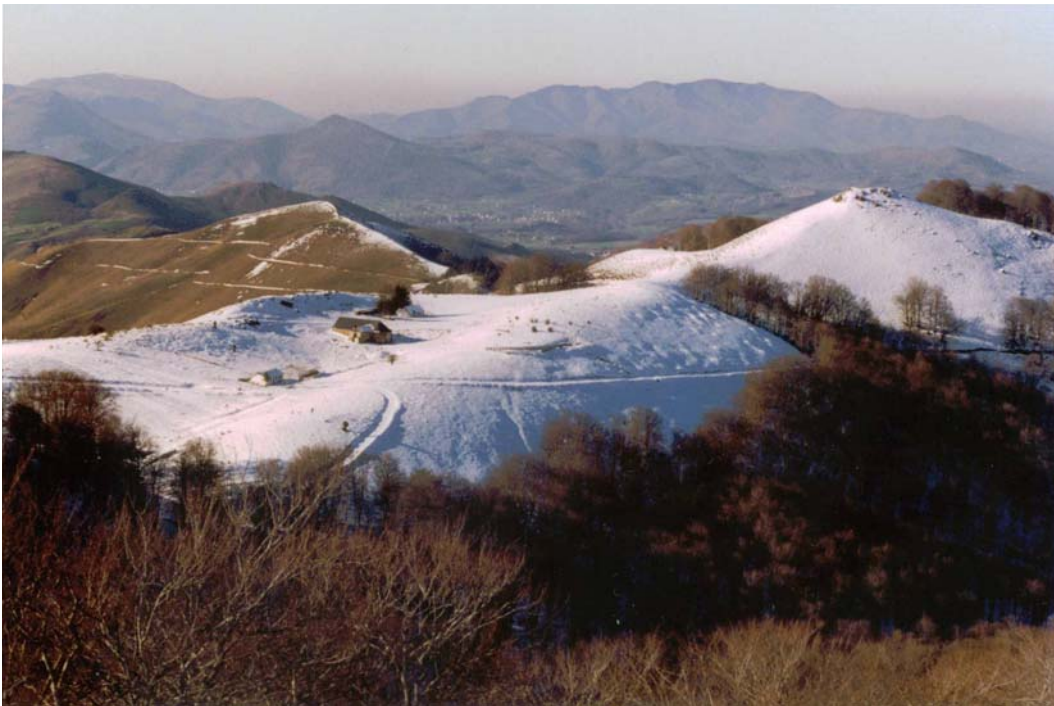
St-Sauveur d'Iraty (L. Gil, 2004)