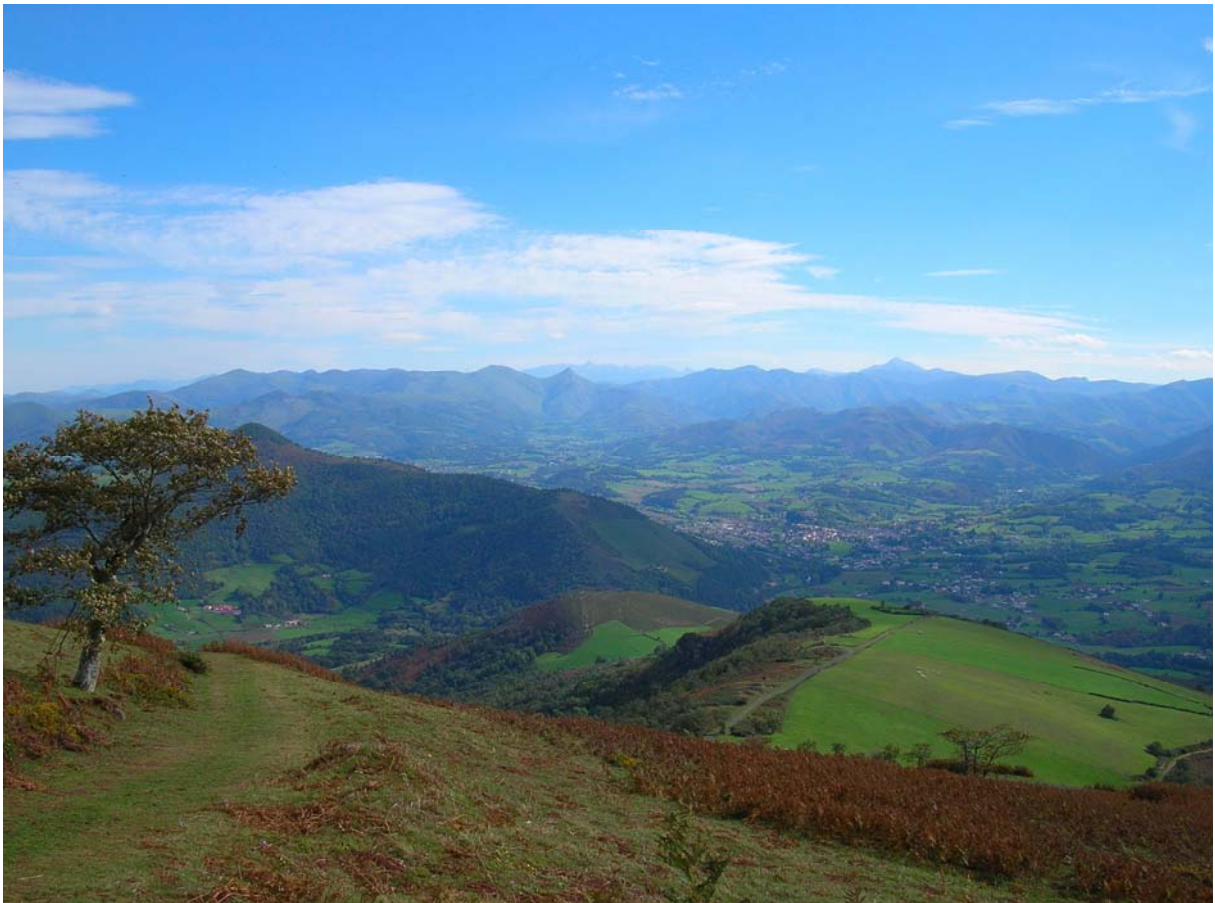
Le pays de Cize, depuis le Jara (G. Tessariol, 2005)