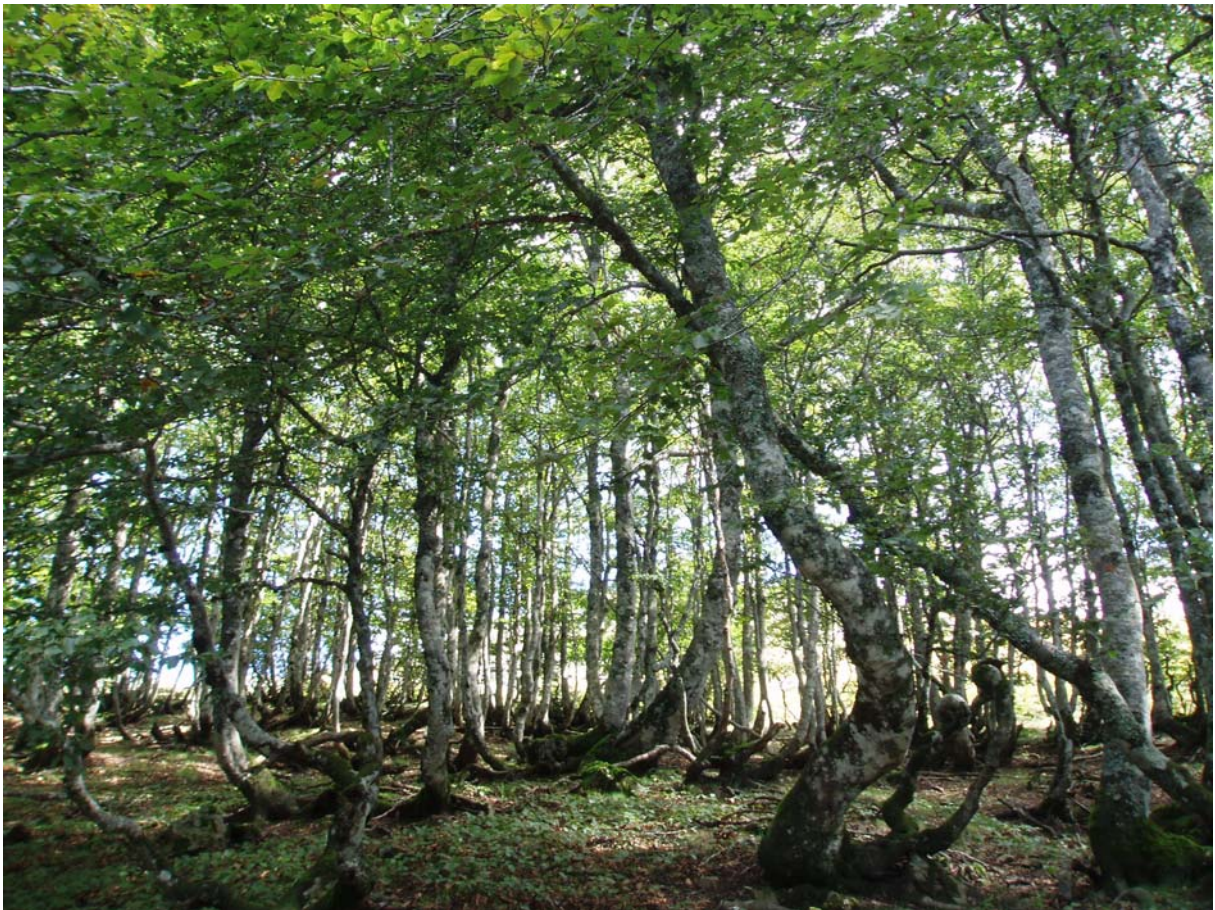
Hêtraie (Occabé, Iraty)