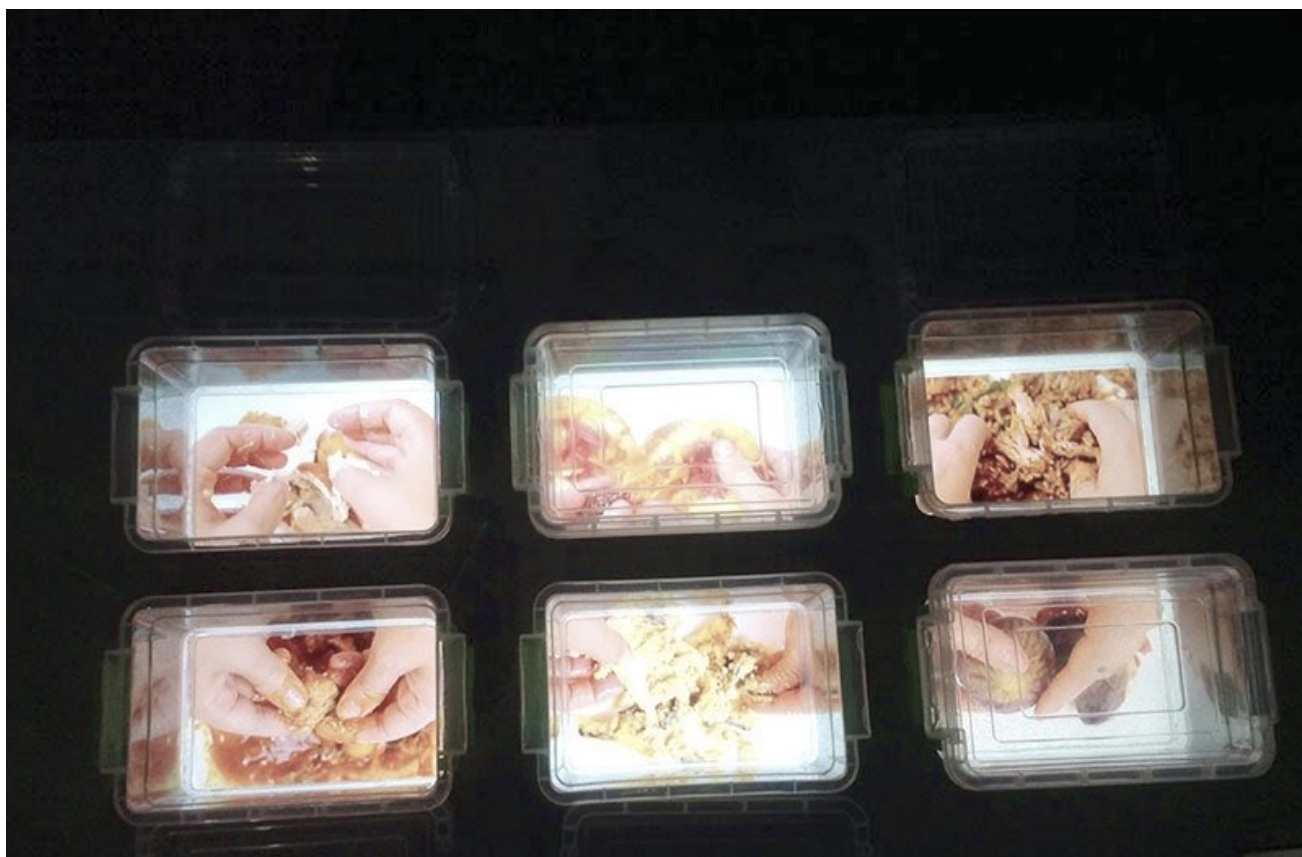
Figure N°1 : From Hand To Hand, Najah Zarbout

s'aperçoit que des écrans ont été placés au fond des contenants, projetant des vidéos illustrant, sur un fond blanc, des mains de femmes, malaxant de la nourriture.