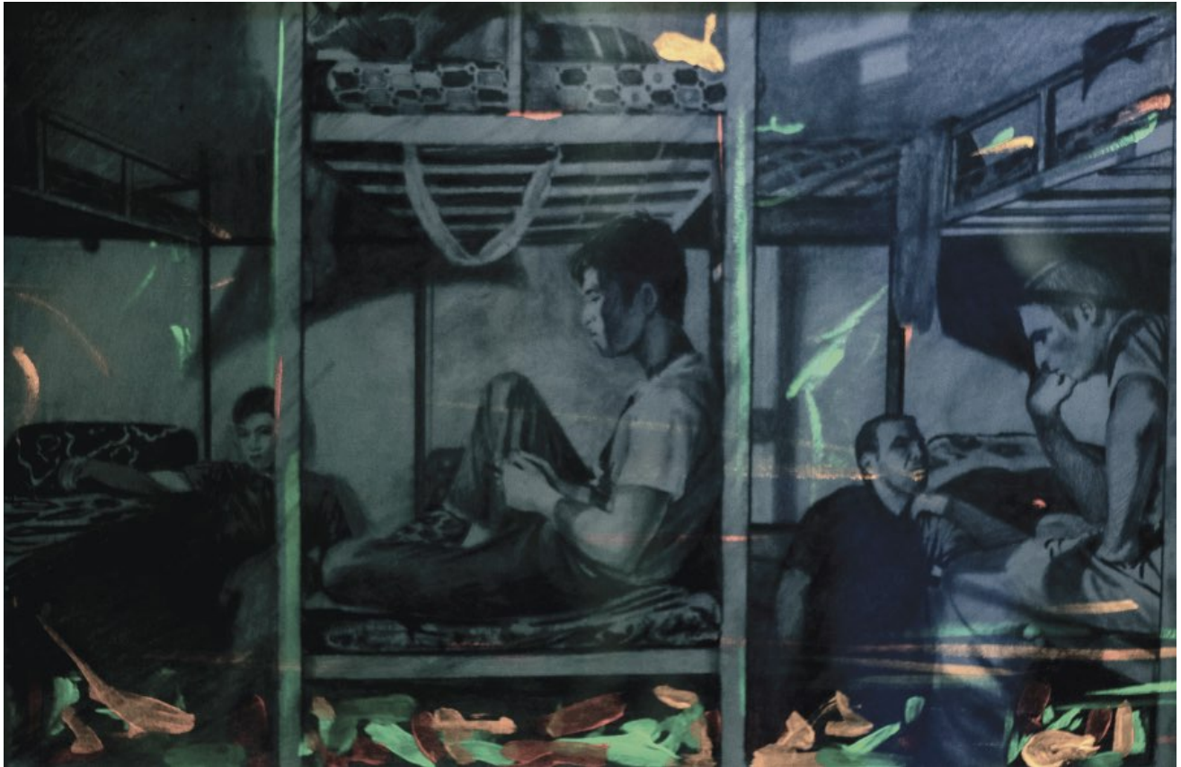
Figure N°3 : Tryptique 60/40, Walid Ardhaoui