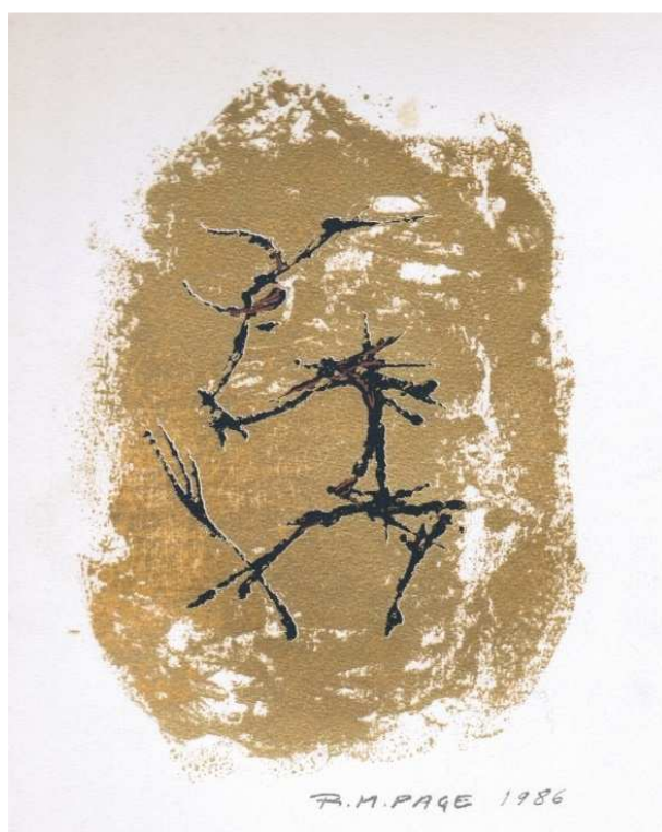
Figure 1 Carte du restaurant le Centenaire (Les Eyzies-de-Tayac, Dordogne, 1996) Archives personnelles