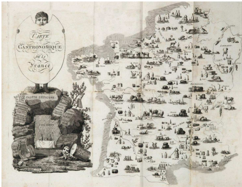
Figure 2 Carte gastronomique de la France par Cadet de Gassicourt (1809)