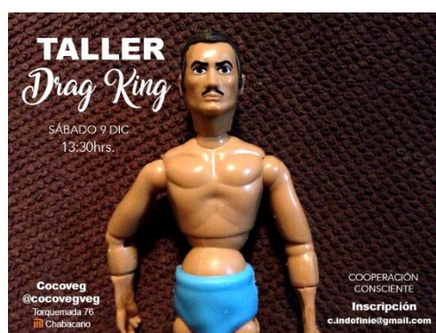
Figure 6. Flyer atelier CDMX, désigné par A. Mondragon, 2017

que personne ne viendrait. Mais on s'est dit qu'au pire, on pouvait faire la transformation dk entre nous et sortir dans l'espace public improviser une performance. L'atelier a finalement eu lieu le 9 décembre 2017. Il a duré quatre heures, puis s'est prolongé dans la soirée. En plus des ateliers, j'ai aussi réalisé des conférences performées à Guadalajara et à Paris, qui m'ont permis d'expérimenter le dk dans les espaces académiques et présenter quelques-unes de mes réflexions sur ce sujet.