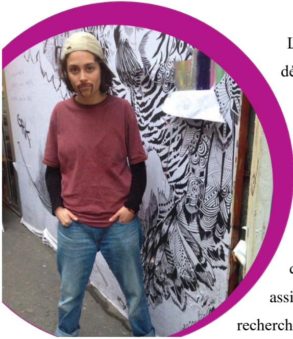
Figure 11. le premier

pourrais faire un latin-lover . Toutefois, à la fin de l'atelier, pendant que l'on se prenait en photo entre kings , l'un d'entre eux m'a dit que je faisais peur et que je pourrais être un sicario .