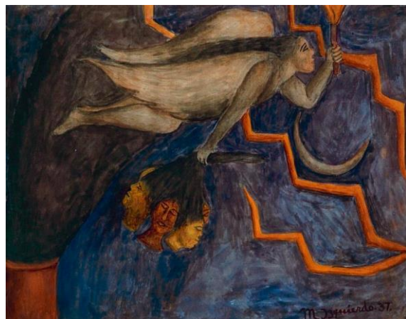
Figure 2. Izquierdo, Alegoría de la libertad, 1937