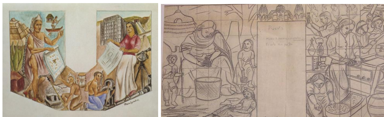
Figure 1. Izquierdo, proyecto mural, 1945