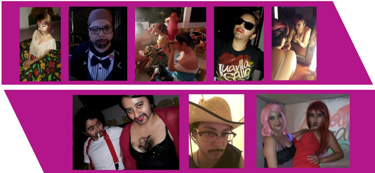
Figure 8. drags à l'atelier de Colima, 2017

« Certes, il n'y a pas des théorbes, pas de tubas, pas d'orchestres d'asors, au milieu des castration qu'il [Heliogabale] impose, mais qu'il impose chaque fois comme autant des castrations personnelles, et comme si c'était lui-même, Elagabalus, qui était châtré. Des sacs de sexes sont jetés du haut des tours avec la plus cruelle abondance »