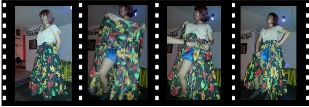
Figure 9. la joupe, 2017