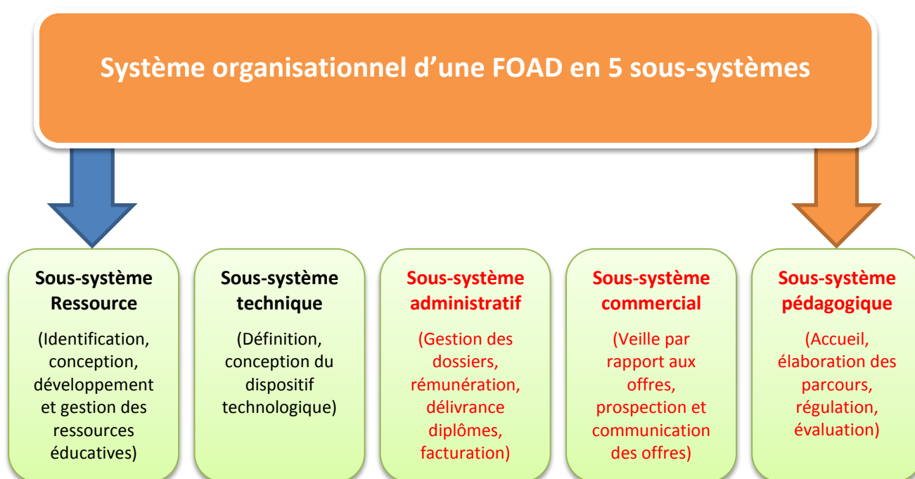
Figure 2 : Le système d'apprentissage à distance.

Le niveau méso de l'ingénierie correspondant à ce que Leclercq considère comme l'ingénierie de la formation. Nous avons déjà vu que ce niveau était celui de la mise en œuvre institutionnelle des actions de formation et qu'il se référait aux pratiques de l'agir organisationnel des phénomènes d'éducation et de formation des institutions ou structures de formation. Cette activité relève davantage de la gestion administrative que pédagogique. À ce niveau, l'action d'ingénierie est centrée sur l'organisation administrative du système d'apprentissage. Celui-ci est composé des cinq sous-systèmes que nous représentons dans le schéma n°2, ci-dessous. De ces cinq sous-systèmes, deux sous-systèmes, ceux des ressources et de la technique, ne relèvent pas de la compétence directe du coordinateur. Il est donc contraint de maintenir régulièrement des échanges avec les responsables de ces sous-systèmes et de veiller à une contribution optimale de ces sous-systèmes au fonctionnement général du dispositif.