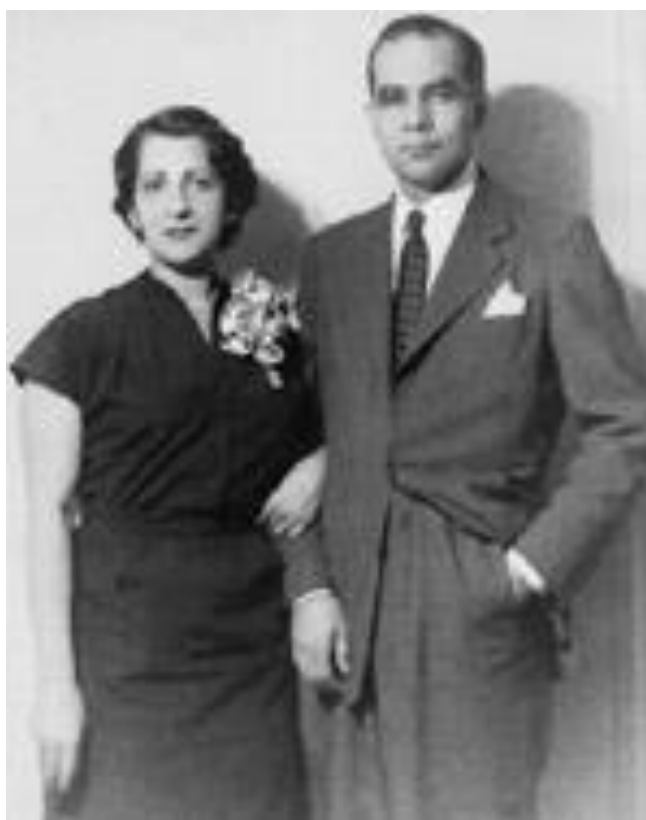
Figura 1: Glauce e Josué de Castro