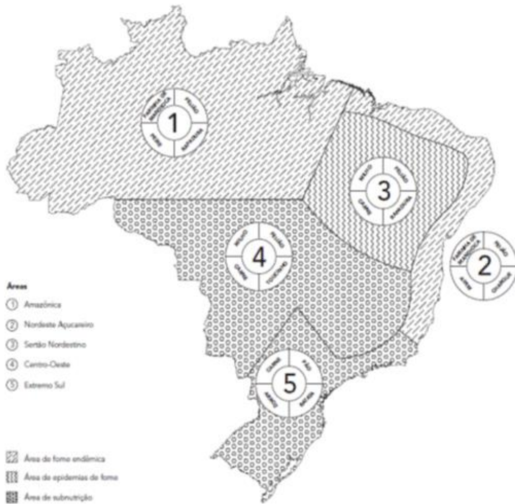
Figura 3: Áreas alimentares do Brasil