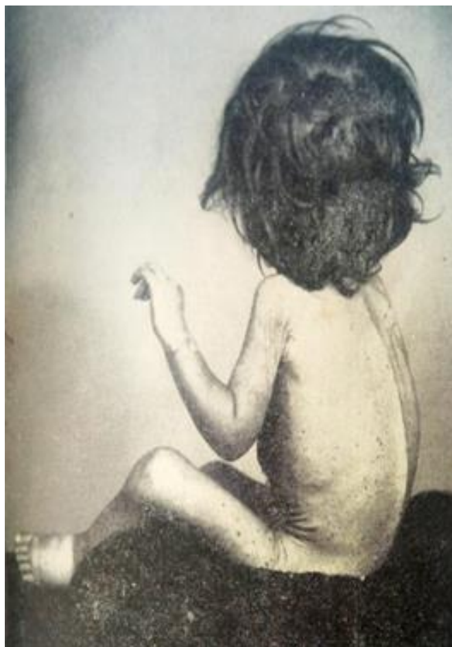
Figura 7: Criança com pelagra purpuriforme

Fonte: Geopolítica da Fome, 1965. Figura 5: Criança com pelagra purpuriforme.