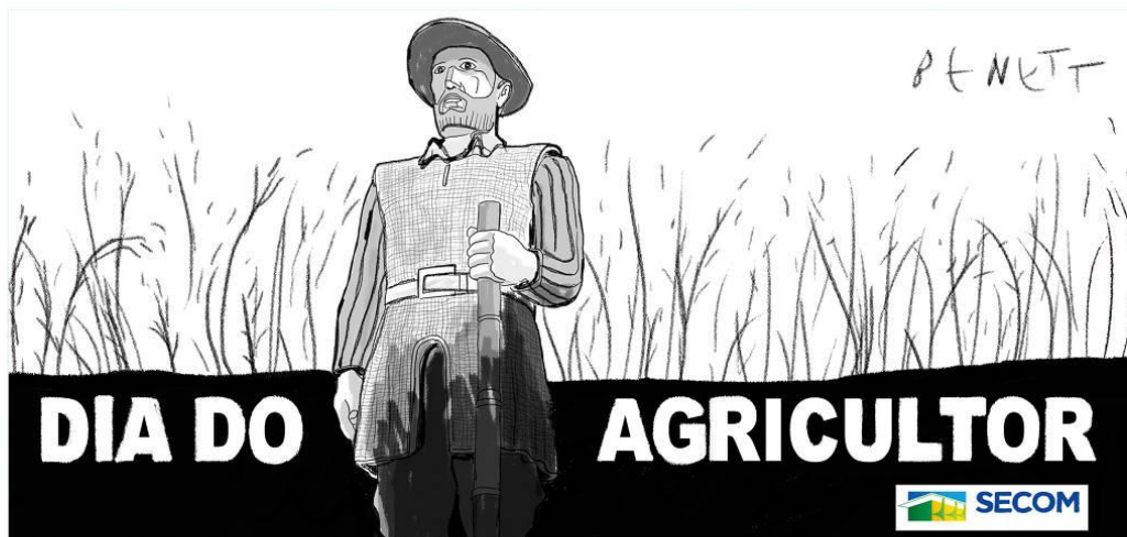
Figura 12: Charge de Benett publicada na Folha de S. Paulo dia 29/07/2021