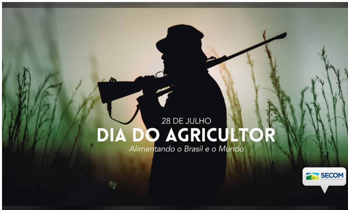
Figura 11: Publicação feita pela Secretaria de Comunicação (Secom) em redes sociais mostra homem com rifle para homenagear o Dia do Agricultor