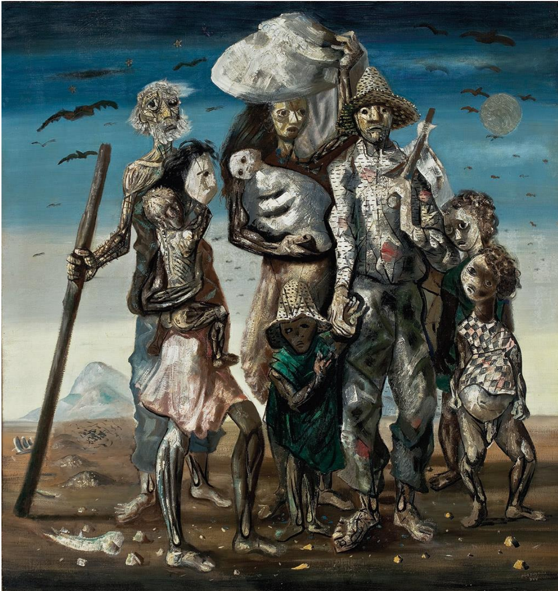
Figura 2: Retirantes , Cândido Portinari (1944)