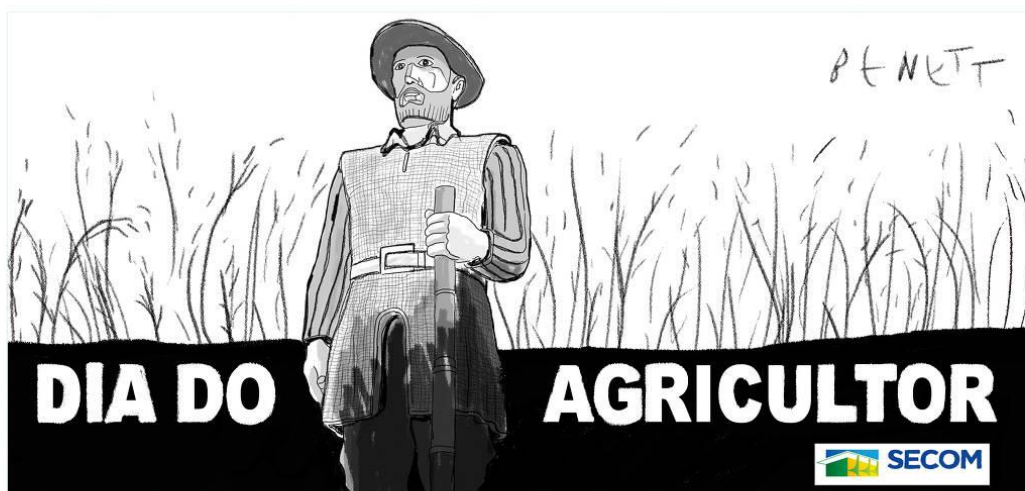
Figura 12: Charge de Benett publicada na Folha de S. Paulo dia 29/07/2021