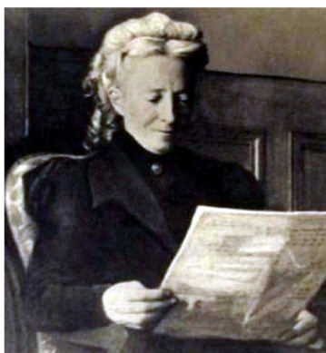
Pauline Kergomard, date inconnue