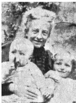
Pauline Kergomard et deux de ses petits-enfants, date inconnue