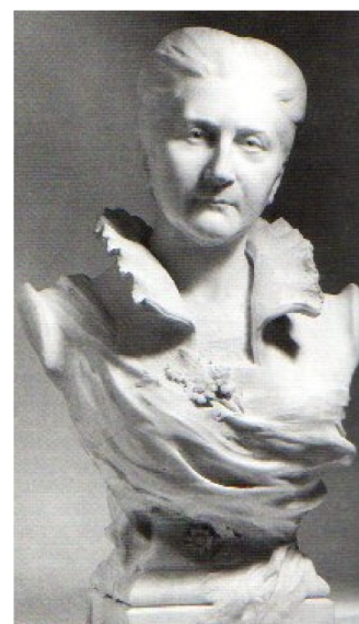
Clarisse Coignet, buste de marbre blanc, 1888, par Syamour (Marguerite Gagneur).

Clarisse Coignet est sans aucun doute une pionnière, dont la pensée étonne par la diversité des champs qu'elle brasse. Consciente du caractère exceptionnel de sa trajectoire, Clarisse Coignet n'hésite d'ailleurs pas à se mettre en scène comme intellectuelle dans ses mémoires, ainsi que dans d'autres textes où elle utilise le « je » pour s'exprimer avec autorité sur des sujets politiques.