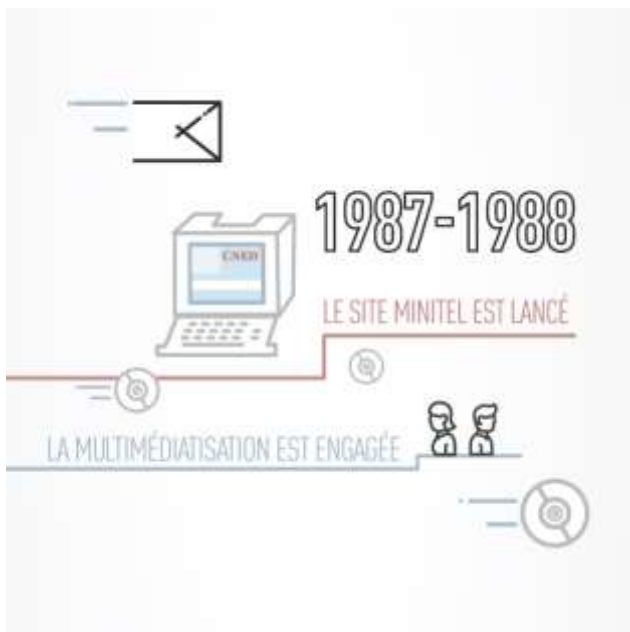
Figure 1 Image diffusée via Twitter en 2019, à l'occasion des 80 ans du Cned

En revanche, j'ai une bonne pratique du Minitel, car parmi mes nombreux petits boulots, j'interviens dans un programme expérimental d'enseignement assisté par télématique du CNED 5 . Il s'agit de corriger des cours à distance de grammaire et d'orthographe, classiquement dispensés par livrets envoyés par la poste, et d'animer le groupe par télématique. J'ai des élèves dans toute la France, et je découvre que de vrais liens peuvent se créer avec une promotion, via ce réseau, pour peu que des leaders d'opinion se dégagent dans le groupe. Mes employeurs