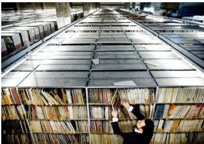
Figure 2 La « disco » de Radio France. Des millions de supports et de fichiers musicaux, qui m'ont souvent empêchée de dormir.

La numérisation des studios est en marche et s'accomplit au désespoir des techniciens, dépossédés de leurs prérogatives techniques. Les missions des documentalistes sont sans cesse menacées par le numérique. Je collabore avec la direction de documentation pour mettre en place des applications intranet qui décloisonnent les services et