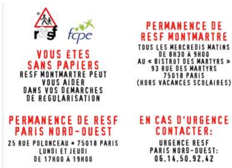
Figure 6 Tract de RESF affiché dans les écoles primaires du 18 e arrondissement de Paris

auparavant pour sanctuariser les établissements d'enseignement et mettre fin aux arrestations d'écoliers et de parents d'élèves dans l'enceinte et aux alentours des écoles. Sans existence légale, sans représentants et sans adhésions, RESF est une structure informelle, dont les membres répartis dans toute la France, communiquent par les mails et les réseaux sociaux.