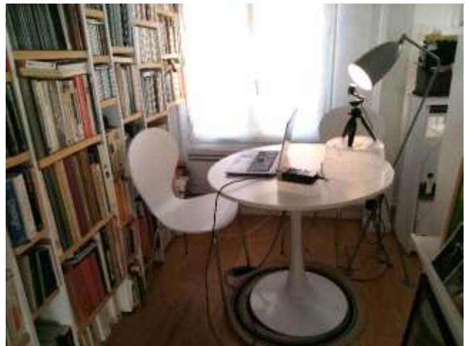
Figure 8 Studio improvisé "avec les moyens du bord".