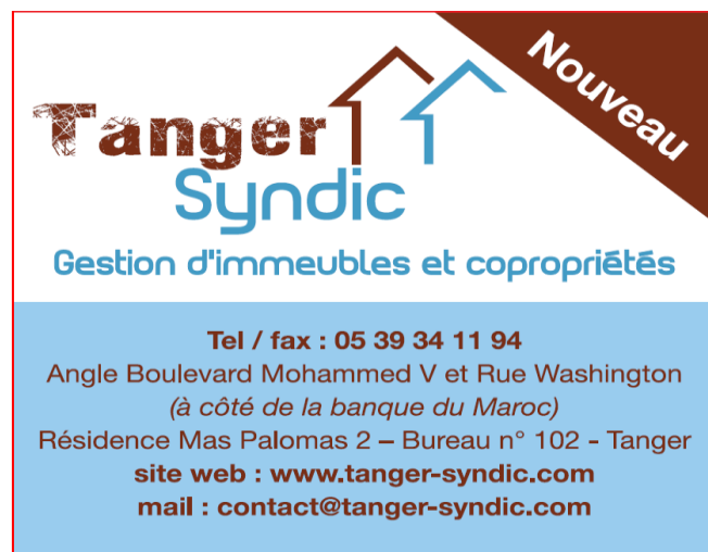
Illustration 1 : Annonce de création du cabinet Tanger Syndic dans un journal local

Cette phase de prospection commerciale intervient dans un environnement où la demande de gestion de syndic est particulièrement élevée ; ce qui a motivé la création du cabinet Tanger Syndic par ses associés. De nouveaux immeubles se sont construits dans la ville en raison de la forte croissance du secteur de la promotion immobilière et de la construction durant la décennie 2000-2010. Le démarrage doit cependant faire face à une