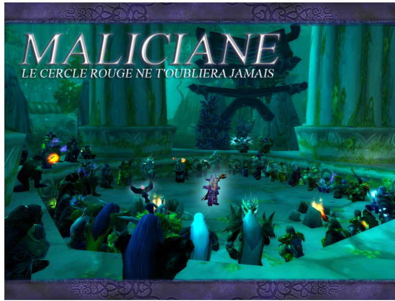
Fig. 27 : Mal'Ganis 2

À tous ces titres, il semble plus que nécessaire d'investir le monde d'Internet et des jeux vidéos en ligne afin de rechercher les multiples socialisations funéraires instituantes accessibles. Dans cet espace particulier, la mort est circonscrite et ritualisée par les pairs pour construire du sens autour de la mort de leur ami. Au même titre que les lieux de l'accident, la tombe peut être investie dans un premier temps mais les amis ne se préoccupent pas, ou très peu, de l'entretien de cette trace. En revanche, ils préfèrent choisir des espaces et des matières qui signifient la durée et qui ne leur exigera pas un investissement régulier. Les uns vont poser une plaque et la sceller sur les lieux de l'accident, les autres vont se rendre visible pendant un temps et ensuite figer dans la pierre et aux yeux de tous des memento mori , ou encore d'autres vont discuter via Facebook de l'épithaphe à graver sur la pierre tombale, et même créer une page Facebook. La pierre et le dessin, même si les formes de les utiliser sont différentes, reprennent des images classiques pour signifier la durée. En cela, Internet est un des outils signifiant la durée et permettant un minimum d'investissement de la part des amis tout en sachant que la page restera disponible.