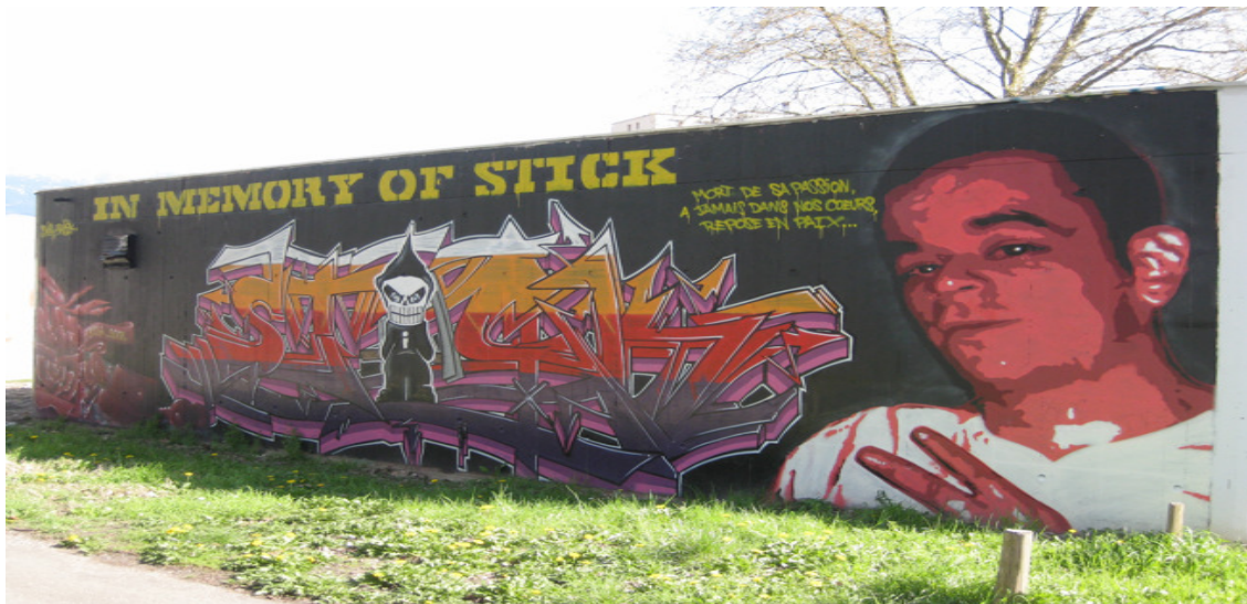
Fig. 25 : In Memory of Stick

Le premier a été effectué après 2004, le jeune avait 19 ans. Le second graf, pour un jeune décédé en 2008 à l'âge de 24 ans, a été produit à Grenoble sur un axe cycliste très fréquenté pour aller sur le site universitaire :