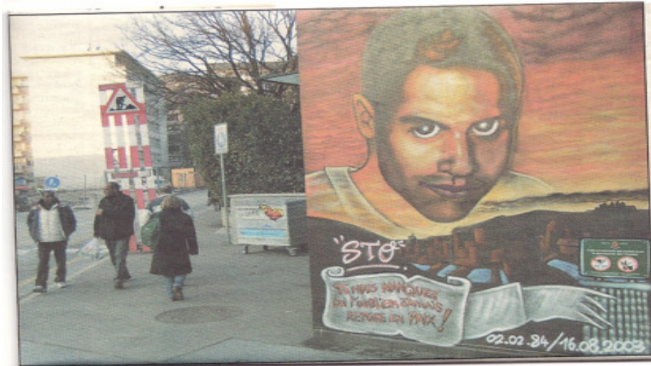
Fig. 24 : Graff (Tiré d'un article du journal Le Courrier (Genève), le 17 Décembre 2005, p10)

Le premier a été effectué après 2004, le jeune avait 19 ans. Le second graf, pour un jeune décédé en 2008 à l'âge de 24 ans, a été produit à Grenoble sur un axe cycliste très fréquenté pour aller sur le site universitaire :