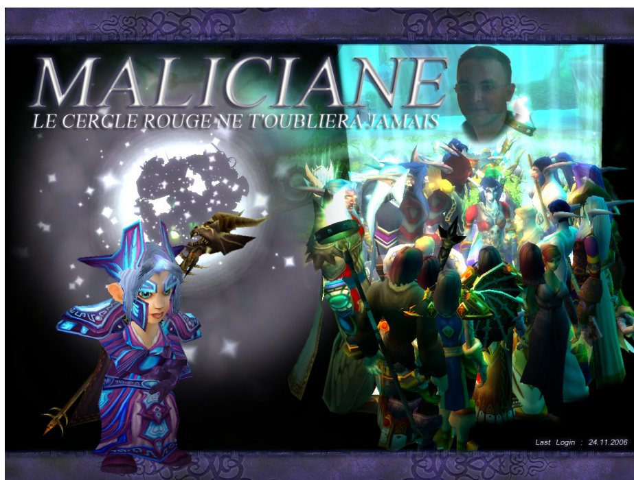
Fig. 26 : Maliciane I 405

Ayant appris le décès d'un des joueurs, les membres de la gilde ont décidé de se recueillir dans le jeu avec leur personnage respectif. Tous se sont réunis auprès d'un lac, le personnage du défunt aux bords de l'eau et tous les autres compagnons l'entourant dans un moment de recueillement. La plateforme du jeu en réseau a permis d'une certaine manière à tous ces joueurs de signifier l'absence à l'intérieur du jeu et de ritualiser l'adieu dans ce cercle d'appartenance particulier :