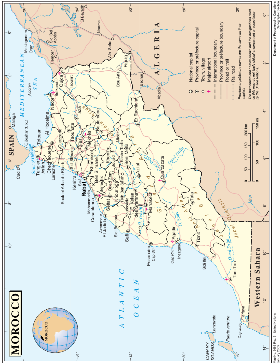
• Figure 1 Carte générale du Maroc