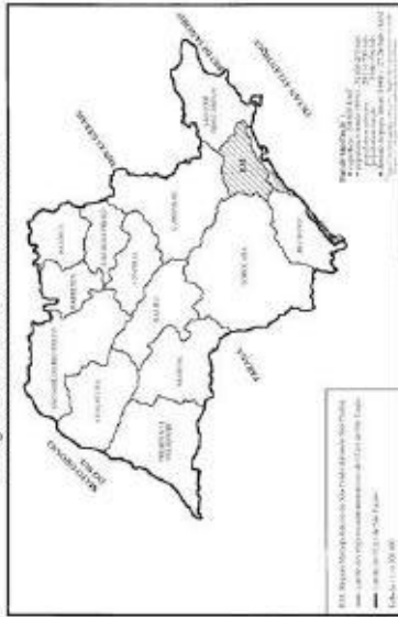
Carte n° 2 Les régions administratives de l'Etat de San Paulo