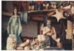
Photo 3. Sculpture de la vente et du marché à du Village de la forêt