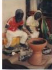
Photo 7. Sculpture de la vente et du marché à du Village de la forêt