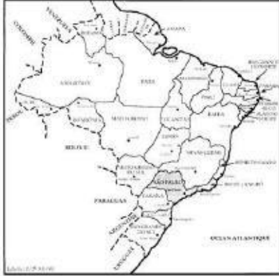
Carte n° 1 Les Etats du Brésil