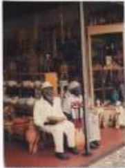
Photo 6. Sculpture de la vente et du marché à du Village de la forêt