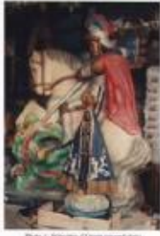
Photo 1. Sculpture d'un homme enroulé dans un tissu (Cameroun, Gabon)