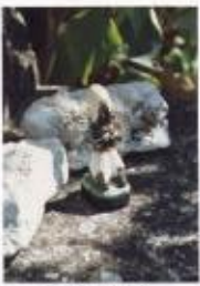
Sculpture de la chèvre