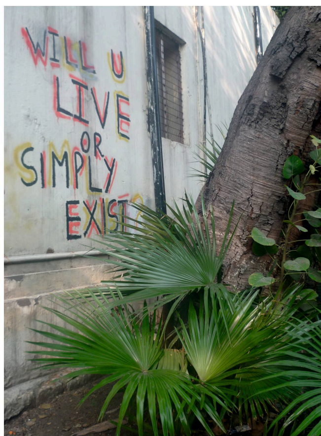
Image 4 : Graffitis sur les murs de l'université.

On remarque ici une spécificité de l'université Ambedkar : la volonté de resituer la psychologie individuelle dans une trame sociale plus vaste et de ne pas séparer l'étude des phénomènes psychiques de la prise en compte des conditions d'existence réelles des individus – toutes choses qui sont en assez nette rupture avec ce qui se fait dans la grande majorité des départements de psychologie en Inde. De façon plus concrète, le master dure deux ans, avec un stage d'un mois dans une institution (hôpitaux et ONG essentiellement) pendant l'été qui sépare les deux années. Les étudiants doivent rédiger un mémoire la deuxième année sur un sujet de leur choix, et ils sont