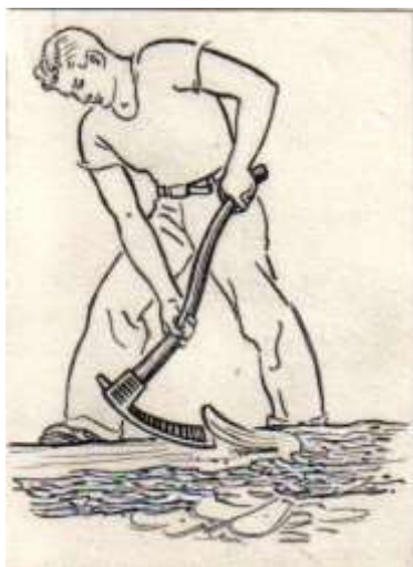
Figure 2. Écorçage à l'herminette 9

Il n'est donc pas nécessaire de supposer qu'il y a eu contact entre les peuples en question. Là encore, le parallèle entre la biologie et l'ethnologie est mobilisé, chacune mettant en évidence un phénomène de convergence :