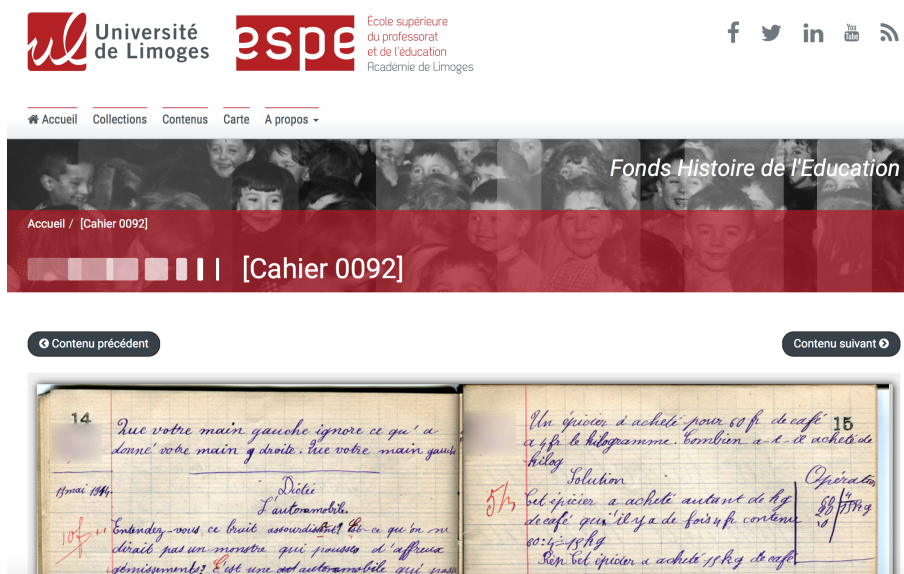
FIGURE 3.1 – Exemple de consultation du cahier 0092, cahier de devoirs mensuels (élèves), CE 1, 1913-1914, École d'Eyjeaux (Haute-Vienne), http://www.unilim.fr/histoire-education/items/show/129