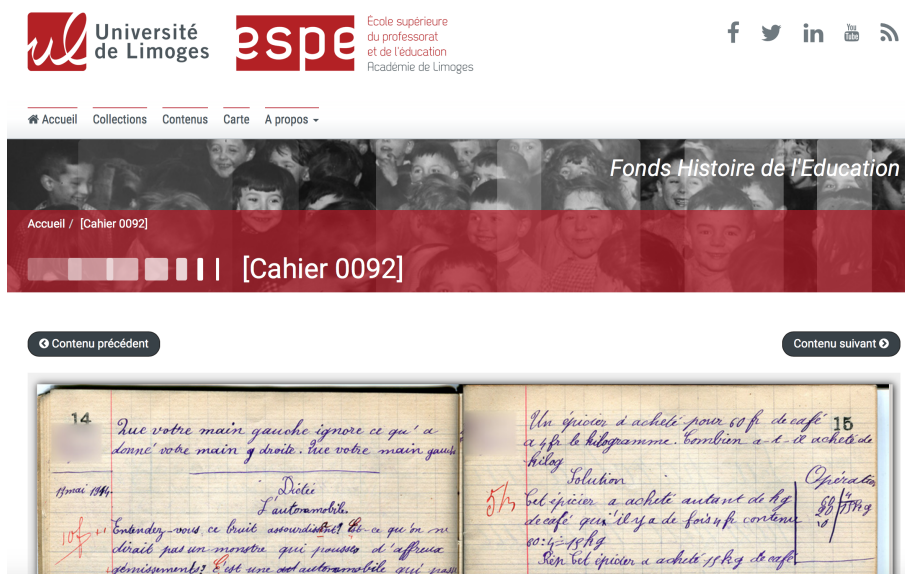
FIGURE 3.1 – Exemple de consultation du cahier 0092, cahier de devoirs mensuels (élèves), CE 1, 1913-1914, École d'Eyjeaux (Haute-Vienne), http://www.unilim.fr/histoire-education/items/show/129