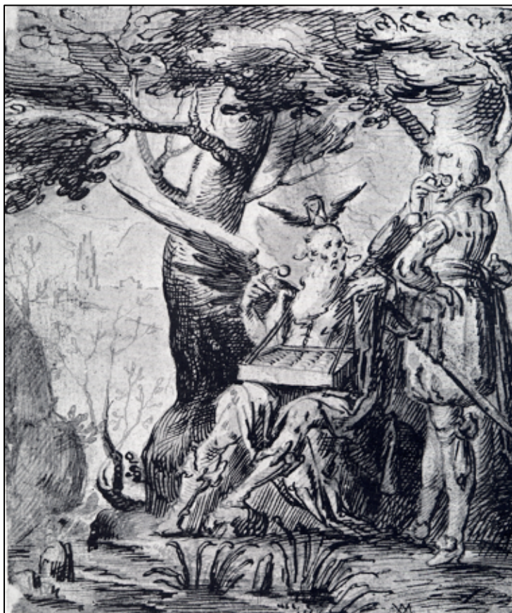
H. Jansz van Müller, La Mort qui vend des lunettes (1614), Florence. Museo di Storia della Scienza.

Nicole 1 – qui conserve quelque chose de ses usages dévotionnels –, ensuite chez Helvétius, en contexte matérialiste 2 .