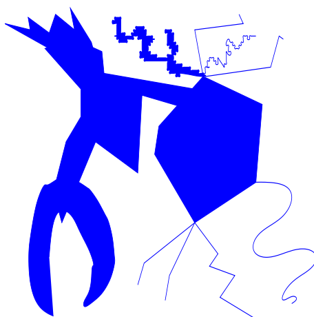
FIG. 2.3 – un espace à courbure négative

On vérifie facilement que la région simplement connexe du plan représentée sur la figure 2.3, munie de la distance géodésique est un espace à courbure négative (rappelons que la distance géodésique entre deux points d'une partie B du plan euclidien est égale à la longueur pour la distance euclidienne du plus court chemin contenu dans B reliant ces deux points) .