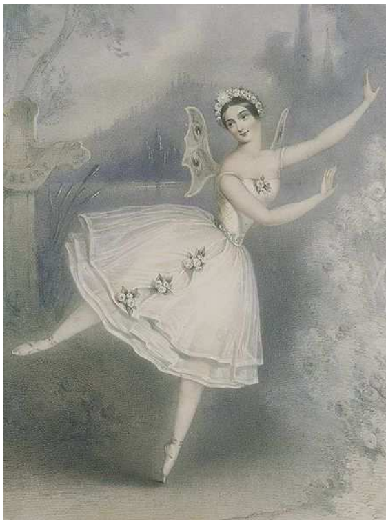
Carlotta Grisi en Giselle, Lithographie de John Brandard, 1841 1 .