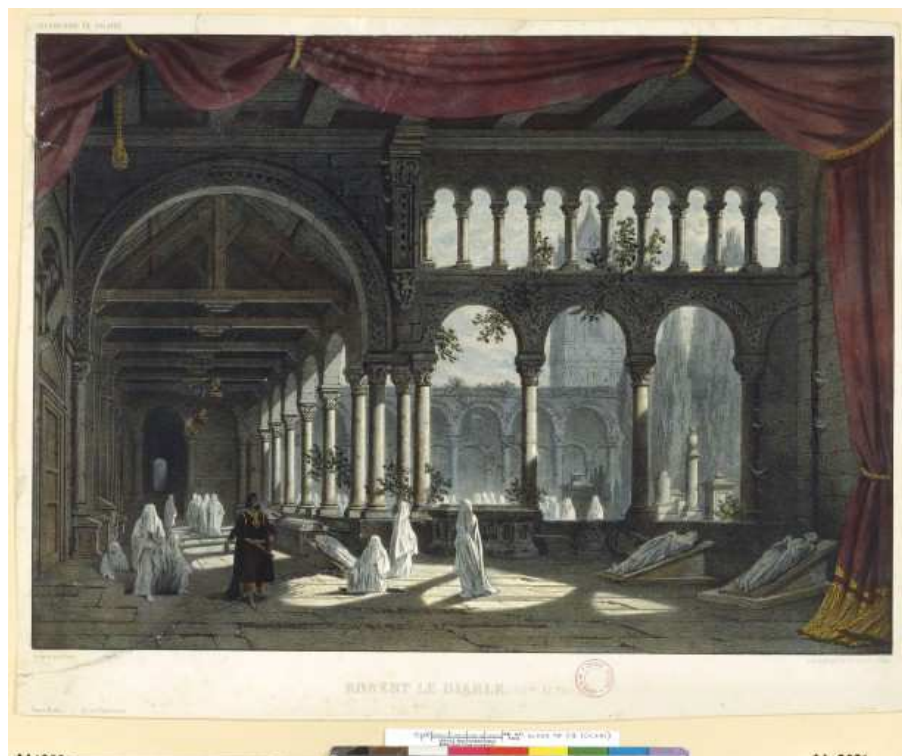
Robert le diable , acte 3. Décor de Pierre-Luc-Charles Ciceri, BMO : EST SCENES Robert Le Diable. http://visualiseur.bnf.fr/Visualiseur?Destination=Daguerre&O=7919134&E=JPEG&NavigationSimplifiee=ok&typeFonds=noir , consulté le 15 février 2014.