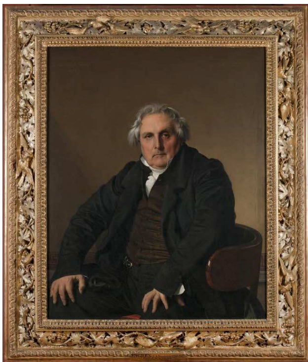
Louis-François Bertin, portrait de Jean-Auguste-Dominique Ingres, 1832.

Huile sur toile H 1,16 m x L 0,95 m, Musée du Louvre, Paris, France.