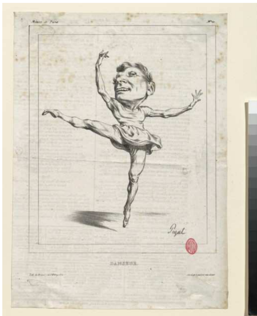
Danseur : portrait-charge de Jules Perrot.

soulignent ici les références au mime Bathylle ou à Néron, figures emblématiques de la littérature décadente.