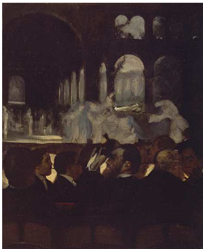
Le Ballet des nonnes de Robert le Diable , 1871, Edgar Degas Huile sur toile, 66 x 54.3 cm - Metropolitan Museum

http://www.metmuseum.org/toah/works-of-art/29.100.552 consulté le 15 février 2014