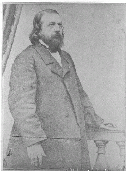
Portrait de Théophile Gautier vers 1860, Paul Nadar Épreuve sur papier albuminé contrecollée sur carton H. 0,31 x L. 0,29 Musée d'Orsay, Paris