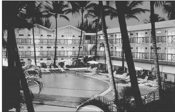
Un hôtel du groupe Accor en Martinique