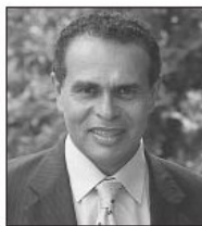
Léon Bertrand (AFP)

Le gouvernement prépare actuellement un plan en faveur des Antilles qui sera prochainement finalisé. Il prévoit notamment des mesures de délocalisation pour faciliter la res-