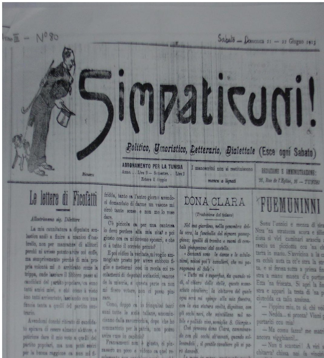
Annexe 7 – Fac-simile du titre et du sous-titre du n°80/ 21-22 juin 1913