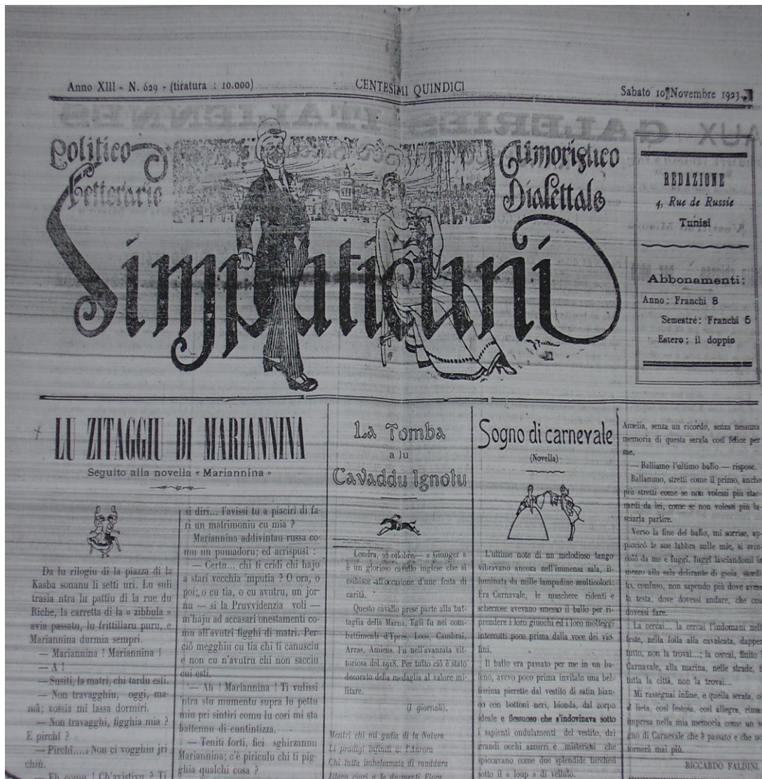
Annexe 8 – Fac-simile du titre et du sous-titre du n°629/ 10 novembre 1923