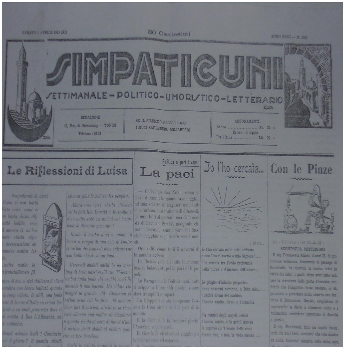
Annexe 9 – Fac-simile du titre et du sous-titre du n°1080/ 1 er avril 1933