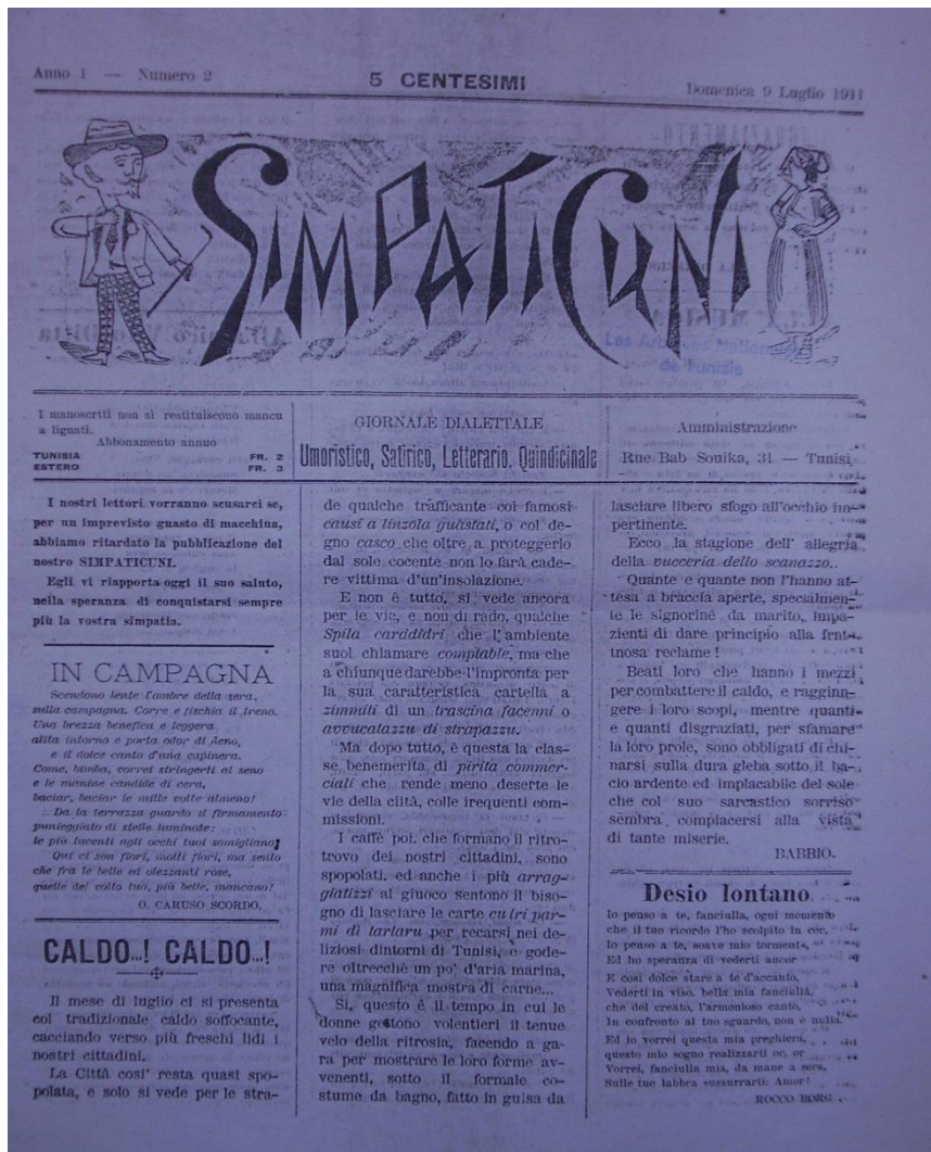
Annexe 3 – Fac-simile de la Une du journal italien Simpaticuni (9 juillet 1911, n°2)