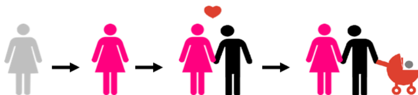
Figure 2.1. Conception hétéronormative des rapports entre sexe, genre, désir et conjugalité/parentalité

Alimentée par les théories discursives lacaniennes et la matrice sexe-genre-désir de Butler (2005), l'hétéronormativité tire donc son origine de la nécessaire construction binaire du discours, selon laquelle les identités humaines doivent nécessairement se limiter aux binômes homme/femme, masculin/féminin, hétérosexuel/homosexuel. Le modèle hétéronormatif présuppose de l'existence d'une conception rigide des rapports entre sexe, genre et désir. Par exemple, comme l'illustre la figure suivante, on s'attend à ce que les personnes nées de sexe biologique féminin adoptent une expression de genre et des rôles sociaux traditionnellement accolés au féminin, et développent un désir amoureux ou sexuel hétérosexuel, orienté vers les hommes. On associe dans ce contexte la normalité (ou la « naturalité ») à une correspondance étroite entre ces dimensions, et les expressions du genre et de la sexualité qui s'en écartent sont tantôt ignorées 2 , tantôt considérées comme anormales et conséquemment stigmatisées – à différents degrés.