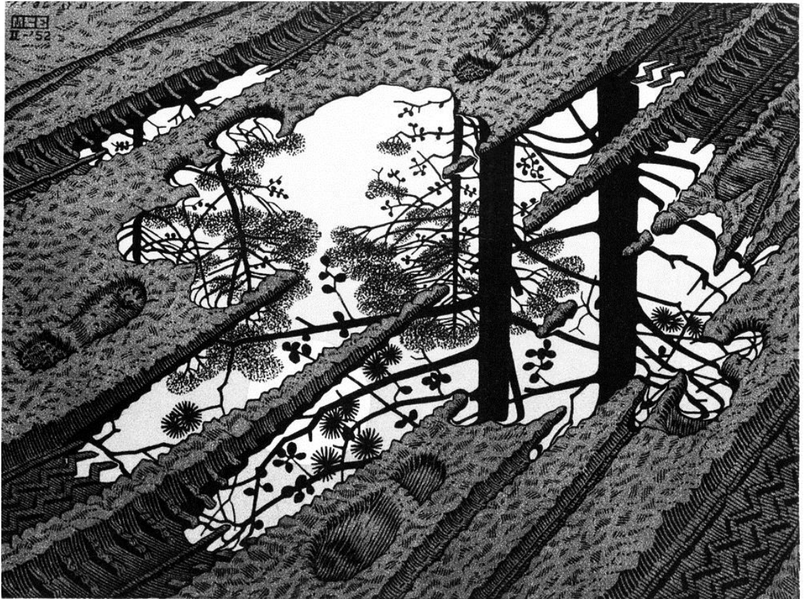
M.C. Escher, Puddle – gravure sur bois, 1952 – d'après http://www.mcescher.com/gallery/back-in-holland/puddle/