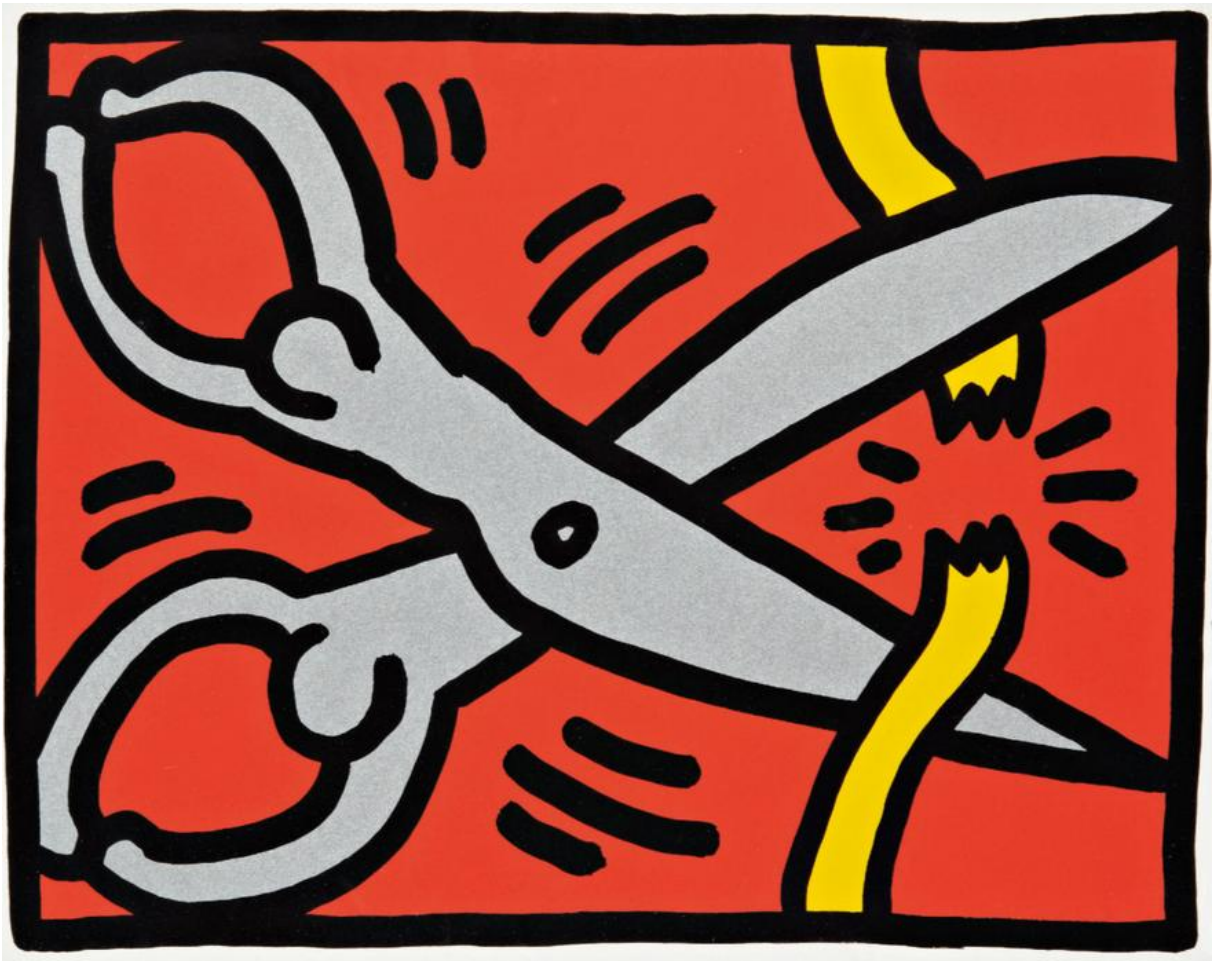
Scissors, from Pop Shop III (1989)