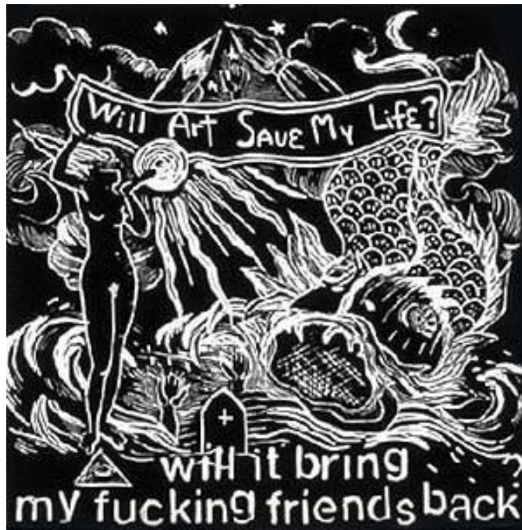
Will Art Save My Life? (1996)