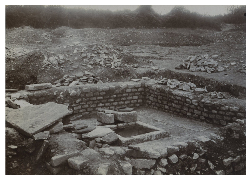
Mise au jour d'une chapelle dédiée à Hygie en 1909. L'eau sacrée jaillit dans une vasque située aux pieds de la statue de la déesse. Il s'agit plutôt de Sirona.