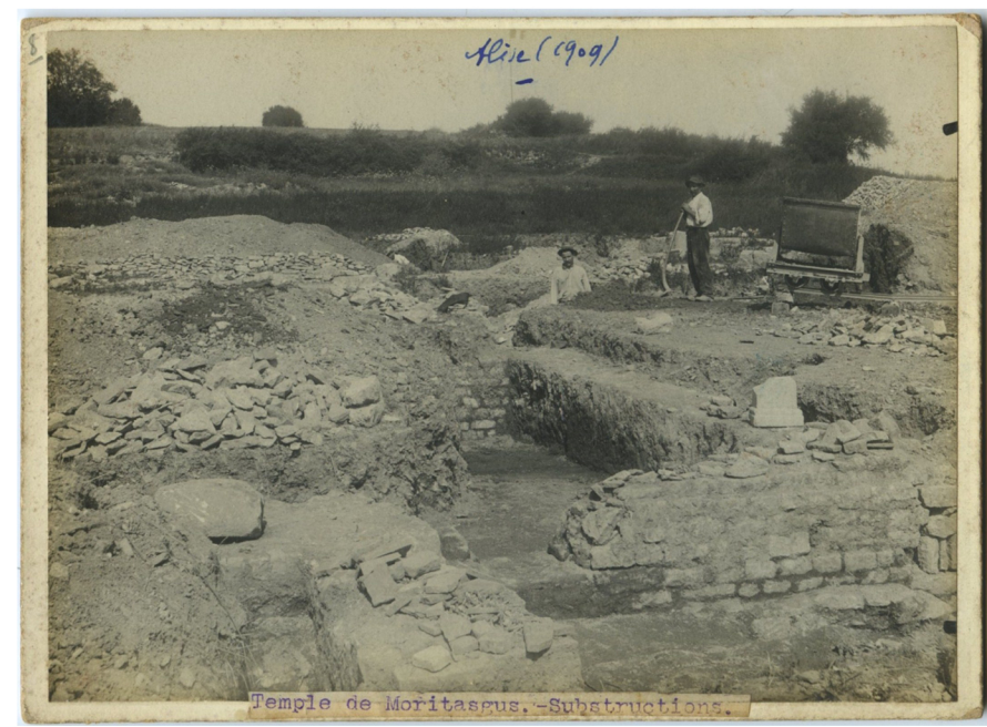
Les fouilleurs d'Espérandieu. A droite, un dcauville est utilisé pour évacuer les déblais recouvrant les thermes en 1910.