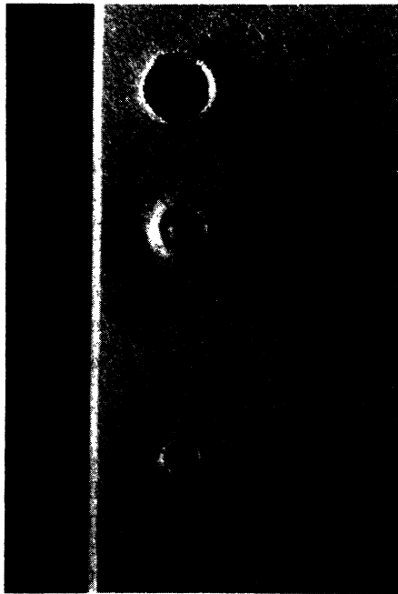
Fig. 2. — Microphotographies de cratères formés par des impacts laser d'énergie croissante dans une feuille d'aluminium de 1 mm d'épaisseur.

[Microphotography of craters produced by increasing power laser on an aluminium target (thickness 1 mm).]