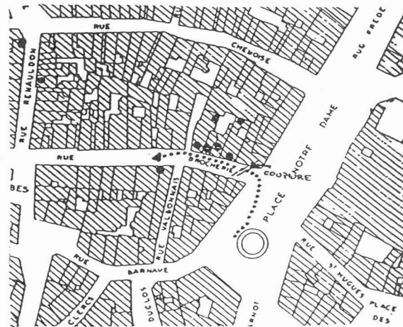
En pointillé, le trajet du preneur de son (fragment C). Coupure par timbres et intensité.

Ce type d'outil permet donc de modifier la mentalité architecturale en introduisant les qualités sonores dès la conception et, par ailleurs, contribuer par l'ensemble des recherches et des innovations de l'équipe à l'avancement de la méthodologie interdisciplinaire dans le domaine de l'environnement urbain.