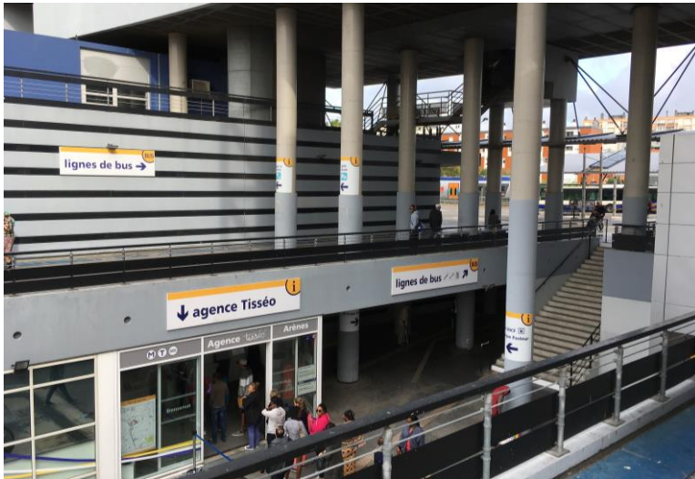
Photo 1 (Cyprien Richer, septembre 2017). Le hall d'échanges de la station de métro Toulouse Arènes. La gare SNCF est fléchée par le souterrain. A l'arrière-plan, on distingue le pôle bus et un TER à quai.

Photo 2 (Cyprien Richer, septembre 2017). Panorama du pôle d'échanges de Toulouse Arènes : de gauche à droite, la halte ferroviaire accessible par un passage souterrain, la gare routière pour les bus urbains, sous l'immeuble se trouve la station de métro (et derrière lui, une place avec un arrêt de tramway), et à droite, le stationnement du parc-relais. Selon Vaclav Stransky, l'organisation spatiale du PEM est un exemple d'espace représenté comme neutre et fonctionnel. Face à l'environnement bâti qui se démarque du reste du quartier par sa hauteur, sa densité et un parti pris moderniste, la fonction transport du pôle d'échanges sont d'une grande discrétion au point de n'être que peu apparentes depuis les voies environnantes : la gare SNCF et la gare bus sont dissimulées par les bâtiments des résidences universitaires, l'entrée de la station de métro se fait sous un bâtiment (Stransky, 2006).