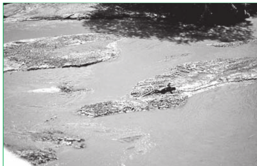
Photo 1 – Les macrophytes aquatiques, ici des renoncules, piègent les boues du bouchon vaseux lors de la vidange du barrage de Vézins-La Roche-qui-Boit – Photo : Jacques Haury.

– en favorisant un captage biologique des sédiments fins à leur surface, par l'épiphyton qu'ils supportent.