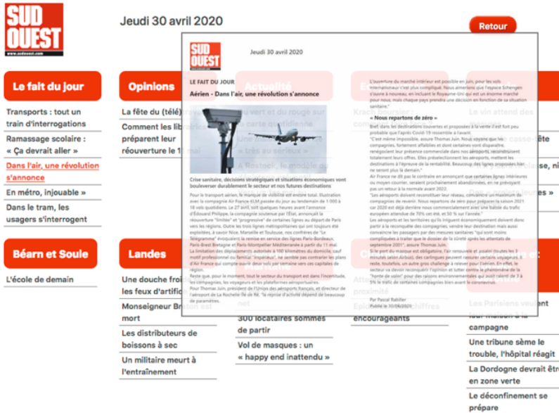
Figure 2 Affichage de l'aperçu d'une page lors du survol d'un lien (seulement dans la condition « innovante »)