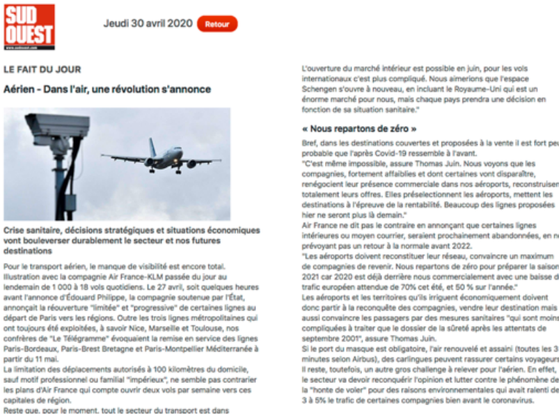
Figure 3 Affichage de la page ciblée