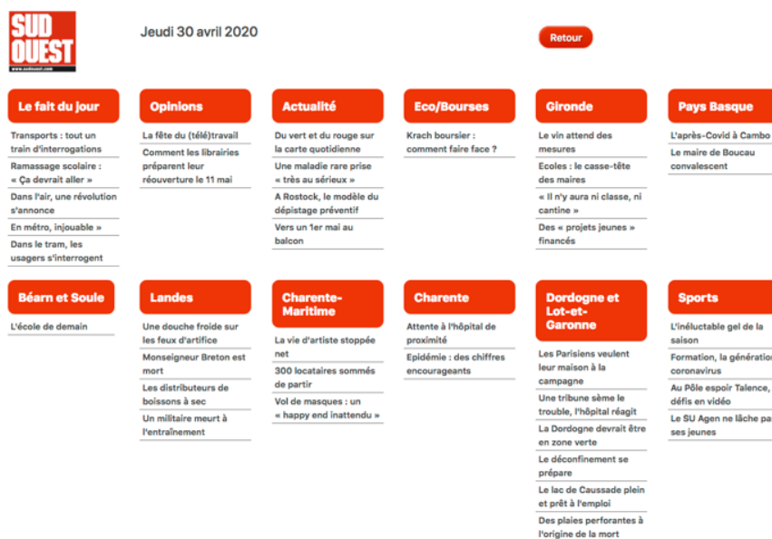
Figure 1 Affichage de la page d'accueil