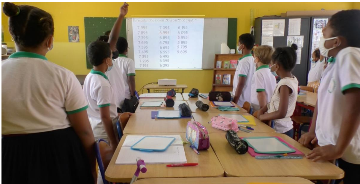
Figure 2. Elèves debout pendant le jeu du furet et affichage au tableau.

Les 24 élèves énoncent les nombres à tour de rôle de 7995 à 5695. Cette phase dure environ 2 minutes. A chaque réponse, l'enseignante affiche le nombre énoncé, en écriture chiffrée, au tableau, sous le précédent. (cf. fig 1).