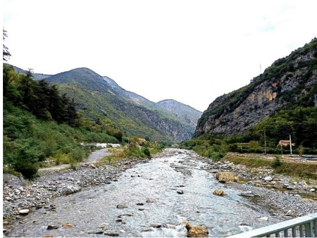
Figure 4 Le fleuve (la Roya) depuis le pont de Breil-sur-Roya

La Roya, vallée frontalière avec l'Italie, se distingue par son éloignement des grands pôles urbains et une démographie scolaire en baisse.