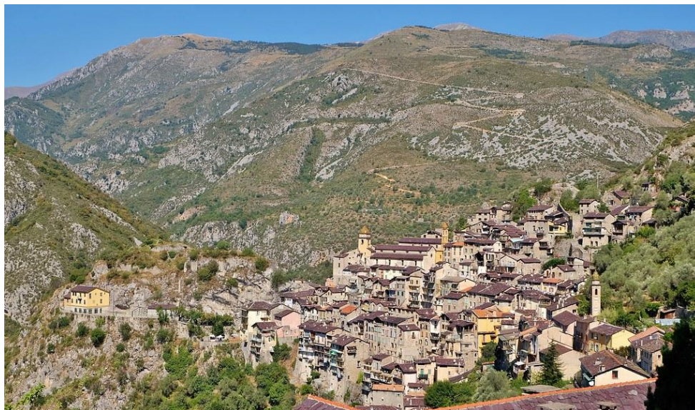
Figure 2 Vue sur le village de Saorge, vallée de la Roya