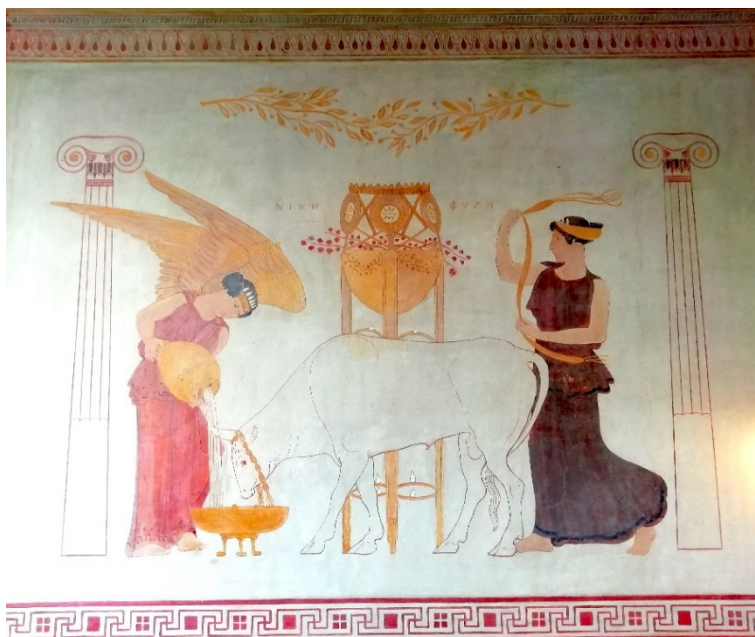
Fig. 1. Fresque. Taureau sacrificiel - ΝΙΚΗ - ΦΥΛΗ