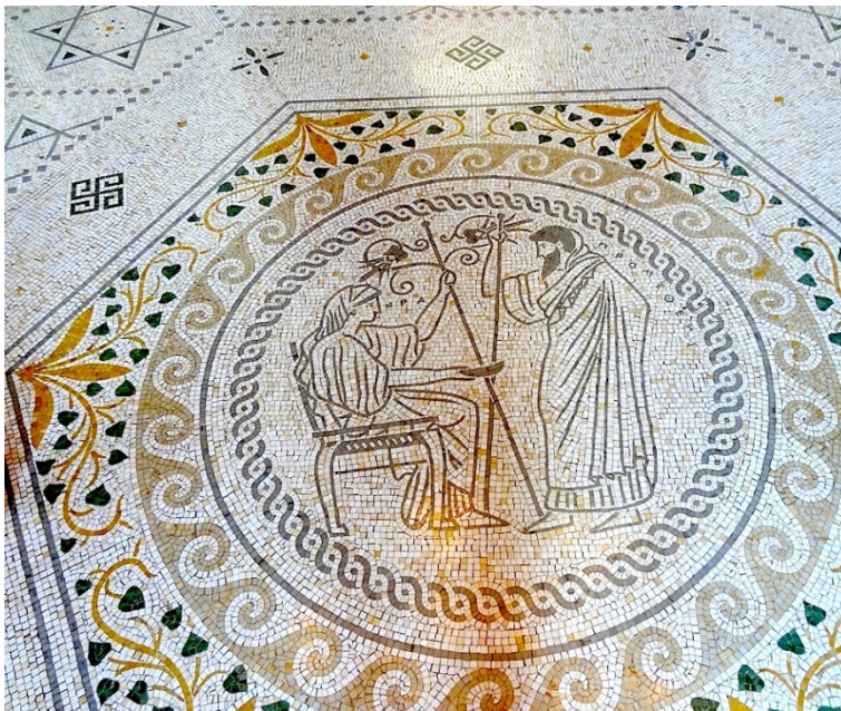
Fig. 3. Mosaïque. Héra & Prométhée ΝΡΑ ΠΡΟΜΕΘΕΥΣ