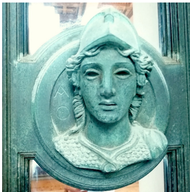
Fig. 5. Ferronnerie. Porte de l'Olympe. Athéna AΘENA