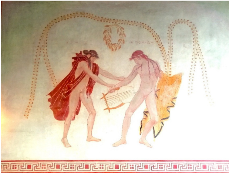
Fig. 2. Fresque. Hermès, Apollon & la lyre ΕΡΜΗΣ ΑΠΟΛΛΩΝ