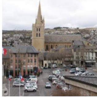
Vue sur la cathédrale de Mende, E MARTIN, 2020

Photographies prises dans la ville qui commande le bassin de vie (Mende)