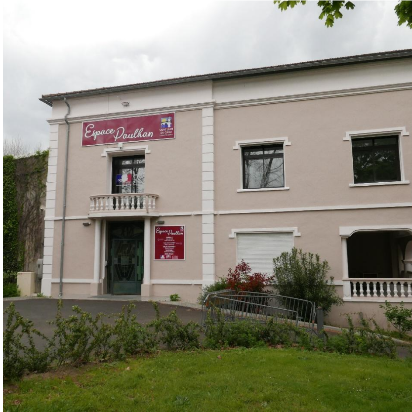
Figure 4 : L'Oustal, centre socio-culturel de la petite ville de Saint-Jean-du-Gard dont Bernard connaît l'histoire. Réalisation Elise Martin, 2020

« Ah oui bien sûr je reconnais. C'est de l'autre côté du Gardon. C'est le centre socio-culturel de l'Oustal. Il a déménagé il y a six ans (Bernard me donne le chiffre très précisément). Il s'agit d'une ancienne usine Rica Lewis. Des ouvriers y ont fabriqué des jeans jusque dans les années 1980. Avant le centre social était dans cette rue [il montre la direction], mais c'était devenu trop petit donc ils ont tout déménagé là-bas. Ça fait un peu plus loin ».