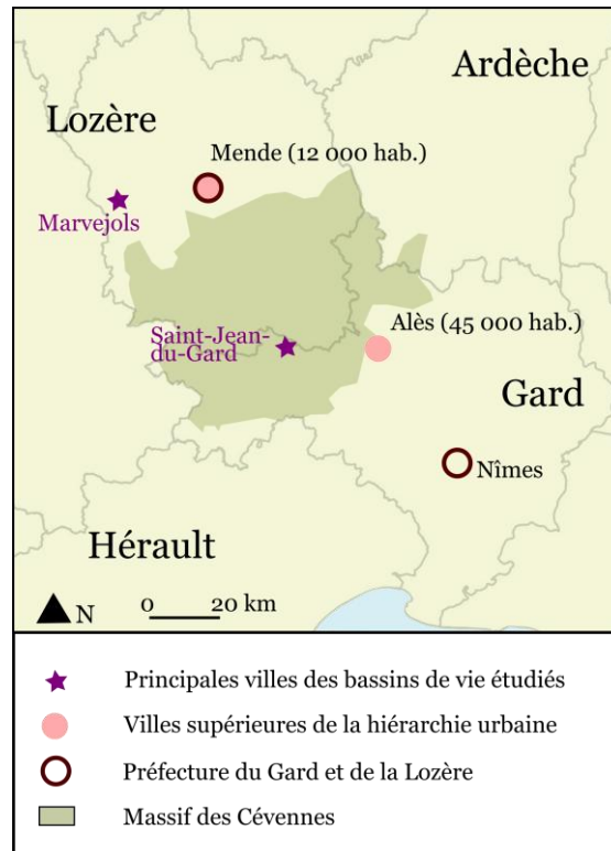
Figure 2 : Carte de localisation des terrains et des villes évoquées avec les enquêtés-es. Réalisation Elise Martin, Inkscape , 2025