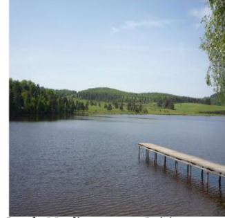
Lac du Moulinet

Photographies de sites paysagers et/ou remarquables du sous-ensemble départemental (ouest lozérien)