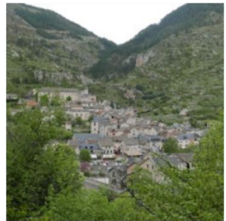
Sainte-Enimie, E MARTIN, 2020

Figure 1 : Exemple de cartes de memory présentant des images du terrain lozérien à trois échelles. Réalisation Elise Martin ou Google Street View 7 , 2024