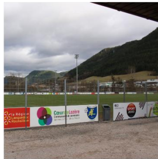
Stade de Mende, E MARTIN, 2020

Photographies de sites paysagers et/ou remarquables du sous-ensemble départemental (ouest lozérien)