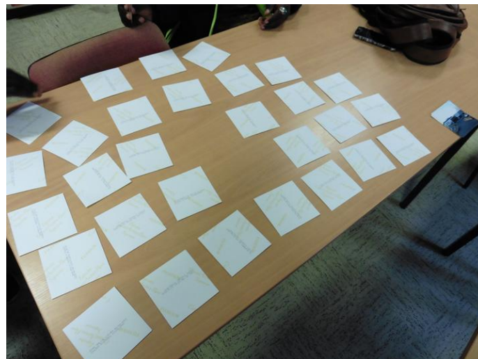
Figure 3 : Partie de memory pendant un cours de français donné à des personnes exilées, Maison du Service Public, Marvejols. Réalisation Elise Martin, janvier 2021.

Le jeu du memory n’est pas encombrant et peut être emporté partout. Lors du travail de recherche doctorale, les parties se sont déroulées dans différents lieux dès que la situation le permettait. Pour discuter et jouer avec les personnes accueillies par le DNA (Dispositif national d’asile), j’ai installé le jeu dans des cafés ou encore des lieux publics à l’instar de la Maison France Services de Marvejols où se tiennent des cours de français donnés par des bénévoles (figure 3).