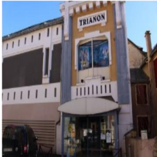
Cinéma Le Trianon, centre de Marvejols, E MARTIN, 2020

Photographies prises dans le bassin de vie autour de la commune d'accueil (Marvejols)