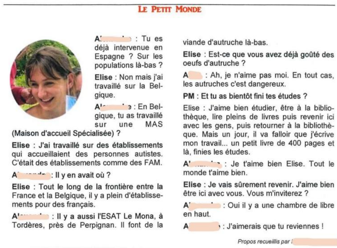
Figure 7 : Interview menée par des ouvrier-es d'ESAT dans les Cévennes, journal Le Petit Monde , mai 2021

l'interview que les ouvrier-es d'ESAT ont mené avec moi pour Le Petit Monde , journal autoproduit (figure 7) 16 .