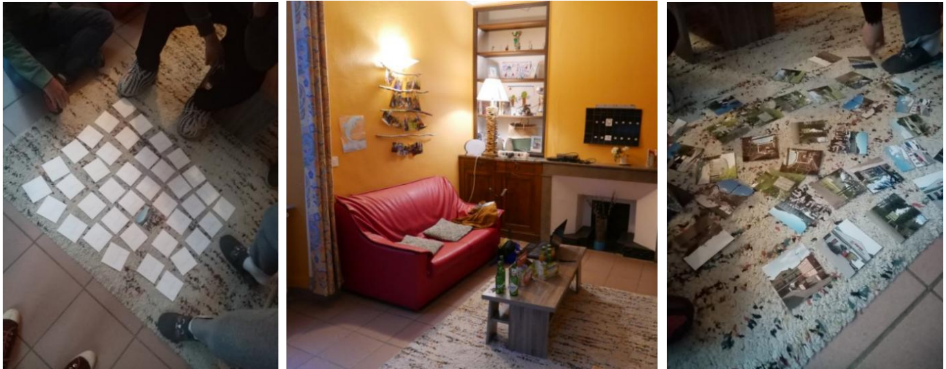
Figure 6 : Partie de memory pendant l'apéritif, foyer d'hébergement destiné aux ouvriers-e d'ESAT, Saint-Jean-du-Gard. Réalisation Elise Martin, mai 2021

Décaler le cadre, c'est enfin faire entrer le dehors dans le dedans , autrement dit rendre plus poreux des dispositifs et des établissements parfois hermétiques. Le contenu du jeu, à savoir les photographies illustrant des lieux et environnements plus ou moins proches, a permis de faire sortir les personnes des cadres spatiaux de l'accueil. En propulsant les personnes à l'extérieur par la vue, les photographies alimentent une logique de « connivence avec le territoire » (Ben Ali, 2025, p. 53). D'un point de vue thérapeutique, l'introduction du jeu et ma présence constituent de petites « greffes d'ouvert », au sens où elles permettent une connexion vers le dehors 15 .