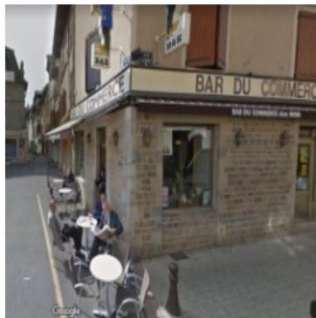
Bar chez Mimi et Gigi, centre de Marvejols

Photographies prises dans la ville qui commande le bassin de vie (Mende)