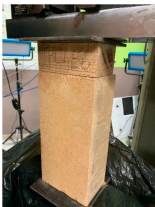
Fig. 3 : Essais en compression de l'ensemble brique-traverse

Le module d'élasticité en flexion des solives en douglas a été caractérisé par des essais en flexion 4 points, avec une valeur moyenne mesurée de 11 GPa, en accord avec les valeurs usuellement observées pour les bois résineux.