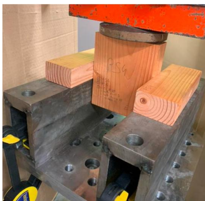
Fig. 4 : Essai push-out solive-vis-traverse