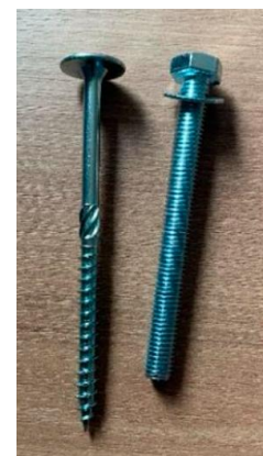
Fig. 5 : Vis bois 8 mm et vis mécaniques M10