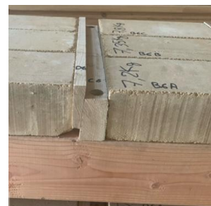
Fig. 2 : Système de connexion